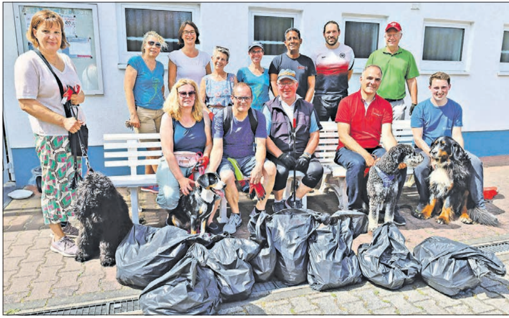
Bei bester Stimmung präsentieren sich die Helfer zusammen mit Bürgermeister Alexander Immisch (3. v. r.) – mehrere Säcke mit Müll und Abfall haben sie anlässlich des 20-jährigen Bestehens der Kampagne „Sauberhaftes Hessen“ zusammengetragen.