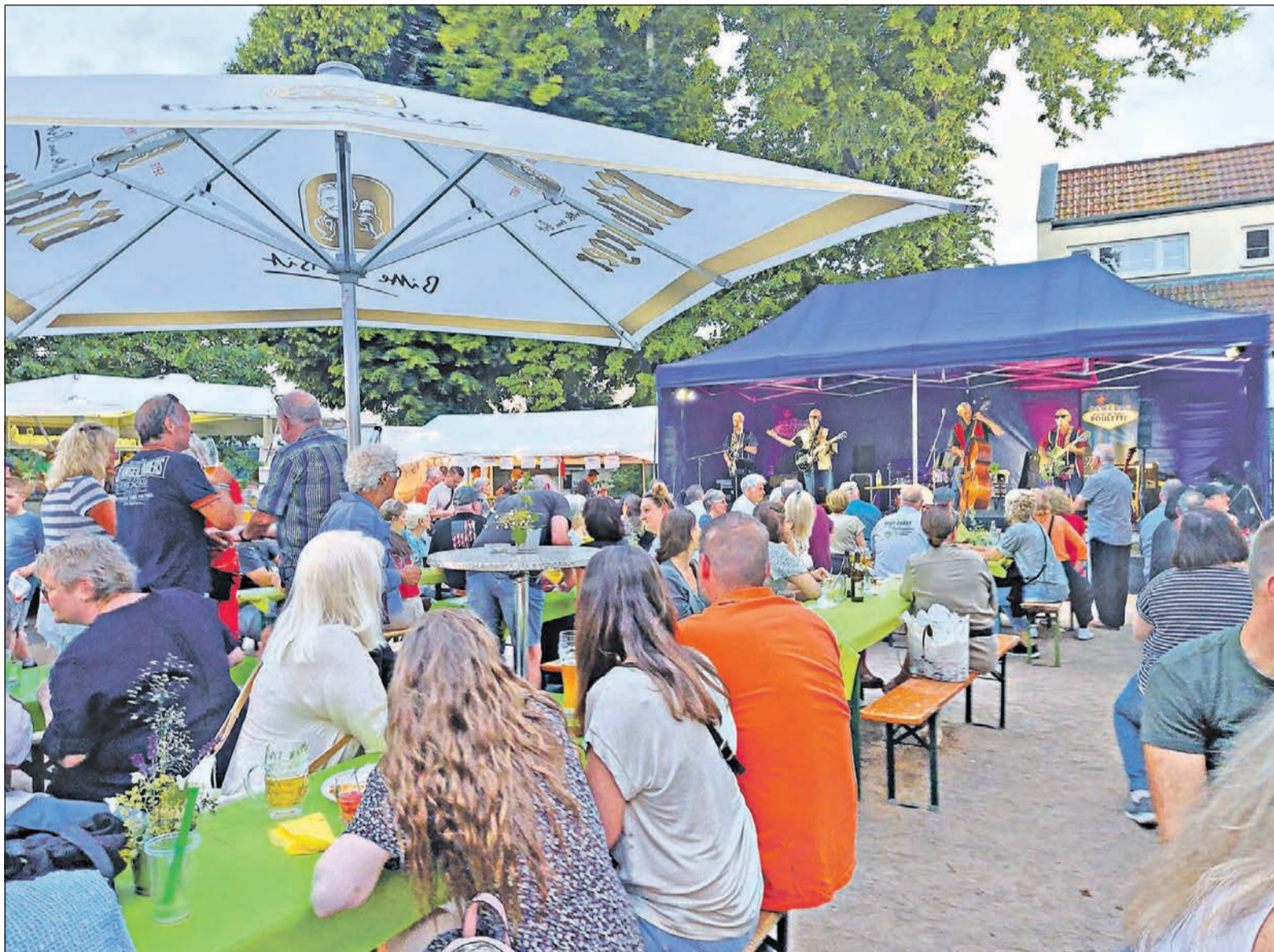
Die Band „Rock'n'Roll Roulette“ sorgt am Haus der Vereine beim Altstadtfest für gute Stimmung. Die Besucher freuen sich, nach zwei Jahren Pause endlich wieder gemeinsam zu feiern.

Engel & Völkers Bad Soden Engel & Völkers Immobilien Deutschland GmbH Zum Quellenpark 9 · 65812 Bad Soden Telefon +49 6196 52 41 134 taunus@engelvoelkers.com Immobilienmakler