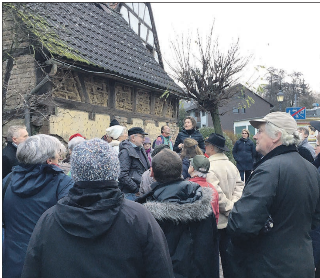
Stopp am „Grünen Haus“.

Bei Kaffee und Kuchen im „Mutter Krauss“ wurde anschließend eifrig über das Gehörte und Gesehene diskutiert.