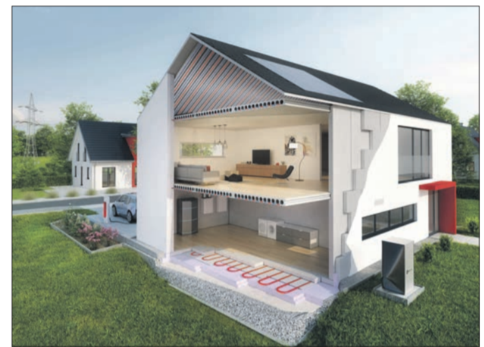
Die Kombination von oberflächennahen, schnell reagierenden Klimadecken und Bauteilaktivierungen ist eine hocheffiziente Möglichkeit zur Speicherung regenerativer Überschussenergie.

Das Geheimnis liegt in der Kombination von oberflächennahen, schnell reagierenden Klimadecken in Kombination mit Bauteilaktivierungen. Ist die Speichertemperatur hoch genug, wird aktiv Wärme zum Heizen vom bauteilaktivierten Energiespeicher entnommen (bzw. im Kühlbetrieb zugeführt). Damit wird ein träges Passivsystem mit einem, thermisch getrennten und reaktionsschnellen Aktivsystem bedarfsgerecht und dynamisch kombiniert. Es gibt derartige Hybridsysteme von der IGR für Neubau und Sanierung, für Massiv- und Trockenbau. Das Heizen und Kühlen selbst erfolgt über