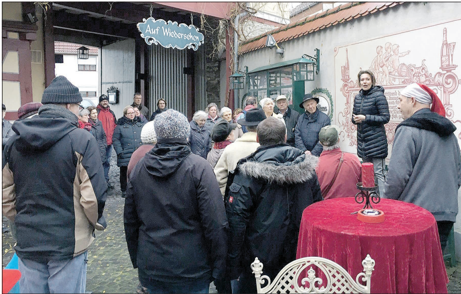
Start im Hof von Mutter Krauss.