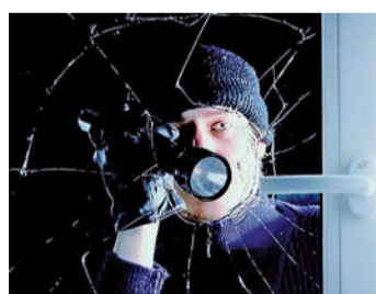
Im Schutz der Dunkelheit schlagen Einbrecher wieder gehäuft zu. Ein Funkalarmsystem für Fenster und Türen schlägt die Täter in die Flucht, bevor sie ins Haus gelangen.