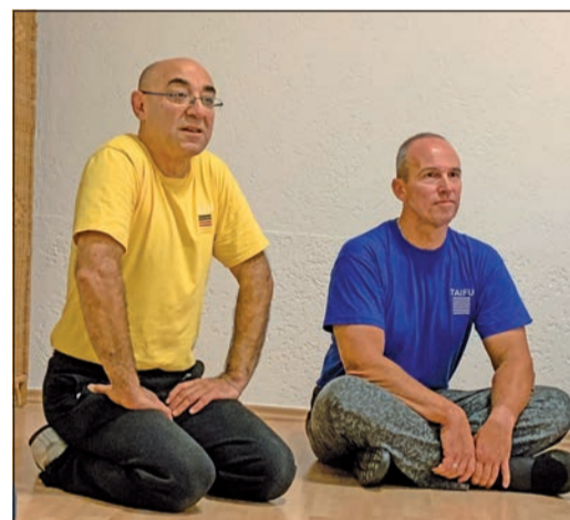
Volle Konzentration in der Taifu-Kampfkunstakademie...

Weitere Termine und Informationen auch im Internet unter www.marcusgipp.de .