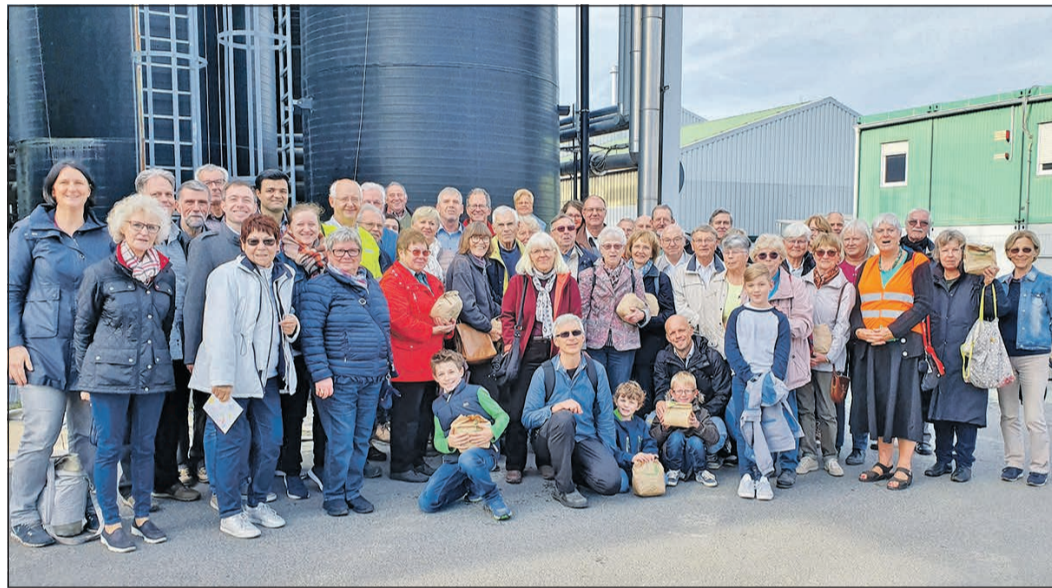
An den Deponieführungen besteht immer großes Interesse.

Die Rhein-Main Deponie GmbH (RMD) ist ein Entsorgungsunternehmen mit Hauptsitz in Flörsheim-Wicker. Zum RMD Aufgabengebiet gehören sowohl die Entsorgung, Beseitigung und Verwertung von mineralischen und biologischen Abfällen als auch die Deponienachsorge. Ein Schwerpunkt liegt auf der Behandlung von Abfällen zur Strom- und Wärmeenergiegewinnung. Gesellschafter sind der Main-Taunus- und der Hochtaunuskreis. Das oberste Ziel des Unternehmens ist eine sichere und umweltgerechte Entsorgung der Restabfälle nach möglichst umfangreicher Rückführung in die Kreislaufwirtschaft.