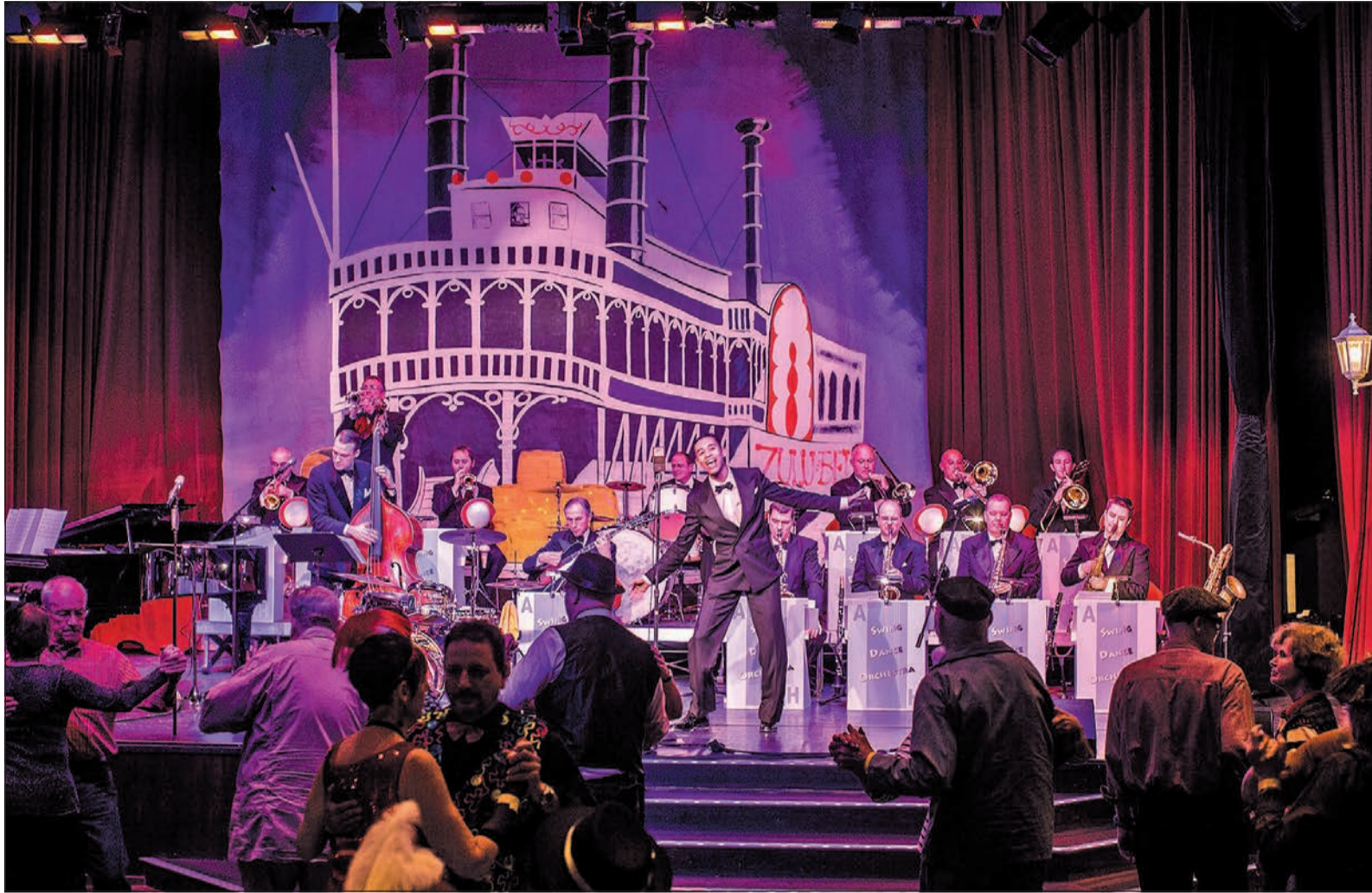
Fast wie in New Orleans...