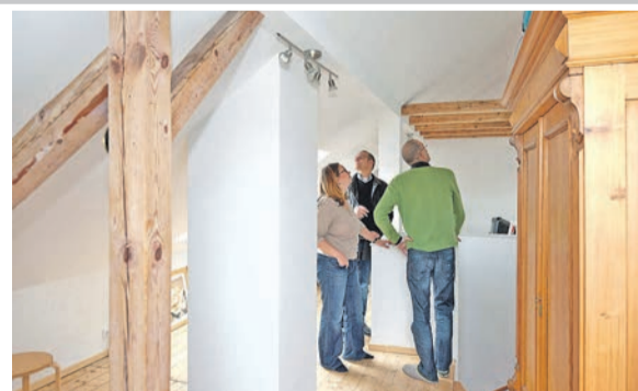
Beim Kauf einer älteren Immobilie empfiehlt es sich, das Gebäude vor Vertragsschluss von einem unabhängigen Sachverständigen auf Schadstoffe abklopfen zu lassen.

späteren Sanierung eingebaut wurden. Manche dieser Mittel belasten die Luft in Wohnräumen noch nach Jahrzehnten und können bei den Bewohnern unterschiedlichste gesundheitliche Beeinträchtigungen auslösen. Sie reichen von unspezifischen Kopfschmerzen über gereizte Schleimhäute oder Allergien bis zu lebensbedrohlichen Krebsgefahren. Die Kosten für eine Schadstoffsanierung können das Budget für den Erwerb und die Modernisierung einer Bestandsimmobilie deutlich in die Höhe treiben oder den Kauf sogar uninteressant machen. Man sollte sich daher noch vor dem Abschluss eines Kaufvertrags schlaumachen. Wer auf Nummer sicher gehen will, lässt ein Gebäude vor dem Kauf von einem Sachverständigen, etwa einem unabhängigen BSB-Bauherrenberater, unter die Lupe nehmen. Als Bauingenieur oder Architekt kennt der Berater zeit- und regionaltypische Probleme und kann den Hausbesitzer in spe gezielt darauf hinweisen, wann eine gründliche Untersuchung angeraten ist.