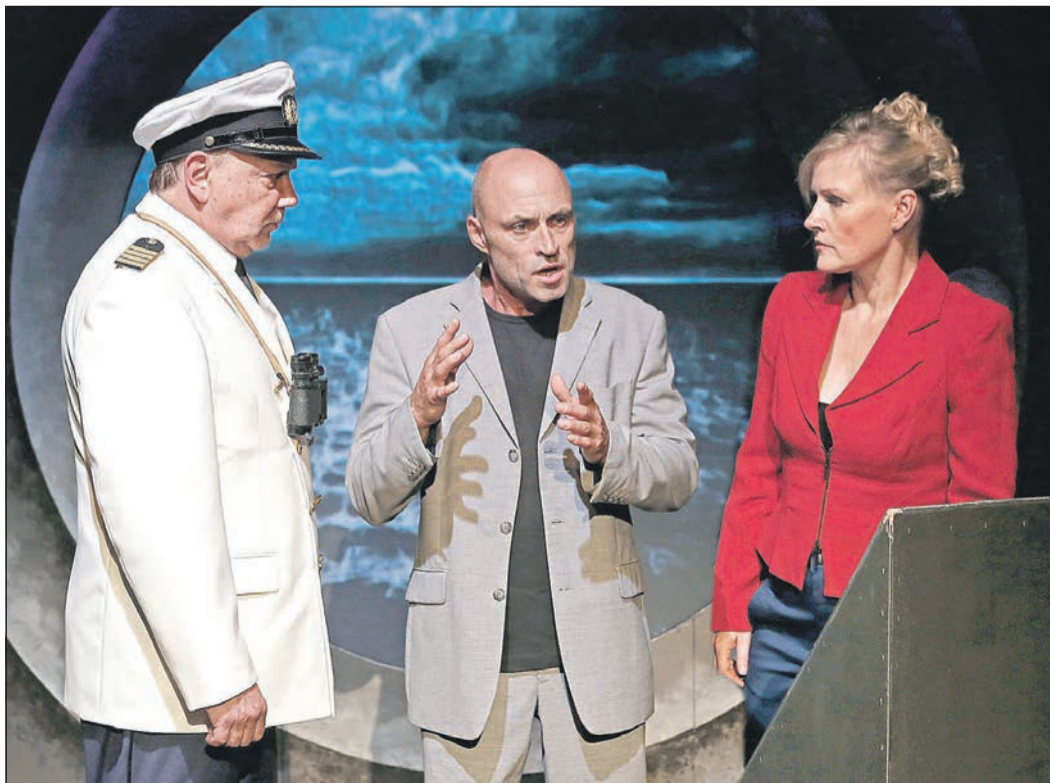
Das Berliner Kriminal Theater bringt spannende Unterhaltung in die Stadthalle.

Eintrittskarten gibt es in den Schreibwarenhandlungen Schlegel und Bobas in Eschborn sowie bei Blumen Buchholz in Niederhöchstadt für 14 Euro, 9 Euro und 7 Euro.