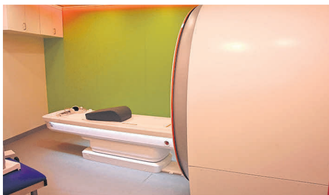
Bietet eine hohe Untersuchungsqualität und ist leiser als ältere Modelle: das neue MRT in Weilburg.

Das Großgerät befindet sich nun neben dem CT in der zentralen Röntgenabteilung im Erdgeschoss nicht weit von der Notfallversorgung entfernt. Rund 1,4 Millionen Euro hat das Kreiskrankenhaus Weilburg in die Schaffung der dafür notwendigen baulichen Voraussetzungen investiert, insbesondere auch in die Statik hinsichtlich der Abstützung der Decke bei einem