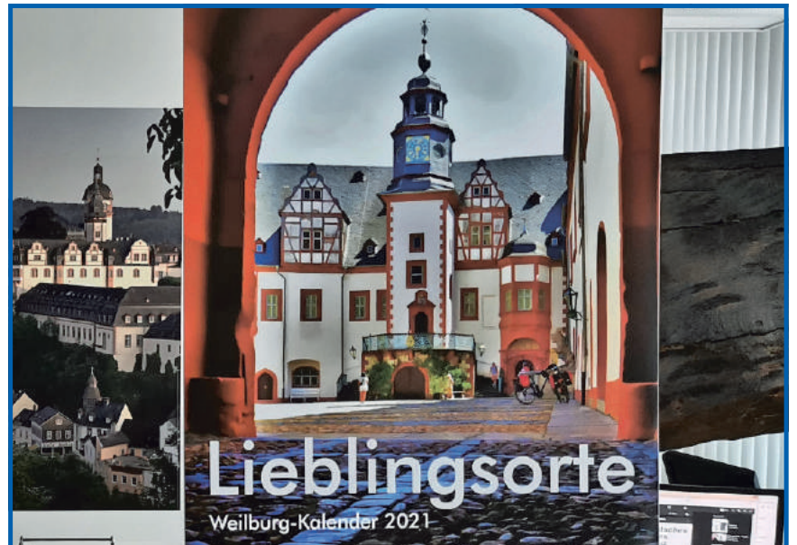
Der neue Weilburg-Kalender 2021