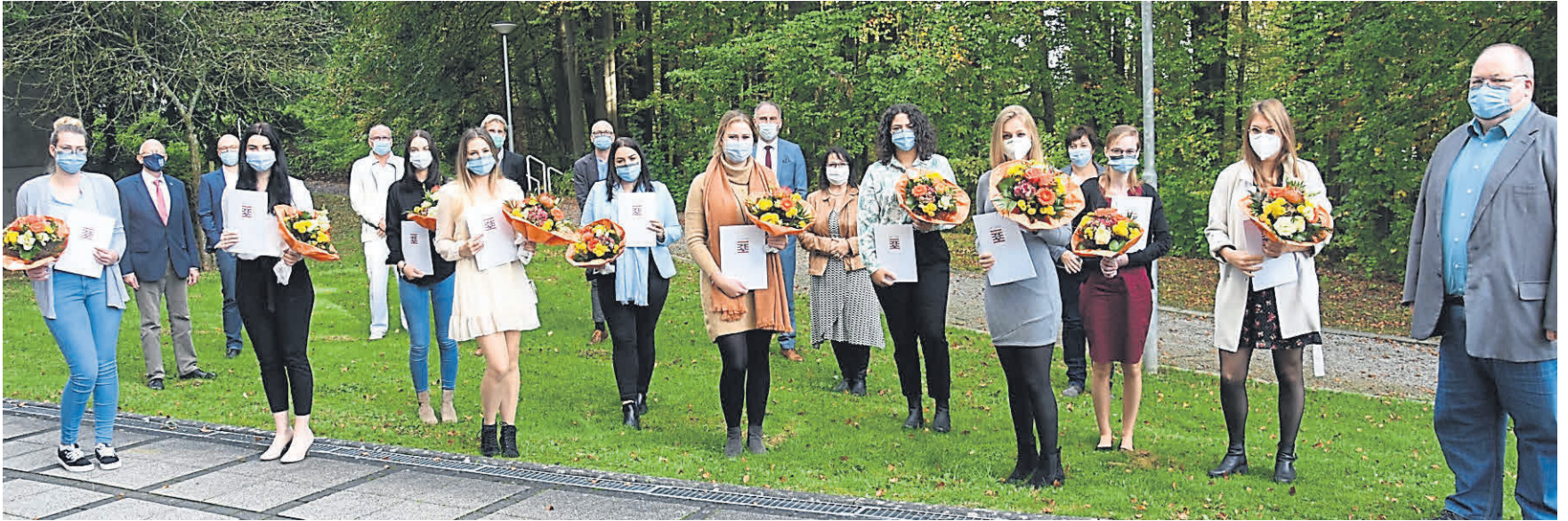
Zeugnisse und Blumen: Nach der Übergabe stellen sich alle zum Gruppenfoto zusammen.