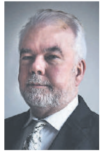
Wolfgang A. Eck

Notwendige hinaus einkaufen zu gehen. Wenn Existenzen bedroht sind, kippt die Stimmung. Umso wichtiger ist es, dass wir alle unseren lokalen Handel wo es nur geht unterstützen. Dass wir denen helfen, die es jetzt besonders schwer haben. Solidarität, wie wir es im Frühjahr erlebt haben – das wünsche ich uns allen. Bleiben Sie gesund!“