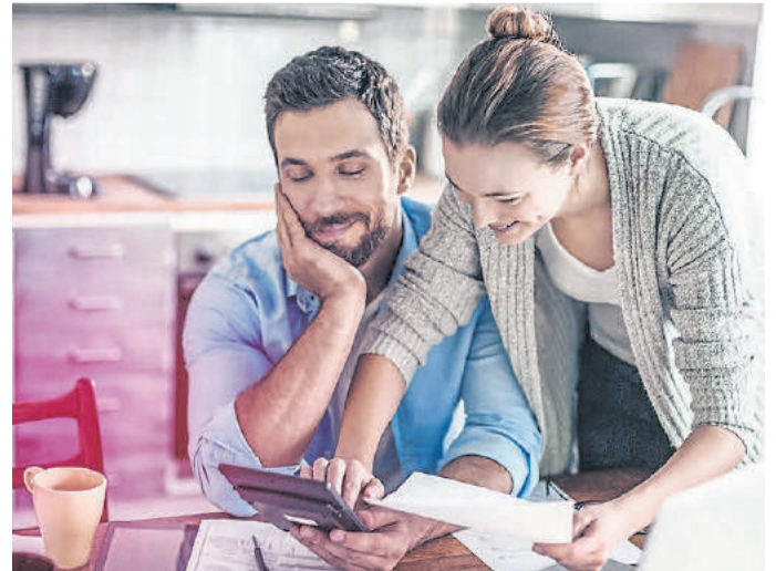
Der Solidaritätszuschlag entfällt für fast alle ab 2021. Eine gute Möglichkeit, mit einer Altersvorsorge zu starten.

der Mann noch Frau, lernt in der Schule etwas darüber, wie das Steuer- oder das Rentensystem funktioniert. Oder wie es gelingt, Geld anzulegen. Um damit anzufangen, muss man aber wissen, wie das funktioniert. Männer schaffen es einfacher loszulegen. Frauen investieren weniger oft. Sie wollen verstehen, bevor sie loslegen. Sie wollen zu 100 Prozent alles richtig machen. Männer hingegen probieren in der Regel einfach mal aus. Dabei geht natürlich auch mal etwas schief und sie treffen eine falsche Entscheidung. Diese Herangehensweise ist trotzdem besser. Es bringt mehr, etwas nur zu 80 Prozent richtig zu machen als zu 100 Prozent gar nichts zu tun. Sie möchten Ihre Altersvorsorge nicht weiter aufschieben? Dann fangen Sie jetzt mit diesen fünf Schritten an: 1. Status Quo ana-