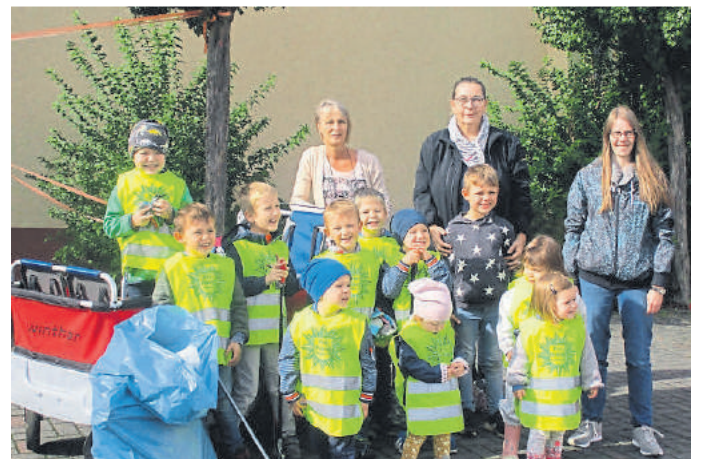
Auch in Ahausen waren die Kinder fleißig.

stattfindet, ist es, das Bewusstsein für eine intakte Umwelt, den Wert von Ressourcen und die Wichtigkeit von Abfallvermeidung zu schärfen. Seit 2002 haben je-