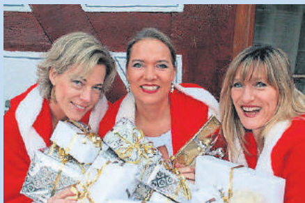
Ladies XXmas-Nyght

Eintritt: 20 Euro, Kartenreservierung direkt bei www.lindencult.de , eine Vorabüberweisung ist notwendig, die Karten liegen an der Abendkasse bereit. Kontakt: LindenCult, Weilburg-Hasselbach, 35781 Weilburg, Telefon/Fax: 06471/51475