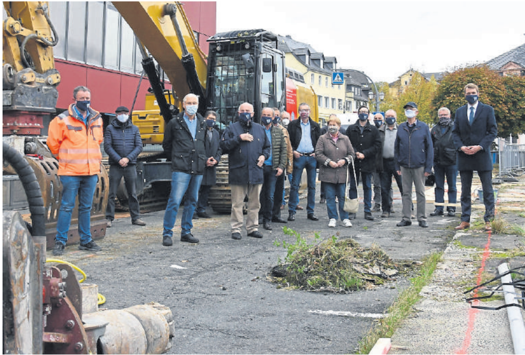
Gruppenfoto zum gelungenen Start der Abrissarbeiten.

So hatte der frühere Bürgermeister Rudolf Lehmann am 2. Januar 1963 einen Bauantrag für 30 Parkplätze gestellt mit dem baulichen Ziel: „Die Schlankeheit soll den leichten Charakter der Konstruktion betonen“. Schon damals war das Parkdeck eine gemeinsame Maßnahme von Kreissparkasse Weilburg und Stadt Weilburg.