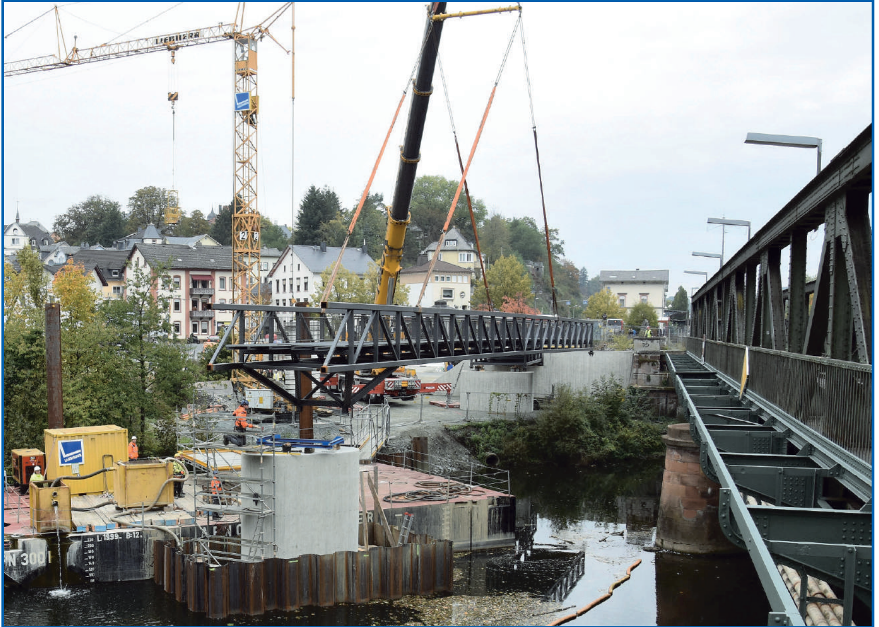
Weilburgs neue Lahnbrücke für Fußgänger und Radfahrer schwebt ihrer Fertigstellung entgegen