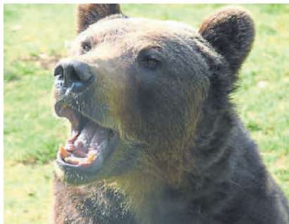
Auch der Bär vermisst die Besucher.

zunächst für den November 2020 schließen. Dies gilt auch für die angeschlossene Gaststätte „Hessenhaus“. „Die Arbeiten innerhalb des Wildparks müssen natürlich von unserem Personal weitergeführt werden, so dass eine tägliche Präsenz auf der Fläche gewährleistet ist“, fügt Wildparkleiter Jürgen Stroh an.