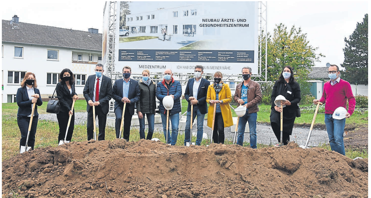
Die Beteiligten kurz vor dem ersten Spatenstich.