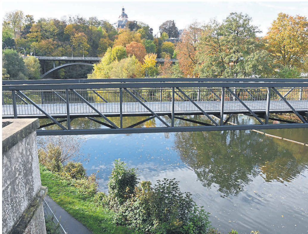
Idyllischer Blick auf die neue Brücke und das Schloss.

Zur Geschichte der Brücke: erst nach langen Diskussionen im Weilburger Stadtparlament konnte im August 2018 mit großer Mehrheit der Be-