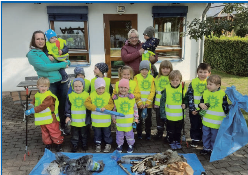
Sauberhafter Kindertag in den Weilburger KiTas