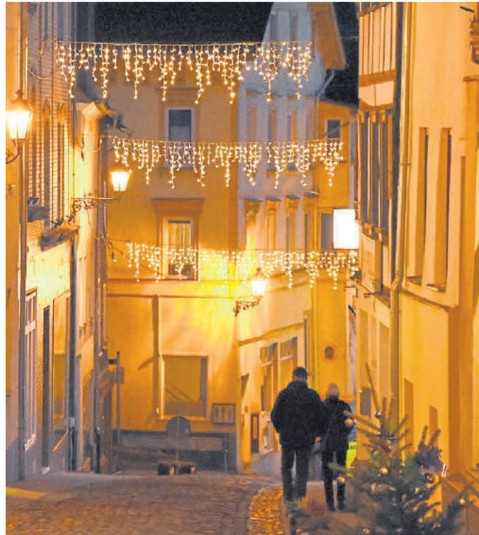
Trotz Absage: Wunderschöne Altstadtbeleuchtung.

Der Weilburger Weihnachtsmarkt lebe von seinem einzigartigen Ambiente auf dem Marktplatz, dem persönlichen Treffen zum Jahresende und dem unbeschwertem Genuss von Speisen und Getränken. Aufgrund der Corona-Pandemie werde dieses Flair in diesem Jahr auf keinen Fall herzustellen sein. „Der Weihnachtsmarkt ist immer ein Markt für alle, so dass zudem eine Beschränkung des Zutritts und ein Absperren des Marktplatzes für uns keine Option sind“, so das Stadtoberhaupt, „als Veranstalter müssen wir sicherstellen, dass die maximal zulässige Anzahl von Menschen nicht überschritten