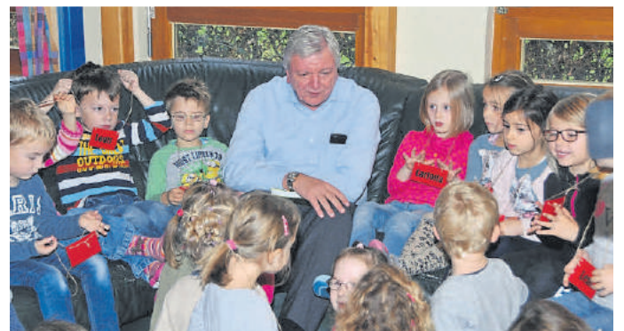
Ministerpräsident Volker Bouffier besuchte die Kinder im Jahr 2015.