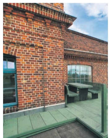
Die Terrassendielen im angesagten Lorbeer-Farbton werden zum Hingucker.

sich auch so an - und sind dennoch wesentlich robuster und langlebiger. Dazu werden Naturholzfasern aus nachhaltiger Forstwirtschaft mit umweltfreundlichen Additiven verfeinert, sodass sie auch Regen und anderen Wetterlagen mühelos standhalten. Das Verbundmaterial behält die Natursignierung von Holz und eine feine Maserung. Die Unterkonstruktion häufig weiter genutzt werden, lediglich die eigentlichen Dielen werden ausgetauscht. Unter www.megawood.com gibt es einen interaktiven Terrassenplaner als Augmented-Reality-App für Smartphone und Tablet.