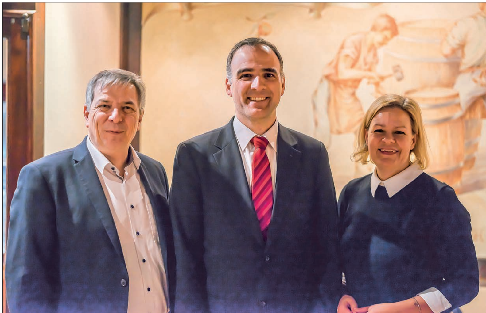
Gesprächsrunde zum Thema „Familienzentrum“.