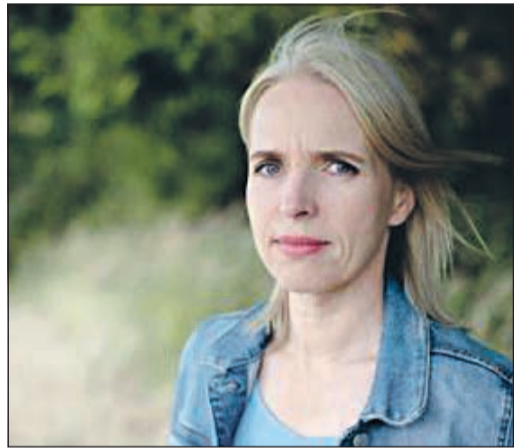
Lesung mit Annette Hess in der Stadtbücherei.

kreis GmbH in Zusammenarbeit mit dem Arbeitskreis Kindheit und Jugend im Nationalsozialismus. Zum Inhalt des Buches: Frankfurt 1963. Die 24 Jahre alte Eva Bruhns nimmt als Dolmetscherin am ersten Auschwitzprozess der Nachkriegszeit teil, über den schon im Vorfeld alle Zeitungen berichten, und der vom Generalstaatsanwalt Fritz Bauer initiiert wurde. Ihre Eltern, einfache Wirtsleute im „Deutschen Haus“, und ihr zukünftiger Verlobter sind gegen diese Anstellung. Doch Eva widersetzt sich und erfährt in diesem Prozess erschreckende Details über das Arbeits- und Vernichtungslager Auschwitz. Und sie stellt Fragen an ihren Verlobten und ihre Eltern... Annette Hess stammt aus Hannover und studierte zunächst Malerei und Innenarchitektur, später Szenisches Schreiben. Seit 1998 ist sie ausschließlich als Drehbuchautorin tätig. Bekannt wurde sie durch ihre Fernsehserien Weissensee, Ku'damm 56 und Ku'damm 59. Sie erhielt zahlreiche Auszeichnungen, darunter den Grimme-Preis, den Frankfurter Preis der Autoren sowie den Deutschen Fernsehpreis.