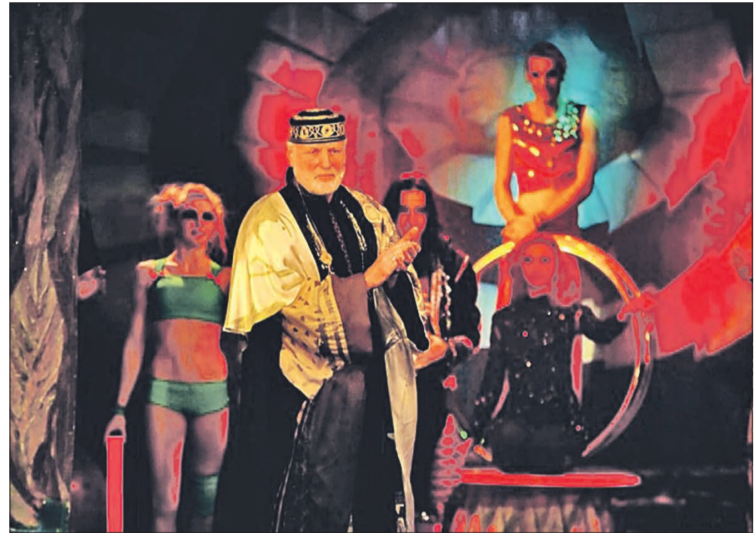
Fantasievolle Unterhaltung verspricht das Traumtheater Salome.

Eintrittskarten sind erhältlich in den Schreibwarenhandlungen Schlegel und Bobas in Eschborn sowie bei Blumen Buchholz in Niederhöchstadt für 16 Euro.