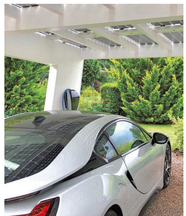
Einmal aufladen, bitte. Das Solardach des Carports gewinnt grünen Strom, um damit direkt das Elektroauto aufzuladen.

Für umweltfreundlichen Solarstrom sorgen die Kollektoren nicht nur bei strahlendem Sonnenschein. Auch an bewölkten Tagen reicht das Tageslicht zur Energieproduktion aus. Empfehlenswert ist ein Energiespeicher, um den selbst gewonnenen Ökostrom tagsüber zu sammeln und nachts dann zum Auftanken des Elektroautos zu nutzen. Dafür ist zusätzlich eine sogenannte Wallbox notwendig, an die das Fahrzeug angeschlossen wird.