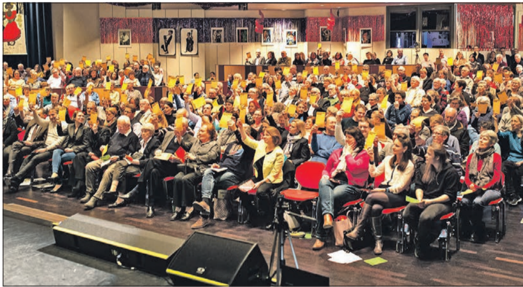
Rege Teilnahme der Bürger bei der Podiumsdiskussion.