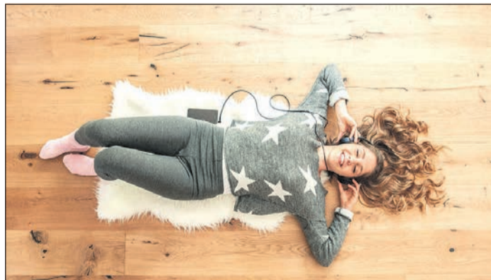
Urgemütlich und natürlich: Parkett ist ein echter Klassiker für die hochwertige Bodengestaltung. Mit der richtigen Pflege und Reinigung hat man lange Freude daran.