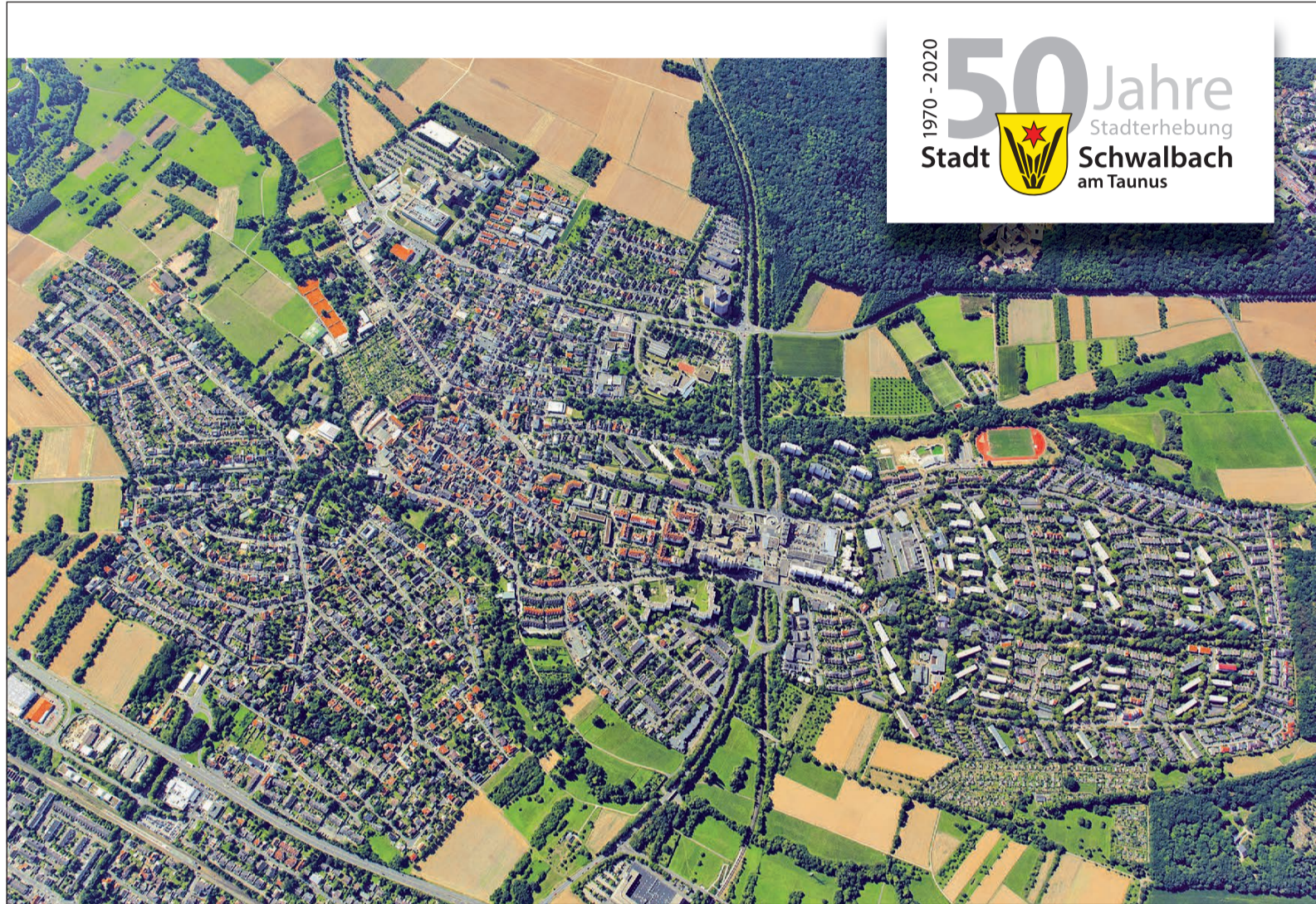
Die Luftaufnahme zeigt es: Schwalbach hat eine enorme Entwicklung genommen.