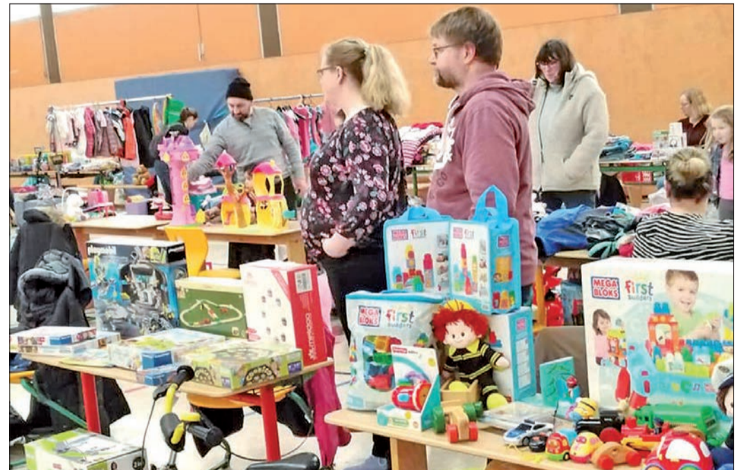
Großer Andrang beim Frühlings-Basar der Georg-Kerschensteiner-Schule.

gen; selbstverständlich erst, nachdem sie sich zuvor am reichhaltigen Kuchenbuffett bedient oder sich noch eine Tüte Popcorn gesichert hatten. „Wir freuen uns über die Einnahmen von über 400 Euro“, so der Veranstalter. Für welches Schulprojekt diese verwendet werden, ist noch nicht endgültig entschieden worden. Fest steht jedoch, dass es allen Kindern der Grundschule zugute kommen wird.