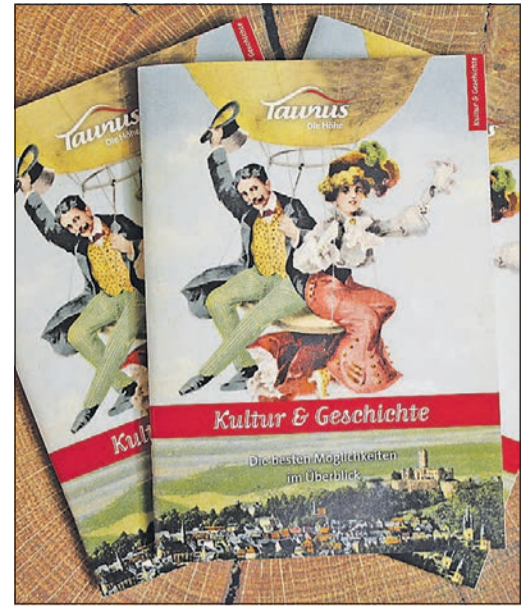
Die Broschüre „Kultur & Geschichte“ ist neu aufgelegt.

Ergänzt wurde die Broschüre um Angebote aus den neuen Mitgliedsorten des TTS aus dem Rheingau-Taunus-Kreis und um die neue Rubrik „Film & Kleinkunst“. Außerdem versprechen die sechs weiteren Rubriken „Kelten & Römer“, „Burgen & Schlösser“, „Altstädte & Fachwerk“, „Kurwesen & Sommerfrische“ sowie „Kirchen“ und „Museen“ spannende Fakten und Hintergründe. Die Broschüre im Din-A5-Format ist ein umfangreiches, touristisches Nachschlagewerk zu den kulturellen Besonderheiten und Sehenswürdigkeiten der Region. Die Lektüre ist leicht, dafür sorgt die sorgfältige Gestaltung mit vielen Details, Symbolen und kurzweiligen Texten. Aktuelle Fotos von Kulturdenkmälern und viele historische Aufnahmen erzählen unterhaltsam von vergangenen Zeiten. Das Heft zeigt zahlreiche historische Fotografien, Postkarten, Bilder und Zeichnungen, die den Leser mühelos in vergangenen Zeiten eintauchen lassen. Um dies zu ermöglichen, hat das Archiv des Hochtaunuskreises einige Originale aus der Zeit um 1900 zur Verfügung gestellt. Außer den geschichtlichen Fakten gibt es interessante Anekdoten zu lesen oder zusätzlich Tipps in zahlreichen Informationskästen. Natürlich bietet das Heft auch Hinweise für einen Besuch der historischen Ausflugsziele. Als neue Rubrik wurde das Thema „Film & Kleinkunst“ in die Broschüre aufgenommen. Hier haben be-