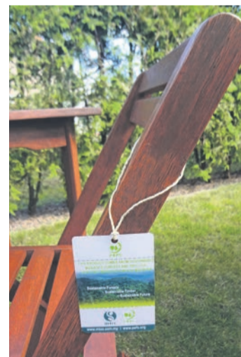
Bei Produkten aus Tropenholz, die das PEFC-Siegel tragen, können Verbraucher sicher sein, dass das Tropenholz aus einer nachhaltigen Waldbewirtschaftung stammt.