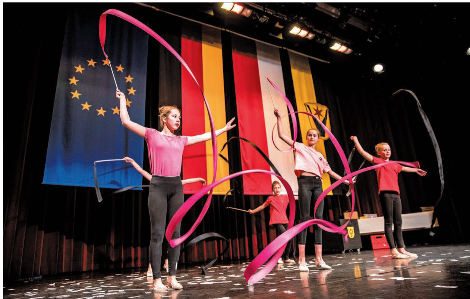
Die Gymnastikmädchen der TG Schwalbach zeigen bei der Sportlerehrung ihr Können auf der Bühne.