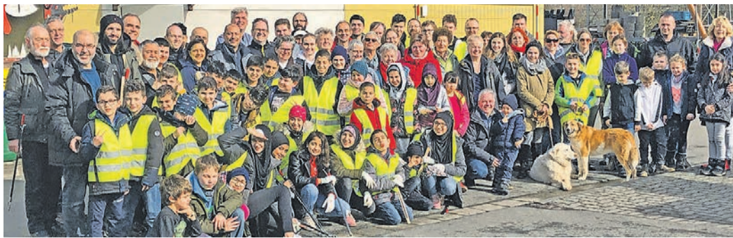
Gruppenfoto mit allen fleißigen Helfern.