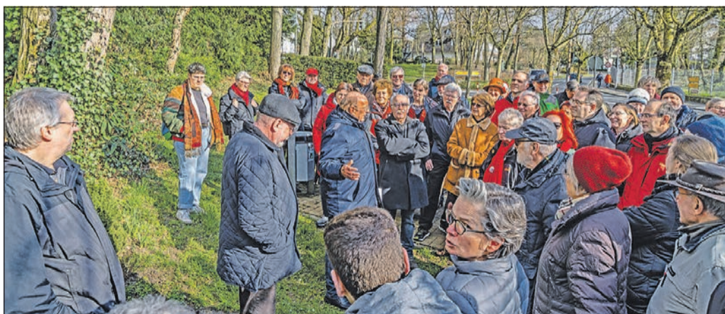
Viele Bürger nehmen am historischen Spaziergang teil.

der „Schwalbacher Dom“ genannt wurde. Zum Ende des Spazierganges trafen sich alle am Feuerwehrhaus. Auch hier lebte die Geschichte der Feuerwehr wieder auf, auch bildlich dargestellt an dem alten Feuerwehrauto aus dem Jahr 1949, das liebevoll „Lottchen“ genannt wird. Bei Kaffee und Gebäck endete dieser interessante Nachmittag mit weiteren vielen Gesprächen rund um das Thema „Historisches Schwalbach“. Alexander Immisch dankte Helmut Scherer und Winfried Henninger für deren fachkundige und unterhaltsame Führung. Er versprach, dass er und die SPD Schwalbach weitere „Spaziergänge“ dieser Art planen. „Ich freue mich, dass so viele zu diesem Rundgang gekommen sind und damit auch einen besonderen historischen Blick auf Schwalbach bekommen haben. Es hat uns allen viel Spaß gemacht. Ich freue mich jetzt schon auf die Fortsetzung dieser Aktion“, fasste Alexander Immisch zusammen.