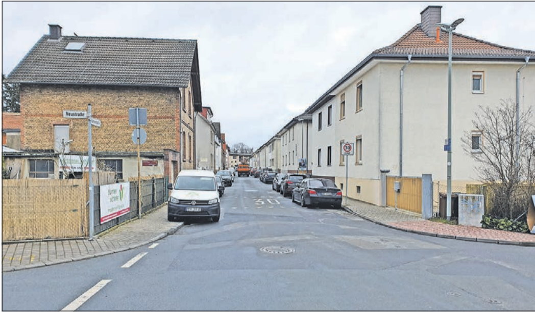
Der Blick vom Flachsacker in die Gartenstraße, die Gärtnerei Scherer auf der linken Seite.

eingengt, sodass man mit Kinderwagen, Rollator oder Rollstuhl dort nicht vorbei kann. Durch einen verschränkten Straßenverlauf könnten vor der Gärtnerei Scherer ordentliche Parkplätze entstehen und gleichzeitig die Situation für Fußgänger und Anwohner erheblich verbessert werden. Die GRÜNEN haben kein Verständnis dafür, dass eine Beteiligung der Bürger hier von Anfang an ausgeschlossen werden soll. Nordmeyer: „Wenn ein gutes Konzept vorliegt, braucht die SPD das Gespräch mit den Menschen nicht zu fürchten.“ Die abschließende Abstimmung im Parlament steht noch aus, die GRÜNEN hoffen auf ein Einlenken der Koalition.