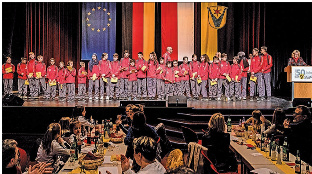
Die erfolgreiche Taekwondo-Gruppe der TG Schwalbach steht bei der Sportlerehrung stolz auf der Bühne.