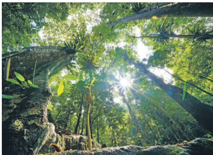
Nach Ansicht von Experten sollte man Holz aus Tropenwäldern nicht per se boykottieren – denn dann können die Menschen vor Ort nicht mehr von der Waldwirtschaft leben. Genau hinschauen sollte man bei Tropenholz allerdings schon.

(djd). Tropenhölzer sind besonders resistent gegen Witterung, Feuchtigkeit und Pilze und daher oft langlebiger als heimische Holzarten. Sie benötigen keine thermische oder chemische Behandlung und sind deshalb vor allem für den Einsatz im Außenbereich geeignet – etwa für Terrassendielen, Gartenmöbel, Poolumrandungen, Fassaden, Parkettböden und Fenster. Gegen Tropenhölzer sprechen die langen Transportwege. „Daher sollten keine Wegwerfprodukte wie etwa Dekoartikel aus Tropenholz gekauft werden, sondern nur werthaltige Produkte mit einer langen Nutzungs- und Lebens-