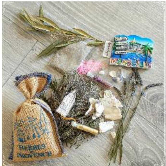
Foto unten: das ist nicht Frankreich, das ist Birstein :-)