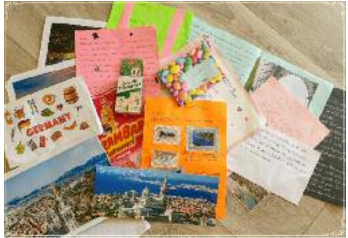
Auf den Fotos: Tolle Überraschung für den A-Kurs Französisch im Jahrgang 8. Die jungen Französinnen und Franzosen gaben sich große Mühe, den deutschen Brieffreunden ihre Heimat zu präsentieren.