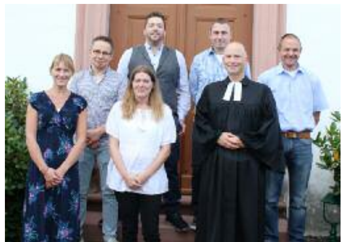
Oben: Die „Silbernen Konfirmanden“ 2020