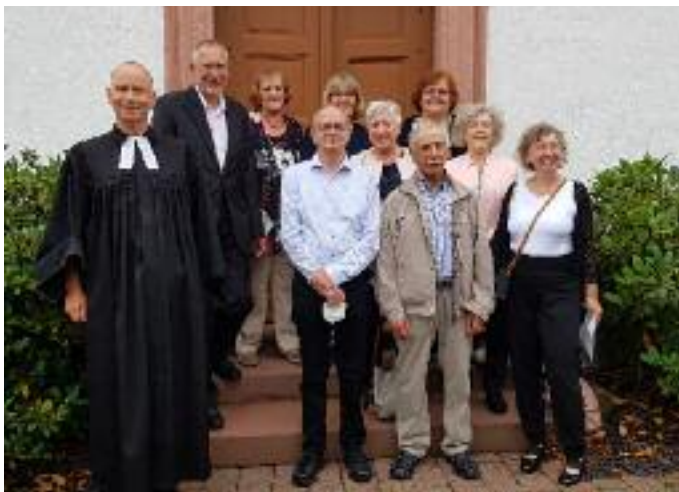
Oben: Die „Goldenen Konfirmanden“ 2020