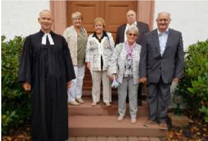
Oben: Die „Eisernen Konfirmanden“ 2020 und 2021