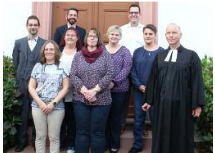
Oben: Die „Silbernen Konfirmanden“ 2021