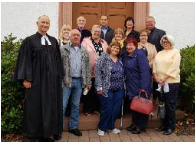
Oben: Die „Goldenen Konfirmanden“ 2021