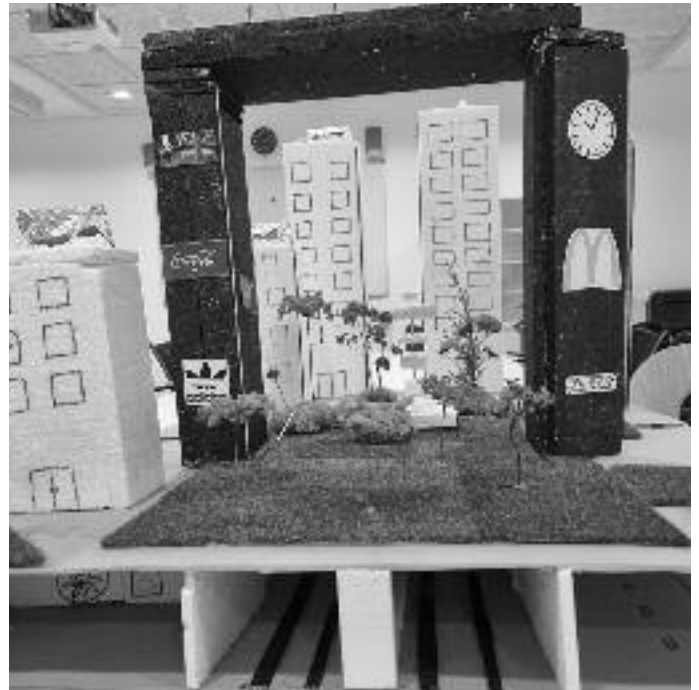
Auf den Fotos: Ein Städtebau-Modell mit unterirdischer Verkehrslenkung und grünem Wohnen sowie ein selbstgebautes Fußballstadion

und werden so Stück für Stück an Präsentationsprüfungen oder jegliche Art von Präsentationen, sei es für die Ausbildung oder das Abitur, herangeführt und müssen sich beweisen.“, so Schmidt-Willenborg weiter. Bewertet werden drei Phasen der Gruppenprüfung: Die Vorbereitungsphase, die 16-stündige Durchführungsphase und die Präsentation. Tolle Ergebnisse seien entstanden, sind sich die betreuenden Lehrkräfte einig. So zum Beispiel sei in einer Gruppe ein Parfum entwickelt worden, das im Anschluss fiktiv nach betriebswirtschaftlichen vermarktet wurde. Ein weiteres Projekt beinhaltete die Bedeutung von Fußballstadien für den Fußball. Hier wurde ein Fußballstadion nachgebaut, um die Atmosphäre darzustellen. Eine andere Gruppe beschäftigte sich mit dem Städtebau der Zukunft und entwarf ein Modell, wie Verkehr und Wohnen miteinander nachhaltig in Einklang gebracht werden könnten. Im Januar stehen für den Jahrgang 10 die Präsentationsprüfungen an, die das Ergebnis einer Hausarbeit nach wissenschaftlichen Kriterien darstellt. Hier hoffen die Lehrkräfte der Henry-Harnischfeger-Schule, dass ihre Prüflinge aus den Erfahrungen der Projektprüfungen profitieren.