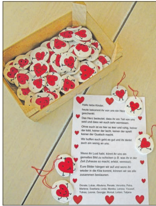
Mit kreativen Ideen halten die Verantwortlichen in den Eschborner Kinderbetreuungseinrichtungen den Kontakt zu ihrer „Rasselbande“.

der zuhause eingeworfen. Zudem ist da der Gartenzaun einer Kita, der mit bunten Bändern geschmückt wurde, als Zeichen des aneinander Denkens. „Viele weitere Ideen sind noch in der Pipeline, um die Zeit ein bisschen zu verschönern und sich nicht zu vergessen“, verspricht Strobel. Wer erfahren möchte, ob die Kita des eigenen Kindes eine besondere Aktion am Start hat, kann sich telefonisch oder per E-Mail bei „seiner“ Einrichtung erkundigen.