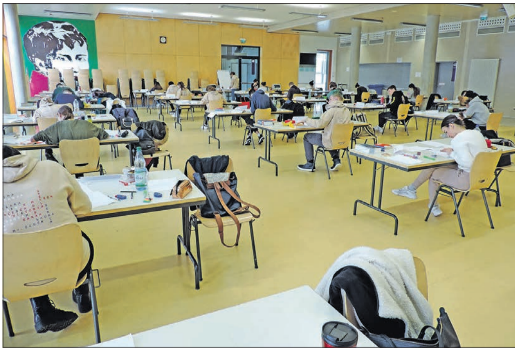
Bei ihren schriftlichen Prüfungen müssen die Abiturienten den derzeit notwendigen Sicherheitsabstand einhalten.