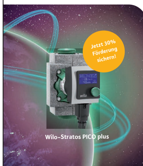
Wilo-Stratos PICO plus

Wilo gratuliert der Firma Hildmann zum 60-jährigen Jubiläum