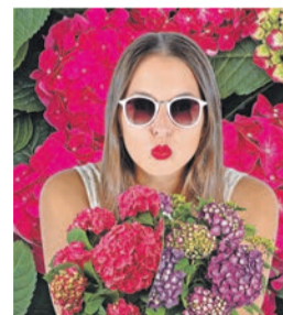
Kräftige Farbtöne prägen die Hortensien-Highlights.

Neben den Farbklassikern Blau, Rosa und Weiß gibt es für die Gartensaison 2020 eine neue Summer Love: So heißt die Züchtung, die in einem verführerischen Himbeerrot oder in Neonlila daherkommt - abhängig vom jeweiligen Standort. Je nach pH-Wert des Bodens verändert diese Hortensie ihre Farbe. Ebenso wie ihre Geschwister blüht sie den ganzen Sommer, wächst aber etwas kompakter und ist daher für den Kübel besonders geeignet.