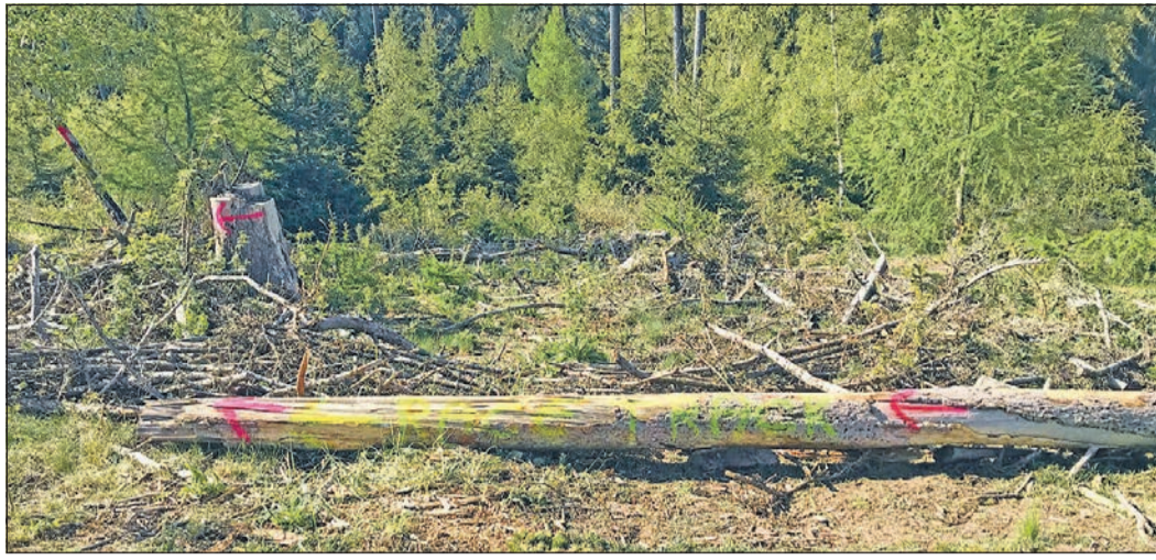
Pfeile und der Schriftzug „Race Track“ markieren die Einfahrt in die illegal gebaute Mountainbike-Strecke.