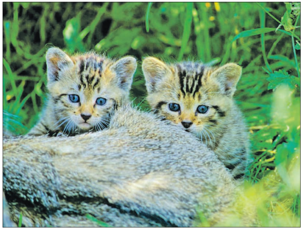
Junge Wildkatzen sehen Hauskatzen oftmals zum Verwechseln ähnlich. Auch wenn die Tiere allein und mutterlos erscheinen, sollte man Abstand halten.