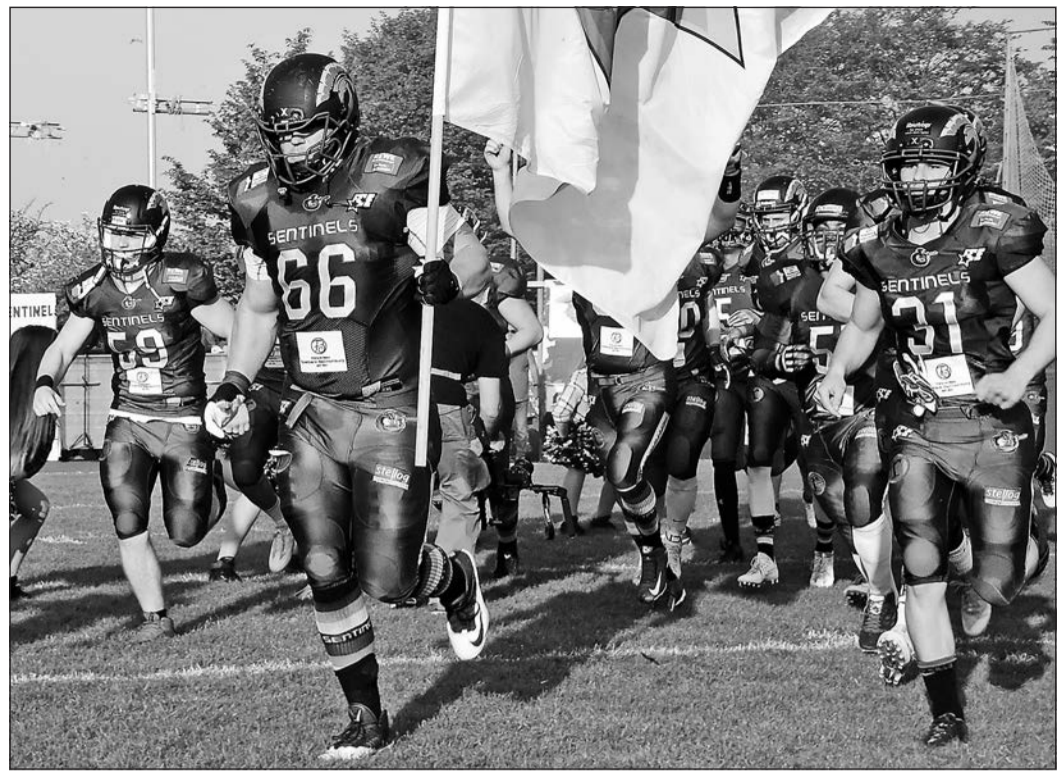
Der Saisonstart am Samstag gegen Gießen fiel aus, aber es besteht weiterhin die Chance, dass die Bad Homburg Sentinels 2020 in der Football-Regionalliga um Punkte spielen.