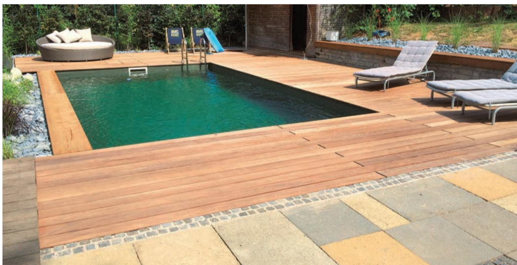
Nach der Sanierung wird der Biopool zum neuen Highlight im Garten – mit natürlich reinem Wasser, ganz ohne Chlor und Chemie.

(djd). Einfach abtauchen und entspannen: Ein privates Schwimmbecken ist für viele das Highlight des Gartens. Zu schade, wenn nach dem Badespaß nur rote Augen und trockene Haut übrig bleiben. Grund dafür können Chemikalien sein, die im klassischen Chlorpool für die Wasseraufbereitung notwendig sind. Bei Neuanlagen verzichten immer mehr Gartenbesitzer heutzutage auf die chemische Keule und entscheiden sich für einen biologisch gefilterten Pool. Was viele allerdings nicht wissen: Auch ältere, konventionelle Pools lassen sich häufig von chemisch auf biolo-