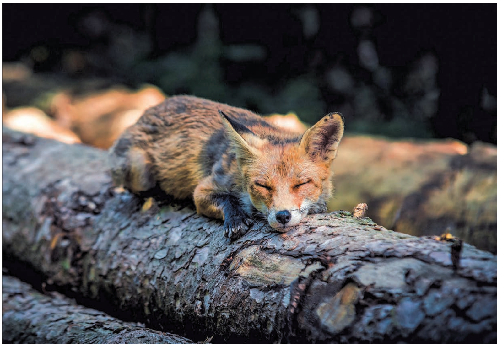
Das Foto der schlafenden Füchsin auf einem Baustamm stammt von Thomas Röder.