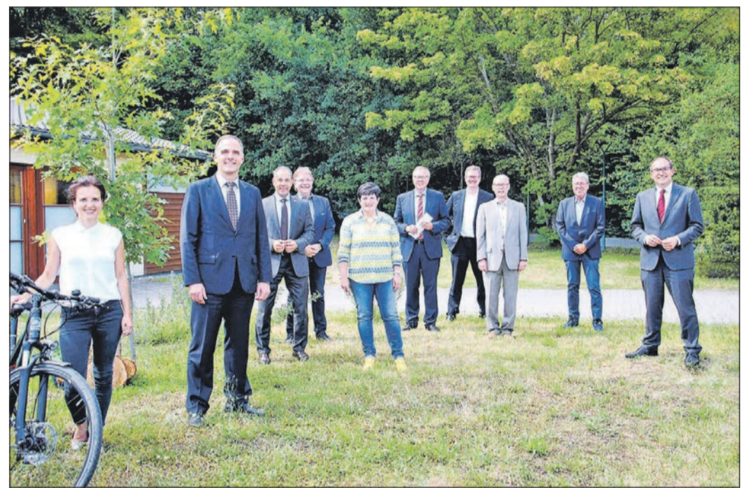
Die Verantwortlichen der genannten Kommunen sowie des Main-Taunus-Kreises und des Regionalverbandes FrankfurtRheinMain.

Die Studie soll im Herbst dieses Jahres starten und voraussichtlich im Frühjahr 2022 vorliegen. Es wird davon ausgegangen, dass die Kosten der Machbarkeitsstudie bei etwa 80 000 Euro liegen. Eine Förderung durch das Land Hessen wurde bereits beantragt. In der Regel liegt die Förderquote bei 50 Prozent der Kosten. Der Main-Taunus-Kreis wird sich mit