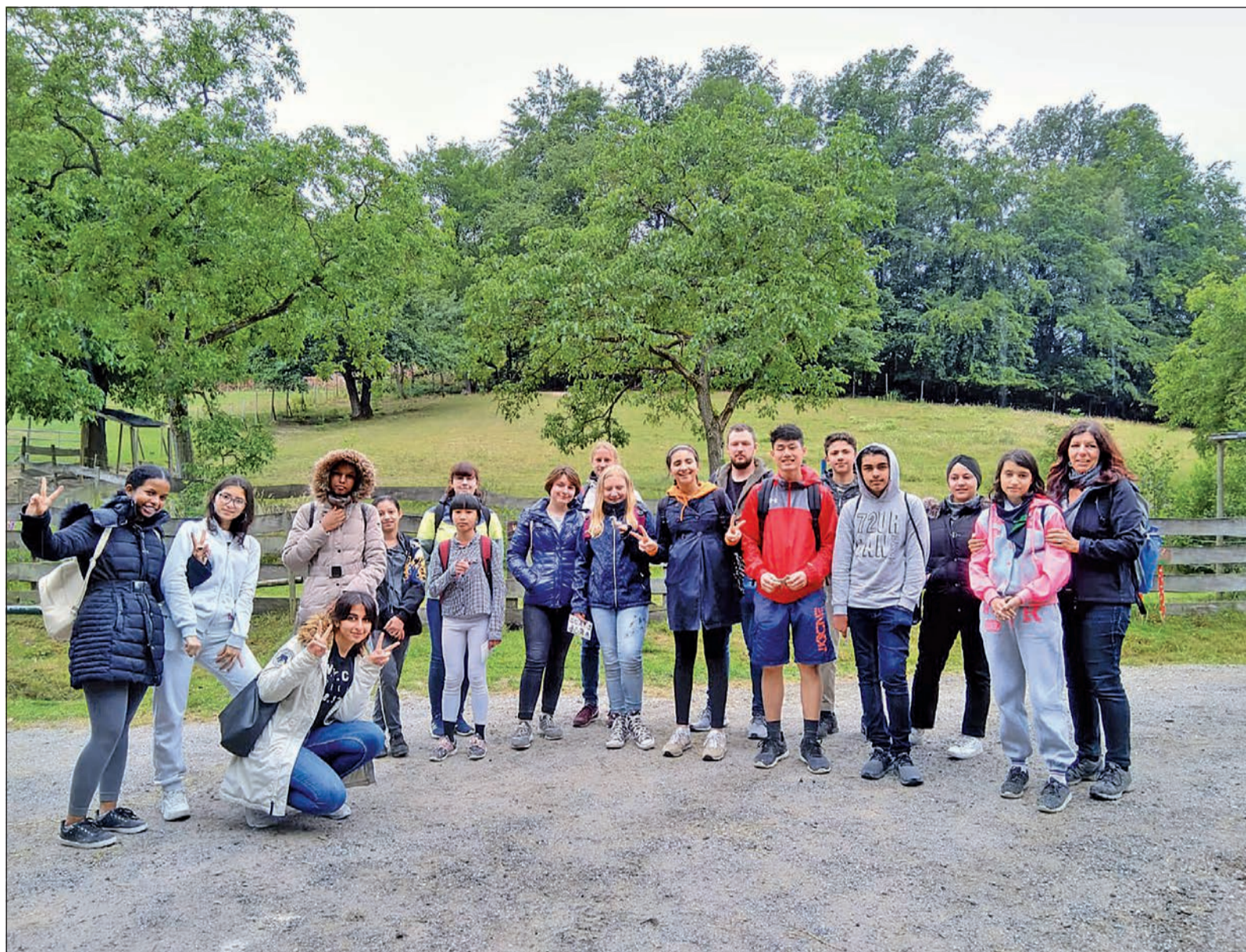
Mit einem bunten Aktivprogramm beginnen die Schulferien für einige Jugendliche.