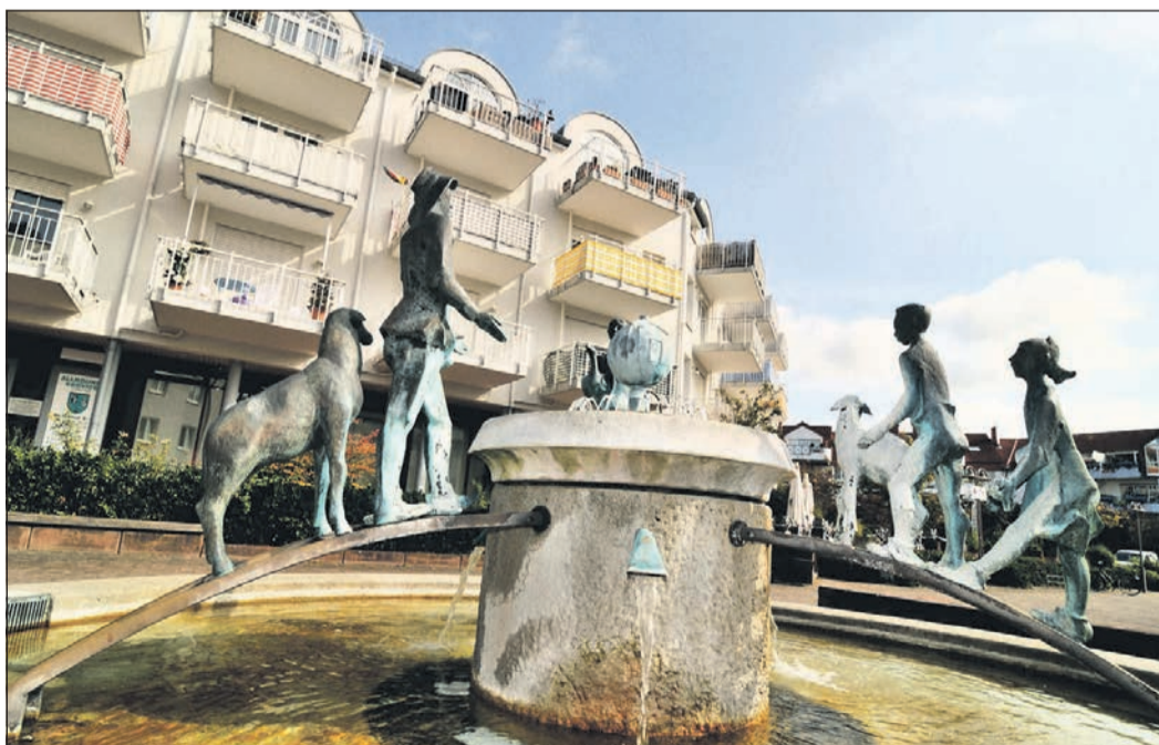
Ein Bild aus der Gemeinde Liederbach, die unter den Kommunen den größten Zuwachs verzeichnete.

über die aktuellen Regeln zur Wasserentnahme zu informieren. Zum Schutz des Ökosystems Fließgewässer sollte auf Wasserentnahmen aus Bächen verzichtet werden, wenn Niedrigwasser herrscht. Die Möglichkeit, Regenwasser zur Bewässerung von Gartenflächen zu verwenden, sollte genutzt werden. Die Besitzer eines Wasserentnahmerechts müssen die für sie geltenden Bestimmungen bei Niedrigwasser einhalten und gegebenenfalls die Wasserentnahme einstellen. Informationen zum langjährigen Witterungsgeschehen (Witterungsberichte) sowie zu Wasserständen und Niederschlägen (Abflusswerte) gibt es auf den Seiten des Hessischen Landesamts für Naturschutz, Umwelt und Geologie ( hlnug.de ).