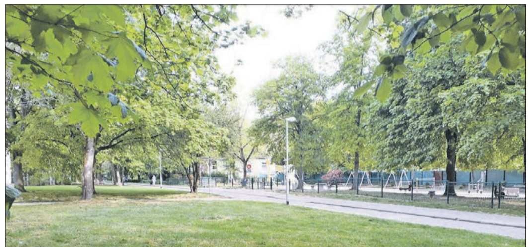
Calisthenics Standort Mittelweg – Blickrichtung stadtauswärts – Spielplatz Württemberger Straße.

Die umliegenden Haushalte erhielten in den vergangenen Tagen ein Schreiben mit weiteren Informationen, und für interessierte Bürger steht Jugendbildungsreferent Achim Lürtzener unter Telefon 06196-804151 oder per E-Mail unter achim.luertzener@schwalbach.de gerne als Ansprechpartner zur Verfügung.