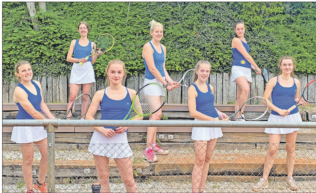
Stellvertretend für die vielen aktiven und erfolgreichen Sportler des TCBW stellten sich die am Fototermin anwesenden Mitglieder der Teams „Damen I und II“ der Kamera.

Die zweite Hälfte der Punktspielsaison startet nach den Sommerferien am 15. August. Die Ferien selbst gehören den Sommercamps – und einem Turnier: In der vierten Woche der Sommerferien (27. Juli bis 2. August) findet auf der TCBW-Anlage der Ibero-Sommercup statt, ein Turnier für alle Altersklassen und Spielstärken. Gespielt wird im Spiralsystem mit zwei garantierten Spielen. Anmeldeschluss ist der 19. Juli.