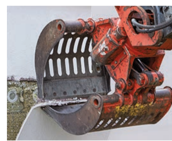
Nach dem Rückbau lassen sich alle Systemkomponenten sortenrein voneinander trennen.

Als Anreiz für die energetische Optimierung des Gebäudebestands gewähren einige Kommunen Bauherren zusätzlich zum KfW-Kredit Fördergelder für die Verwendung umweltschonender Systeme. Eines der ersten mit weber.therm circle realisierten Bauvorhaben, ein Mehrfamilienhaus in Münster, wurde beispielsweise dank 20 Zentimeter Dämmung bei 0,040 W/m 2 K mit 20 Euro pro Quadratmeter Fassadenfläche gefördert. „Baumaterialien im Gebäudebestand sind angesichts immer knapper werdender Ressourcen die Roh-