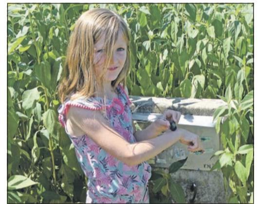
Einmal stempeln bitte im großen Irrgarten.

Zum gemeinsamen Spielen bieten sich auch das Volleyballfeld sowie die Fußballtore an. Bricht nach einem langen Ferientag am Fuße des großen Feldbergs langsam die Dämmerung herein, lässt sich an den Grillplätzen und am Lagerfeuer ein perfekter Ausklang arrangieren. Ihren Gästen bieten die Kellers mehrere Grills in verschiedenen Größen zum Verleih. Damit, wie während des gesamten Besuchs auf dem Hof Köppelwiese, keine Wünsche offenbleiben.