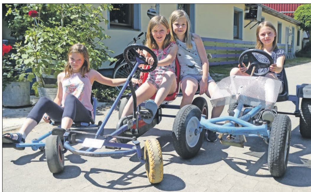
Alle startklar? Mit dem Kettcar lässt sich ein spannendes Wettrennen veranstalten – oder mit einer gemütlichen Tour das Gelände des Freizeitbauernhofes erkunden.