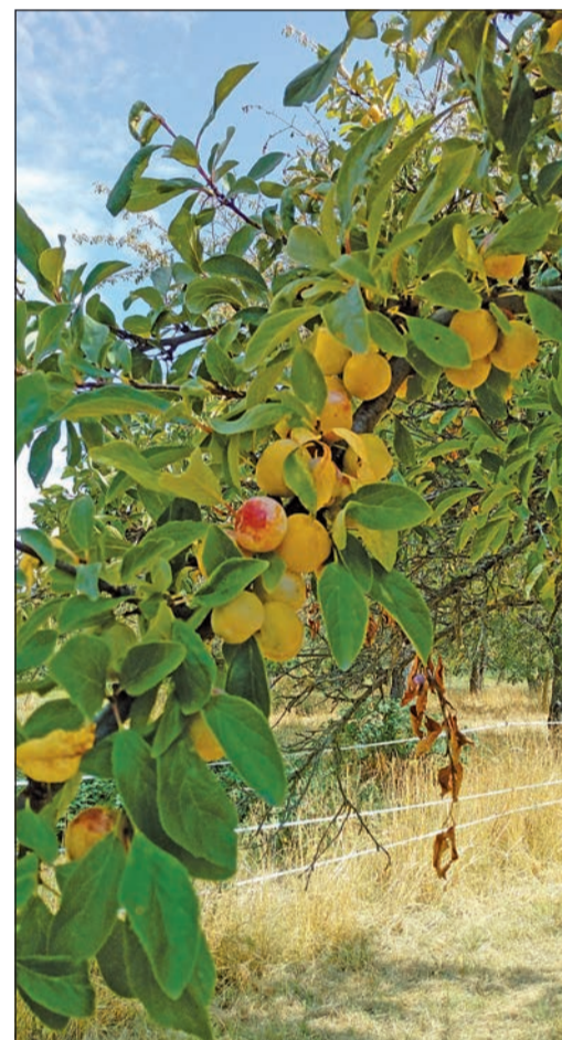
Die Mirabellen im Obstgarten Vordertaunus sind reif. „Das Gold des Vordertaunus“ kann geerntet werden.

Anmelden zur Führung am 8. August können sich alle Interessierten bei Reinhard Birkert per Mail an r.birkert@web.de, Treffpunkt ist an der Westerbachhalle.