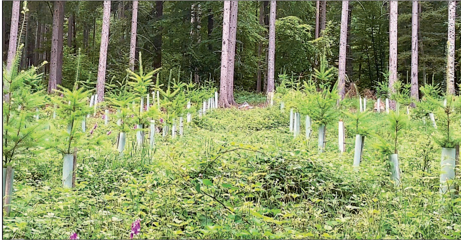
Das Wiederaufforsten von Waldflächen, hier mit Douglasie, ist in Zeiten schlimmer Waldschäden besonders wichtig.