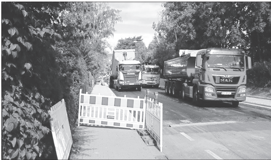
Die Asphaltdeckschicht ist seit vergangener Woche in der Eschborner Straße eingebaut, sodass die Straßenbauarbeiten nun komplett abgeschlossen sind und die Straße seit Dienstag wieder nutzbar ist.