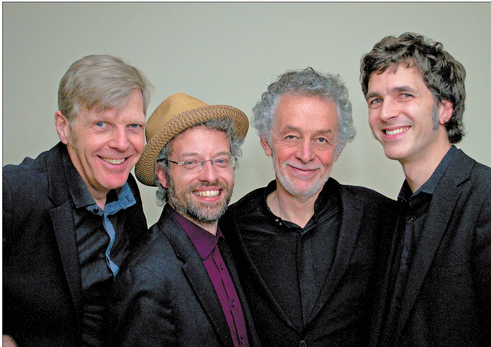
Ein anspruchsvolles Jazzkonzert gibt es für Musikbegeisterte mit den „New Orleans Shakers“ auch im Oktober.