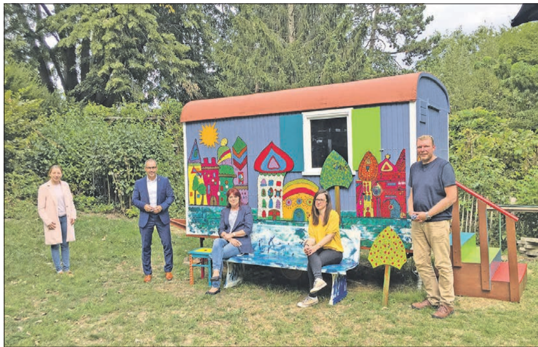
Der neue Bauwagen der Villa Luce.