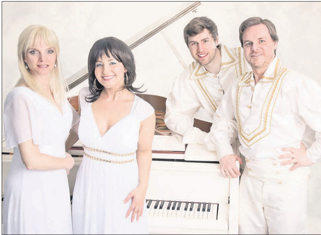
Die Künstler von PW Entertainment bieten die Show „Dancing Queen – eine Hommage an ABBA“.