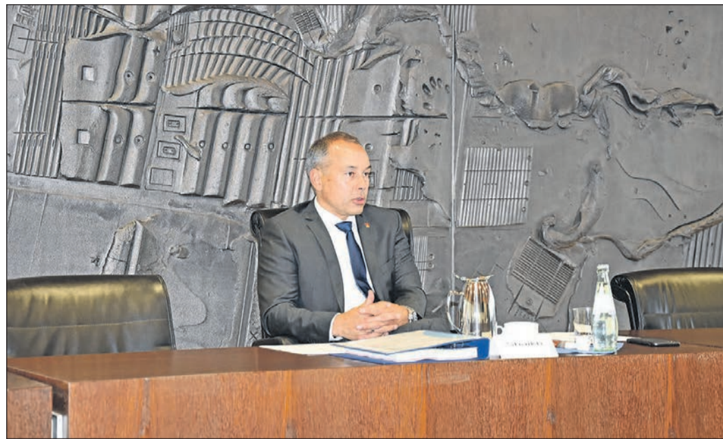
Bürgermeister Adnan Shaikh während der Pressekonferenz.

Die Gewerbesteuererträge würden im kommenden Jahr auf 180,0 Millionen Euro (2020: 170,0 Millionen Euro) angesetzt. Die zweitgrößte Einnahmequelle sei der Gemeindeanteil mit der Einkommensteuer von 16,9 Millionen Euro (2020: 18 Millionen Euro). Der Gemeindeanteil an der Umsatzsteuer erhöhe sich aufgrund von Sondereffekten auf 12,2 Millionen Euro (2020: 9,5 Millionen Euro) und der Ansatz für die Erträge aus der Grundsteuer B bleibe konstant mit 2,8 Millionen Euro (2020: 2,77 Millionen Euro). Somit beliefen sich die Einnahmen aus Steuern und aus steuerähnlichen Erträgen auf insgesamt 212,4 Millionen Euro (2020: 200,9 Millionen Euro). Gemessen an den gesamten Einnahmen seien dies über 90 Prozent. Die Umlageverpflichtungen an den Kreis belaufen sich auf insgesamt 78,6 Millionen Euro (2020: