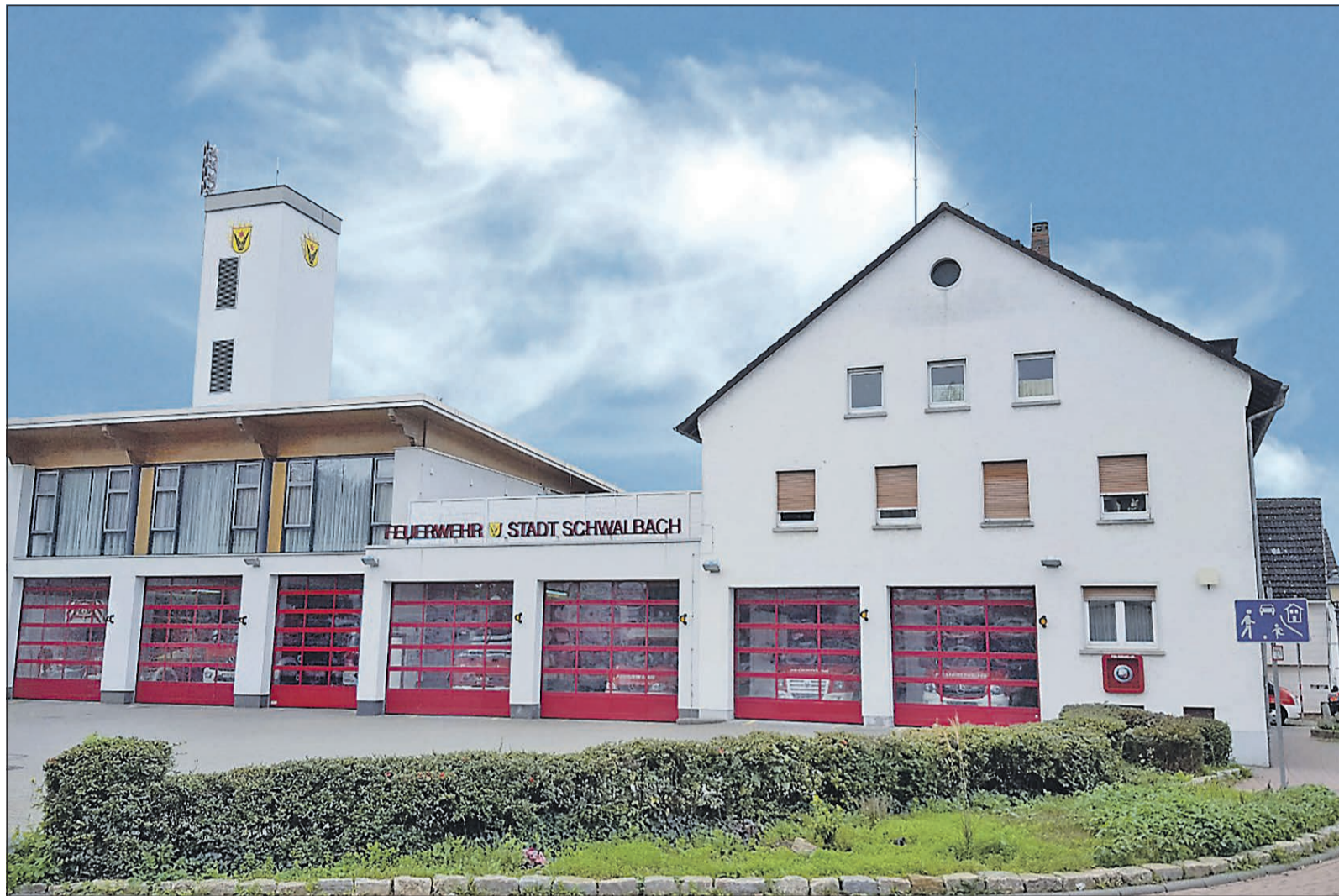
Die Feuerwehrwache in Schwalbach.