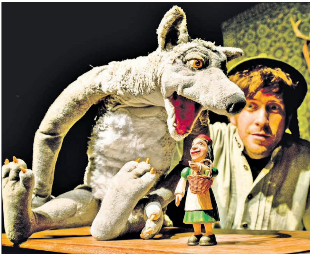
Das Theater Zitadelle spielt „Das Rotkäppchen“.