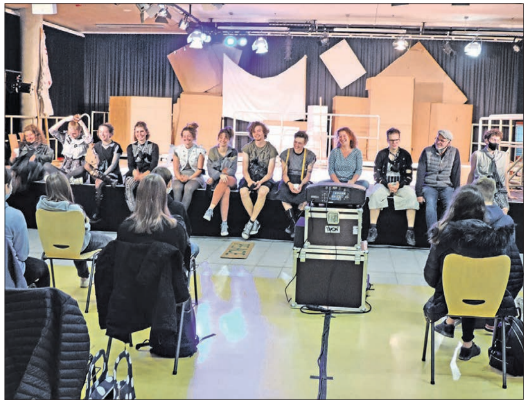
Das Theaterensemble „Marabu“ aus Bonn zu Gast an der HvK.