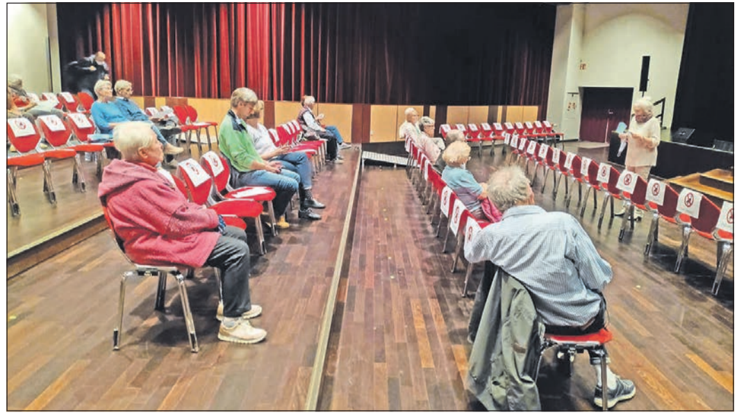
Der Film „Intrige“ kommt beim Publikum gut an.

Weitere Informationen und Anmeldung: Jugendbildungswerk Schwalbach, Achim Lürtzener unter Telefon 06196-804151 oder per Mail an jugendbildungswerk@schwalbach.de. Mitglieder im Arbeitskreis „Kindheit und Jugend im Nationalsozialismus“ sind: Sozial- und Jugendamt der Stadt Schwalbach mit Jugendbildungswerk und Stadtbücherei, Stadtarchiv, Kulturkreis Schwalbach, Gesellschaft für Christlich-Jüdische Zusammenarbeit im Main-Taunus-Kreis, Albert-Einstein-Schule, Friedrich-Ebert-Schule, evangelische und katholische Kirchengemeinden.