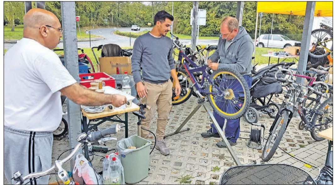
Ein reger Andrang herrscht am Fahrradreparatur-Tag.