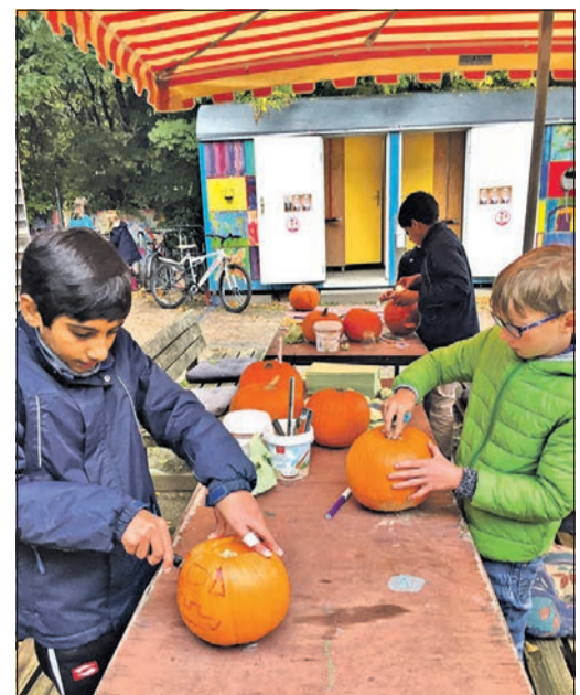
Kürbis schnitzen auf dem Abenteuerspielplatz.

Außerdem stand dieser Tag auch unter dem Motto Fairtrade. Zu der Frage: „Was ist für dich fairer Handel?“, konnten die Teilnehmenden mit Sprüchreide ihren Ideen auf dem Rathausplatz Ausdruck verleihen. Für alle, die sich bei den Aktionen verausgabt hatten, gab es fair gehandelte Schokoriegel zur Stärkung. In der zweiten Ferienwoche gab es Aus-