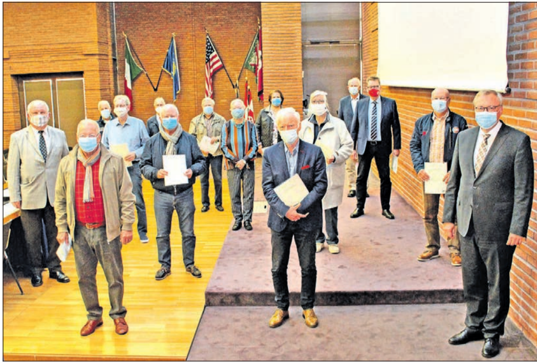
Die Verkehrswacht kann 21 Personen für langjähriges, unfallfreies Fahren ehren. Darunter auch vier Bürger aus Bad Soden und ein Bürger aus Sulzbach.