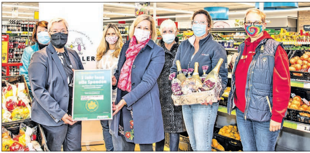
Übergabe der Urkunde und eines Präsentkorbs für den Gewinn des „Förderpennys“ für ein Jahr in der Schwalbacher Filiale.