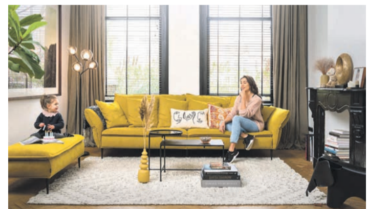
Ein ockerfarbenes Samtsofa bringt Charakter ins Wohnzimmer.

mit samtene Kleinmöbeln. Der COCO maison-Hocker Sissy beispielsweise strahlt in einem frischen Rosa. Der goldfarbene Rand rundet das Bild ab.