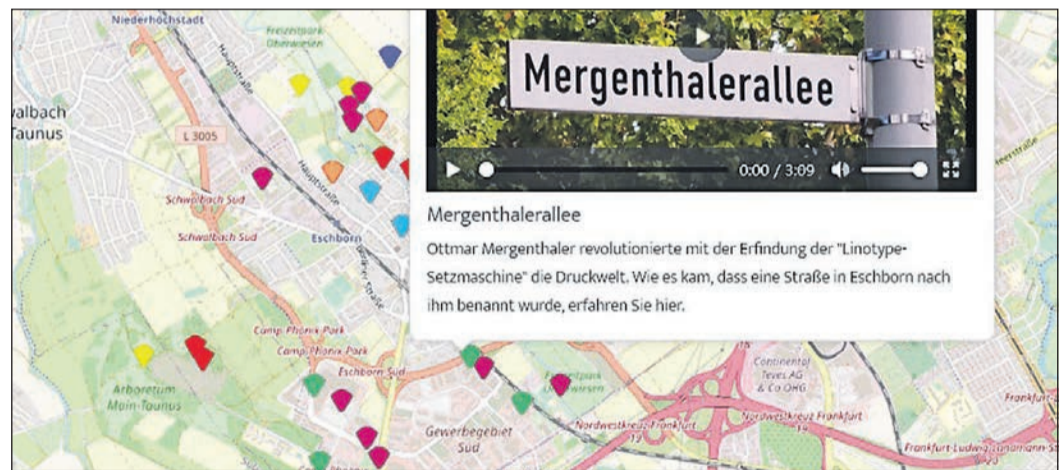
Es finden sich Erklärungen, warum Straßen so benannt wurden.