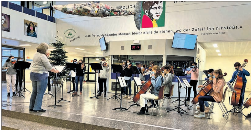
An der HvK verbreiten die Musiklehrerinnen mit den Streichern aus dem Sinfonieorchester adventliche Stimmung in der Schule.