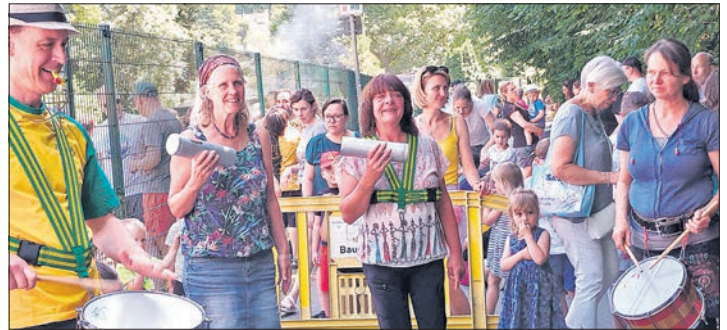
Die Samba-Gruppe der Musikschule heizte trotz der Temperaturen die Stimmung im Ziel an.

Auch die Eppsteiner Zeitung schickte wieder eine Ente an den