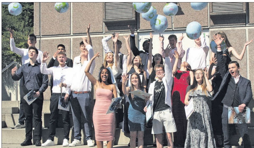
Die R10b feiert auf dem Schulhof jubelnd ihren Schulabschluss. Die Wasserbälle waren ein Geschenk ihrer Lehrerinnen.