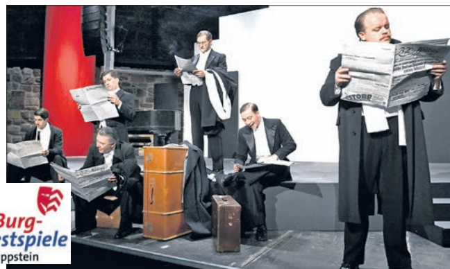
Die Bad Vilbeler Burgfestspiele gastieren mit der Revue „Die Comedian Harmonists“ auf Burg Eppstein.

sind die Burgfestspiele Bad Vilbel. Einlass ist ab 18.30 Uhr, Beginn um 19.30 Uhr. Karten gibt es online unter www.frankfurtticket.de oder telefonisch unter (0 69) 134 04 00. Wer sich spontan entscheidet, kann ab 18.30 Uhr Ti-