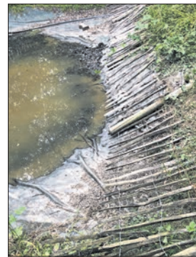
Der Zaun am Feuchtbiotop wurde mutwillig zerstört.

Am Montag vergangener Woche bemerkten Mitglieder des NABU Eppstein, dass am Feuchtbiotop „Untere Beune“ im Seyenbachtal bei Bremthal die Zaunbegrenzungen des Teichs mutwillig eingerissen worden sind. Diese Randalierer zerstörte das Ergebnis eines mehrtägigen ehrenamtlichen Einsatzes für Natur- und Artenschutz. Die Umgrenzung sollte verhindern, dass kleine Kinder in den Teich fallen und der Froschlaich im Teich durch freilaufende Hunde zerstört wird. Es ist nicht das erste Mal, dass sich diese sinnlose Zerstörung an diesem abgelegenen Ort zeigt. Eventuelle Zeugen werden gebeten, sich telefonisch bei Peter Lange, 32493, zu melden.