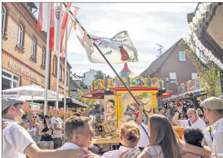
Fahenschwingend feierten die Bremthaler Kerbeburschen und -mädchen auf dem Dorfplatz ihre Kerb.

Der Sonntagsumzug durch den Ort war mit nicht einmal zehn Fahrzeugen und Gruppen etwas kleiner als früher – Nur die Altkerbeborsch, der Gesangverein Liederkranz, die