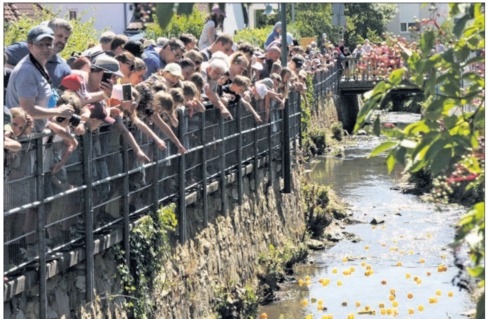
Gespannt warteten vor allem die Kinder unter den Zuschauern auf die ersten Enten.

Samstag, 30. Juli: Die Kerb in Vockenhausen beginnt um 20 Uhr mit Live-Musik im Festzelt. Bis Montag, 1. August, wird auf dem Rathausplatz gefeiert. Das Kikeriki Theater zeigt Siegfrieds Nibelungenentzündung – ein Puppen- und Menschspiel – auf der Burg, Beginn 19.30 Uhr.