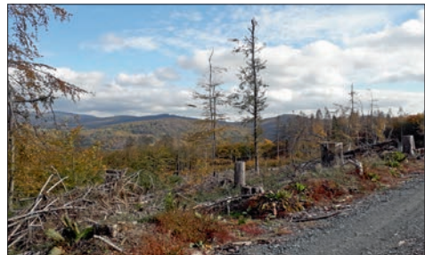
Blick über das Waldgebiet zwischen Oberjosbach und Ehlhalten, die Mark.

Wer dabei sein möchte, meldet sich im Gemeindebüro der Talkirchengemeinde, Telefon 8533 oder per E-mail gemeinde@talkirche.de .