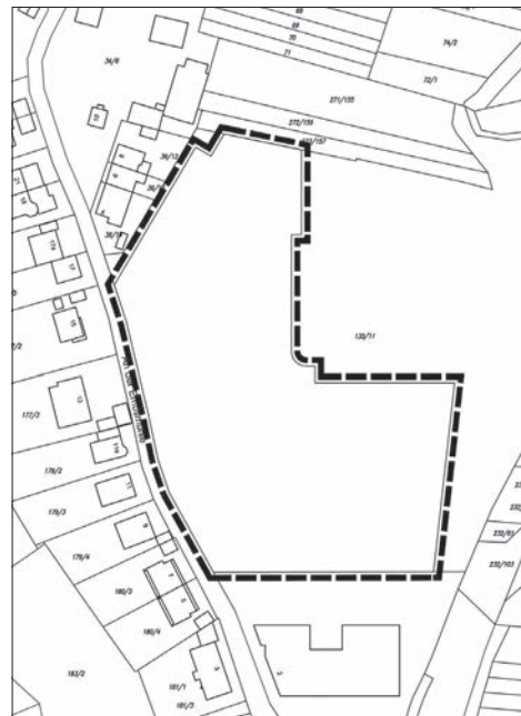
Lage des räumlichen Geltungsbereichs des Bebauungsplans V 104 „Hallgarten“ (unmaßstäblich) Plan: Stadt Eppstein

– Berechnung des „maßgeblichen Außenlärm-