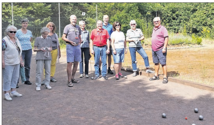
Der Boule-Platz des TSV liegt idyllisch in der Natur.

Jeden Mittwoch zwischen 15 und 17 Uhr treffen sich die Boule-Fans des TSV Vockenhausen auf der vereinseigenen Anlage. Grundsätzlich steht die Anlage Vereinsmitgliedern jederzeit zur Verfügung. Leihkugeln sind auch