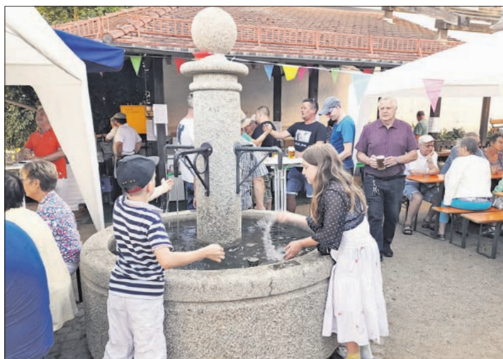
Am plätschernden Dorfbrunnen hatten nicht nur die Kinder ihren Spaß.

Vor zehn Jahren, zur 90-Jahr-Feier, war die katholische Kirche so voll, dass man noch Stühle und Bänke organisieren musste, erinnerte sich Naschold. Dieses Jahr wurde das Konzert schon mehrfach verschoben. Der Vorstand sei unsicher, ob das Konzert stattfinden könne. Dennoch kündigte Naschold einen Auftritt mit dem Don Kosaken-Chor für Sonntag, 9. Oktober, in der St. Michael-Kirche an. Auf der Homepage https://gvtauslusliebe.de gibt es weitere Infos über den Chor. ccl