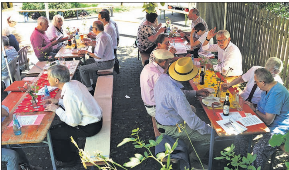
Gemütlicher Plausch beim gemeinsamen Mittagessen nach dem Gottesdienst zum Sommerfest in Ehlhalten.

Das erste Sommerfest seit der Corona be-