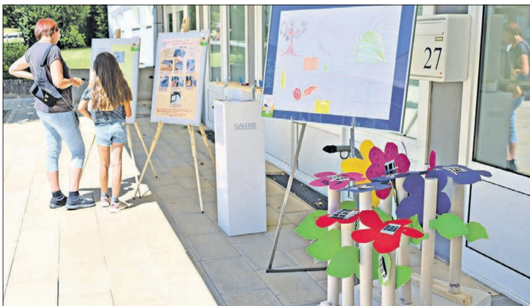
Insgesamt 13 kreative Werke von Kindern und Jugendlichen zum Thema Solarenergie sind in Läden und Gastronomiebetrieben des Einkaufszentrums Limes zu sehen.

Die Projektidee zu „Following the Sun“, eine Kooperation von Wirtschaftsförderung, Jugendbildungswerk und Öffentlichkeitsarbeit der Stadt Schwalbach, wurde beim Landeswettbewerb „Ab in die Mitte! Die Innenstadt-offensive Hessen“ gemeinsam mit 17 weiteren hessischen Städten und Gemeinden als Sieger ausgezeichnet.