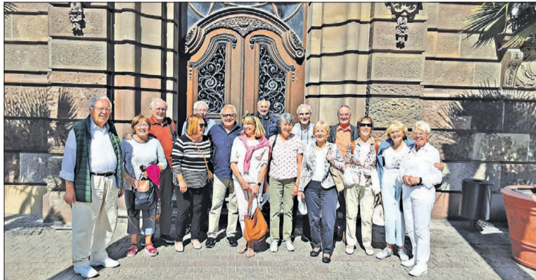
Die „Rückhandcrossies“ des Tennis Westerbach Eschborn auf Tour.

Gutmann erwarteten die 15 Teilnehmer spannende Informationen sowohl im Wormser Dom als auch in der nahegelegenen Lutherkirche. Weiter ging die Fahrt zum „Heiligen Sand“, dem ältesten Judenfriedhof Europas. Dort befinden sich die Grabstätten von etwa 2500 Juden aus neun Jahrhunderten aus aller Welt – für alle sehr beeindruckend. Nach diesem Rundgang brachte der Bus alle nach Speyer in ein Hotel, wo man sich bei Gaumenfreuden und einem kühlen Trunk erholen konnten. Am nächsten Tag ging es nach Schwetzingen. Ein Besuch des Schlossgartens mit einem erlesenen Mittagessen im Schlossrestaurant war ein weiterer Höhepunkt, bevor der Bus zurück nach Niederhöchststadt fuhr. Alle Teilnehmer waren sich einig: Nach der 20-jährigen Jubiläumsfahrt nach Berlin, der 30-jährigen nach Bamberg und Coburg war diese Reise erneut ein Höhepunkt!