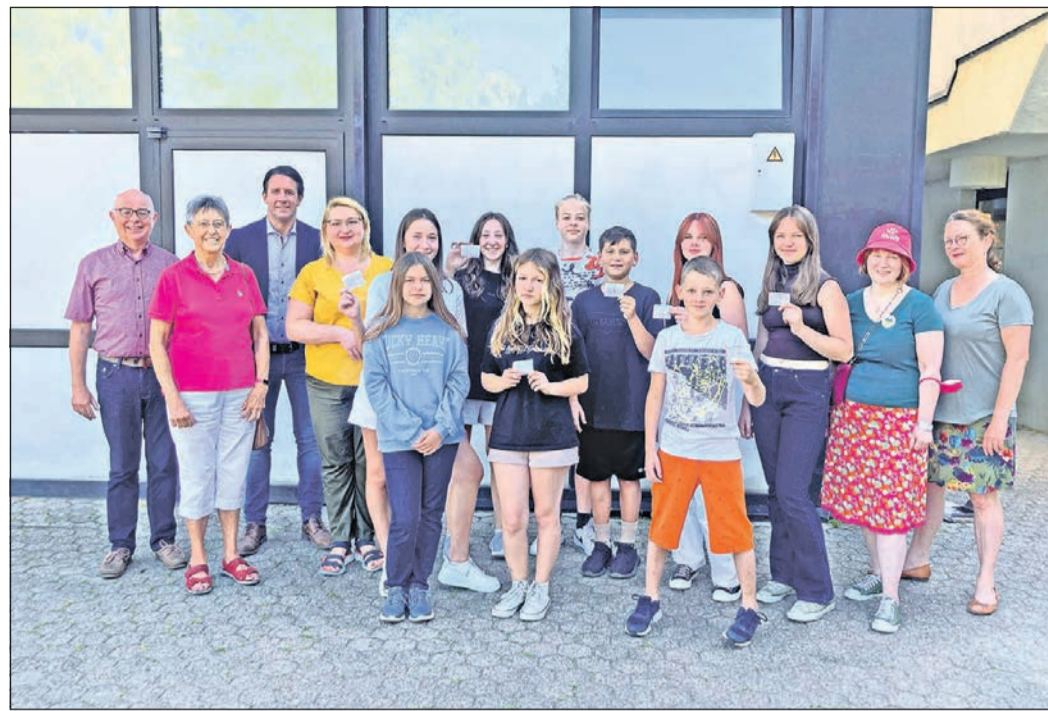
Die Christkönigsgemeinde unterstützt die 18 Schüler aus der Ukraine, die an der Heinrich-von-Kleist-Schule unterrichtet werden, im Juli mit dem Neun-Euro-Ticket.

www.kronberger-lichtspiele.de klimatisiert 06173/ 7 93 85