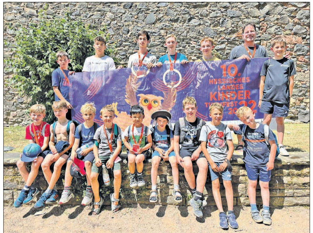
Die stolzen Teilnehmer der Jungen des TV Eschborn beim Landeskinderturnfest.