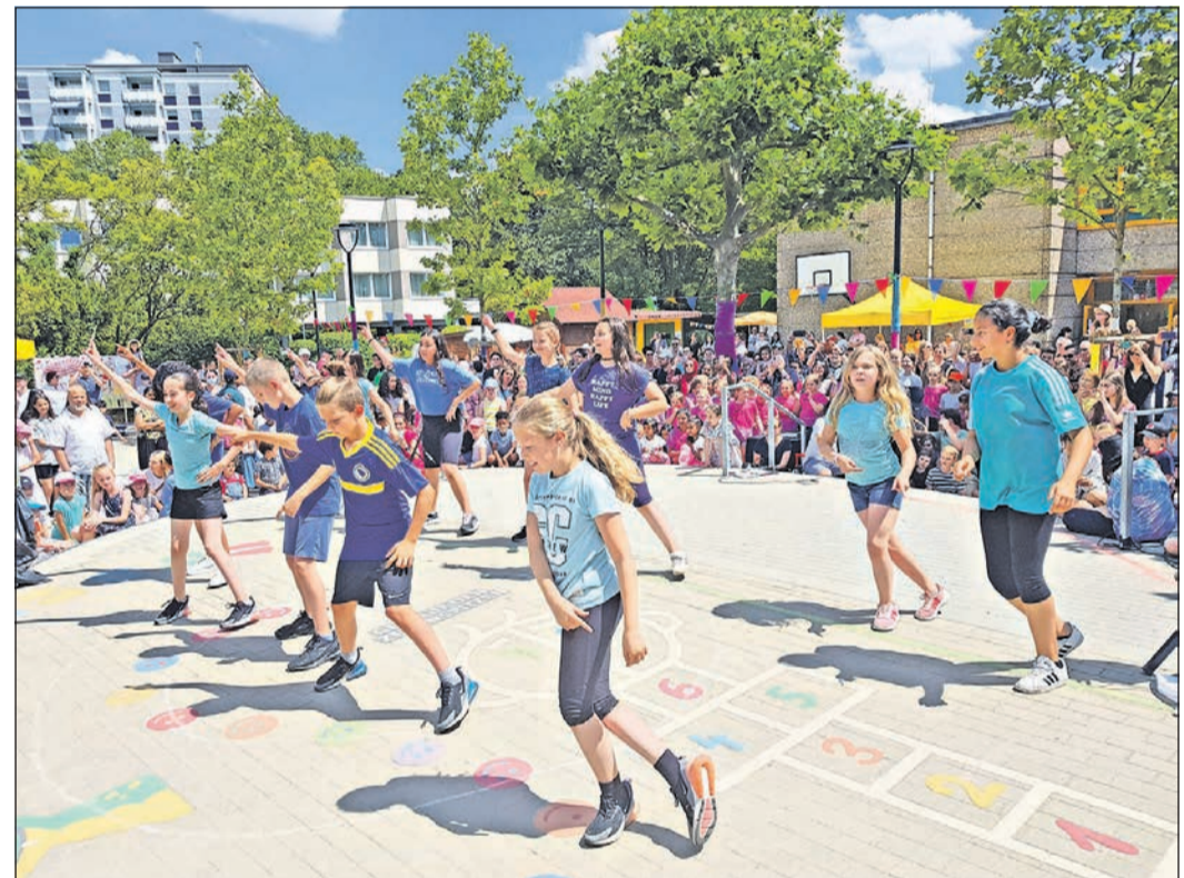
Verschiedene Tanzgruppen sind mit ihren Choreografien beim Jubiläumfest auf der Bühne zu sehen.

Eschborn (ew). Für das im Wiesenbades geplante zusätzliche Schwimmbekken sind Umlagearbeiten des Abwasserkanals erforderlich. Daher ist seit 30. Juni bis Ende Juli der Verbindungsweg vom Parkplatz des Schwimmbads bis zur Pfingstbrunnenstraße für den Rad- und Fußgänger-Verkehr komplett gesperrt. Das ausführende Unternehmen ist bestrebt, die Baustelle bis zur Badesaison der Sommerferien abgeschlossen zu haben.