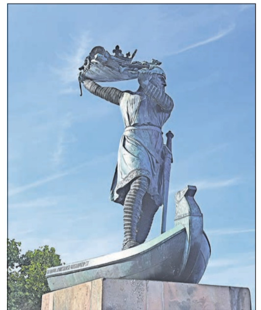
Das Hagendenkmal – direkt am Rhein gelegen – erinnert an die Versenkung des Nibelungenschatzes.

Drachentöter und Helden Siegfried, den Hagen dann mit List tötete. Im Museum können wir mit dem Multimedia-Guide die Sage und Geschichten Revue passieren lassen und von der Stadtmauer aus auch einen Blick auf das Kunstobjekt „Grabhügel Siegfrieds“ werfen. Unser Weg führt uns dann weiter hinunter zum Rhein. Hier grüßt von Weitem der noch erhaltene Nibelungenturm auf der mittlerweile modernisierten und stark befahrenen Nibelungenbrücke. Und wer soll den sagenumwobenen Nibelungenschatz geraubt und im Rhein versenkt haben? Das Hagendenkmal ein paar Schritte weiter am Rheinufer erinnert an dieses Ereignis und Hagen von Tronje. Wie schön, dass gerade neben mir ein Junge einen Cent gefunden hat, für ihn sicher ein Teil des Schatzes.