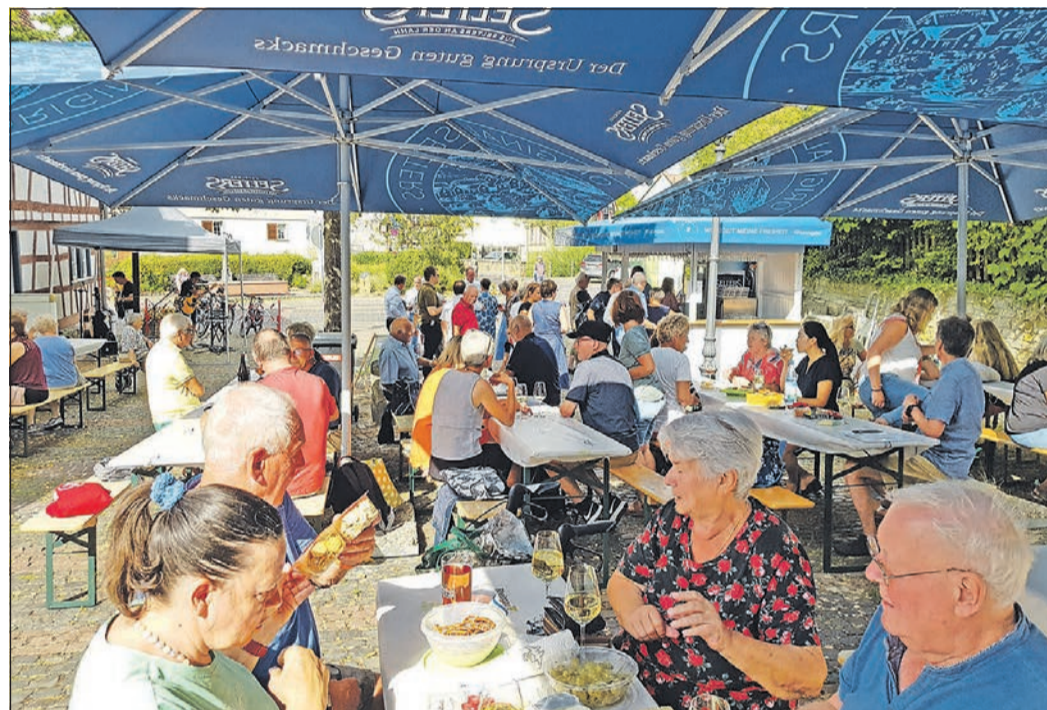
Das „Weindorf“ hat sich mittlerweile vom Geheimtipp zum beliebten Treff entwickelt, und bis September können noch die edlen Weine verkostet werden.

Konzert , im Rahmen von „Summertime“, „Havanna con Klasse“, kubanische Rhythmen und karibisches Lebensgefühl, Stadt Eschborn, Feuerwehr Niederhöchstadt, Georg-Büchner-Straße, 19.30 Uhr