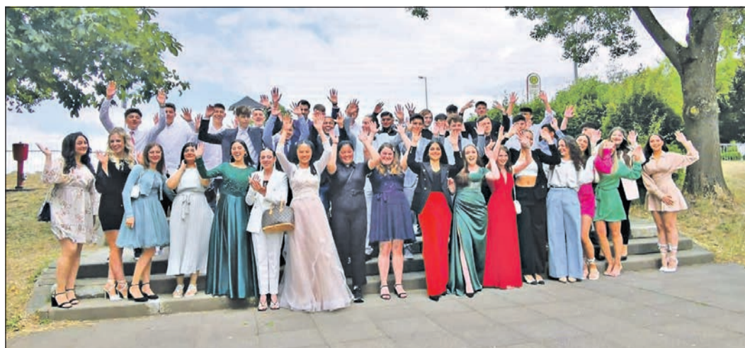
73 Schüler haben in diesem Jahr ihren Real- und Hauptschulabschluss an der Heinrich-von-Kleist-Schule absolviert und feiern dies gemeinsam.

Weitere Informationen rund um die Heinrich-von-Kleist-Schule erhalten Interessierte unter Telefon 06196-95700.