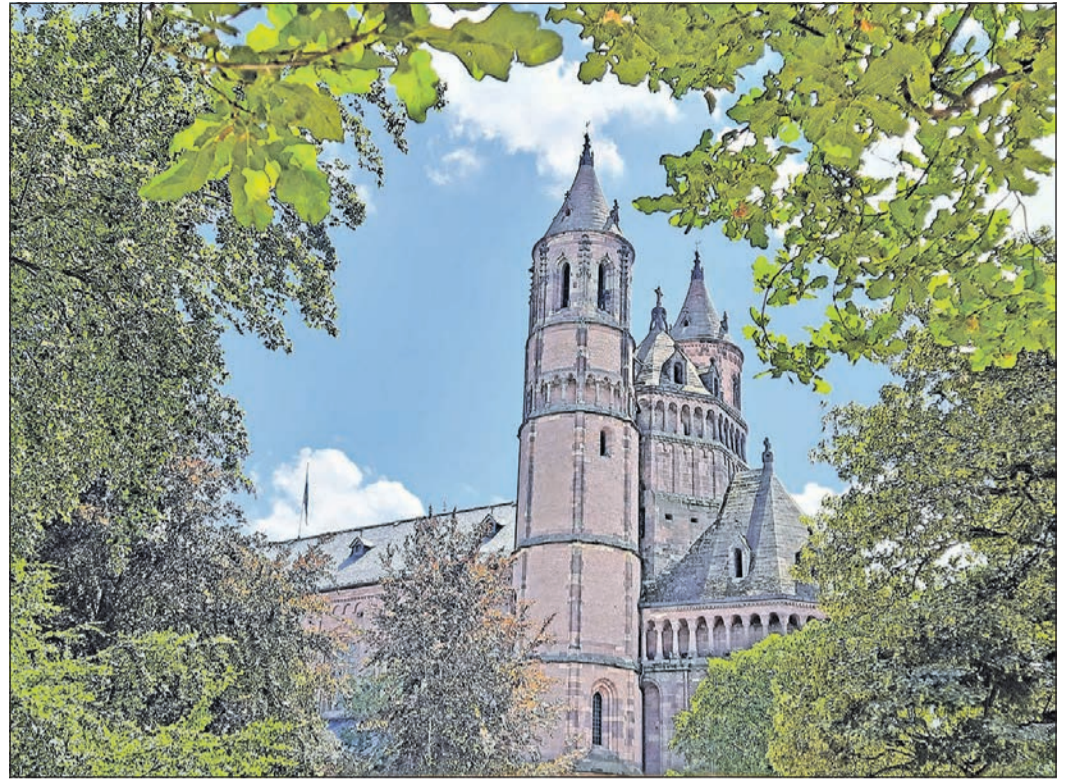
Ein Blick auf den Dom St. Peter, den kleinsten der drei rheinischen Kaiserdomen, bietet sich auch vom Heylshofpark aus.

Durch den idyllischen Heylshofpark, in dem sich für Kunstfreunde das Museum „Kunsthof Heylshof“ befindet, eines der führenden Kunstmuseen in Rheinland-Pfalz, erreichen wir die Parkanlagen entlang der ringförmig