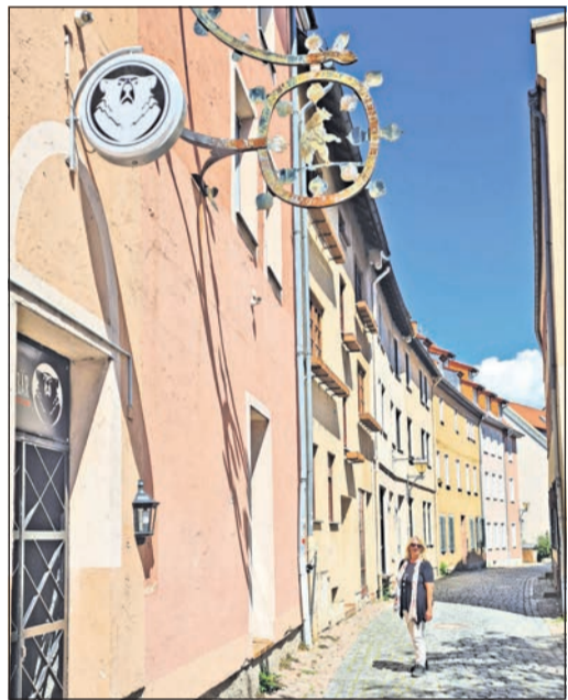
Durch die Judengasse gelangt der Besucher zur Synagoge.

Früh aufgestanden, starten wir am Samstagmorgen mit Sonnenmilch, guter Laune und weiteren wichtigen Utensilien im Gepäck zu unserem Ausflug. Mit der S-Bahn S1, Abfahrt 8.12 Uhr ab Frankfurt-Hauptbahnhof oder 8.30 Uhr ab Hattersheim, geht es zunächst