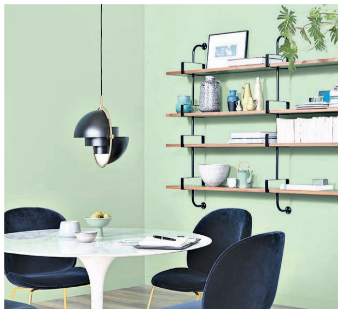
Mehr Mut zur Farbe: Das kreative Kombinieren von Wandfarben, Bödenbelägen und Möbeln verleiht dem eigenen Zuhause mehr Ambiente.

(djd). Erst Abwechslung macht das Leben bunt und fröhlich, gerade im eigenen Zuhause. Viele Selbstermacher zeigen heute Mut zur Farbe und setzen mit individuell gestalteten Wänden besondere Akzente. Schließlich verändert eine neue Wandfarbe die Raumatmosphäre so schnell und einfach wie kaum eine andere Modernisierung. Mit 32 Tönen bieten etwa die Trendfarben von Schöner Wohnen-Farbe viele Möglichkeiten, vom dunklen Dschungelgrün über das angesagte Beige von „Cosy“ bis zu kräftigen fruchtigen Akzenten. Für ein einfaches Verschönern sind die Dispersionsfarben fertig gemischt in unterschiedlichen Gebindegrößen im Fachhandel sowie in vielen Baumärkten erhältlich. Unter www.schoener-wohnen-farbe.com etwa gibt es mehr Details und Tipps für den nächsten Anstrich.