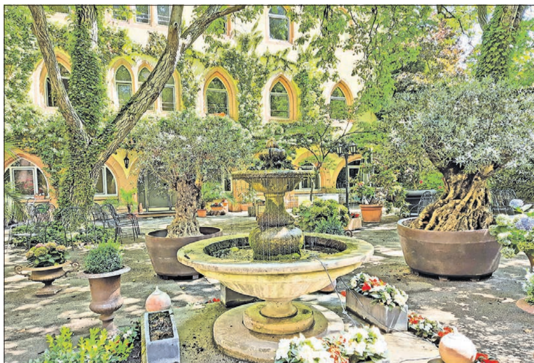
Eine Oase der Ruhe: Der idyllische Garten im Innenhof von St. Martin lädt zum Verweilen und Entspannen ein.

! Nibelungenmuseum, Fischerpfortchen 10: Öffnungszeiten dienstags bis freitags von 10 bis 17 Uhr, samstags und sonntags von 10 bis 18 Uhr; Kaiserdom St. Peter: Besichtigung im Sommerhalbjahr montags bis freitags von 9 bis 17.45 Uhr, samstags von 9 bis 17.30 Uhr und sonntags von 12.45 bis 16.45 Uhr, Domführung werktags um 14 Uhr ab Südportal. Nibelungen-Festspiele „Hildensaga. ein königinnendrama“ von Ferdinand Schmalz, eines der bekanntesten Open-Air-Theaterfestivals Deutschlands, auf der Freilichtbühne vor dem Dom noch bis zum 31. Juli.