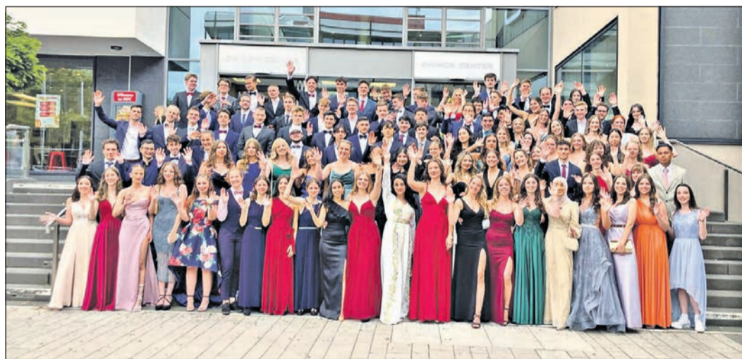
An der Heinrich-von-Kleist-Schule haben in diesem Jahr 110 Schüler ihr Abitur bestanden und feiern voller Freude ihren Abiball.

Folgende Angaben werden dafür benötigt: Name, Telefonnummer und Anzahl der gewünschten Ferienpässe. Falls jemand den Ferienpass für „Nachbarn“ mitbestellt, bitte auch deren Name und die Anzahl der gewünschten Pässe angeben.