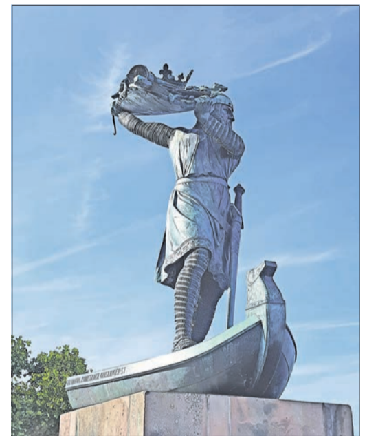
Das Hagendenkmal – direkt am Rhein gelegen – erinnert an die Versenkung des Nibelungenschatzes.

Drachentöter und Helden Siegfried, den Hagen dann mit List tötete. Im Museum können wir mit dem Multimedia-Guide die Sage und Geschichten Revue passieren lassen und von der Stadtmauer aus auch einen Blick auf das Kunstobjekt „Grabhügel Siegfrieds“ werfen. Unser Weg führt uns dann weiter hinunter zum Rhein. Hier grüßt von Weitem der noch erhaltene Nibelungenturm auf der mittlerweile modernisierten und stark befahrenen Nibelungenbrücke. Und wer soll den sagenumwobenen Nibelungenschatz geraubt und im Rhein versenkt haben? Das Hagendenkmal ein paar Schritte weiter am Rheinufer erinnert an dieses Ereignis und Hagen von Tronje. Wie schön, dass gerade neben mir ein Junge einen Cent gefunden hat, für ihn sicher ein Teil des Schatzes.