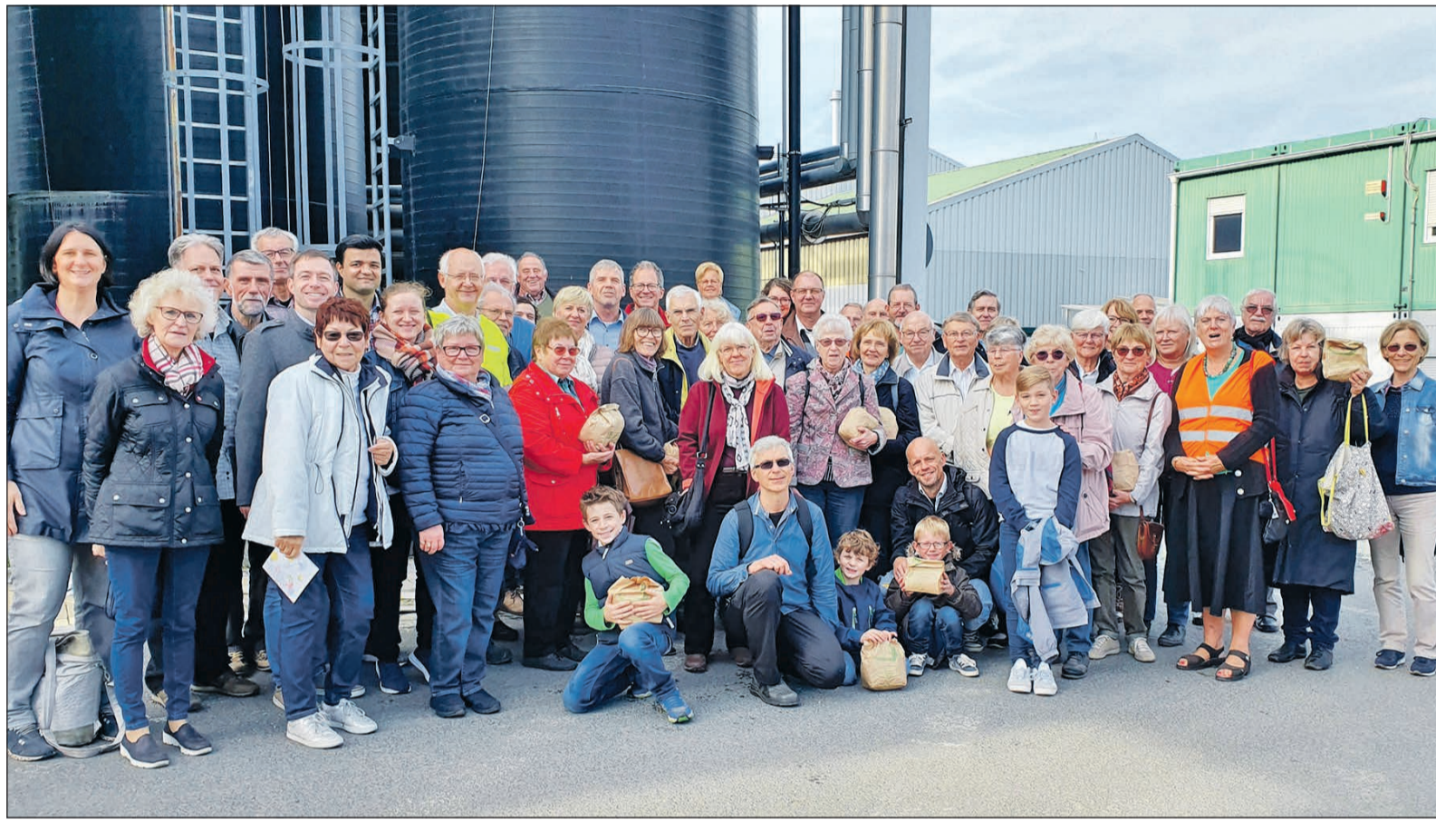
An den Deponieführungen besteht immer großes Interesse.