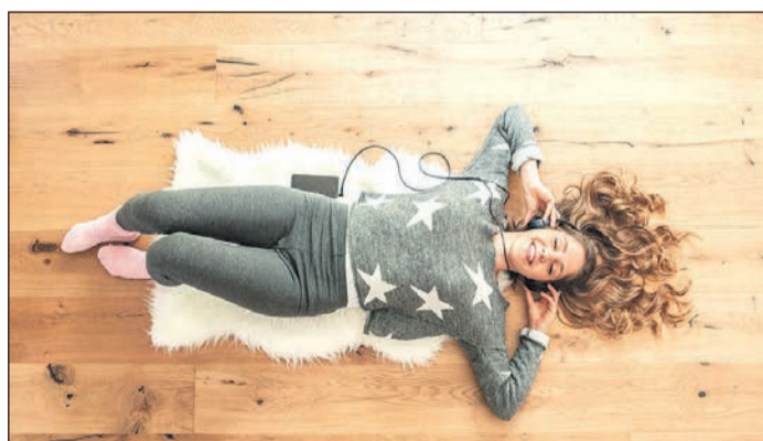
Urgemütlich und natürlich: Parkett ist ein echter Klassiker für die hochwertige Bodengestaltung. Mit der richtigen Pflege und Reinigung hat man lange Freude daran.