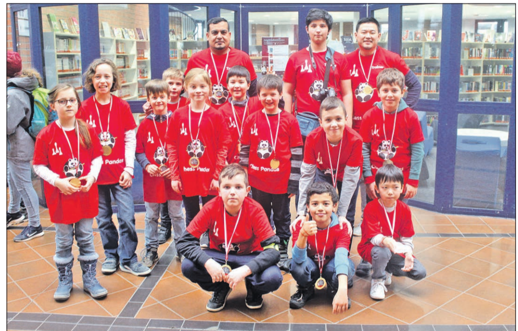
Die „Chess Pandas“ mit gutem Ergebnis beim Schulschachturnier.