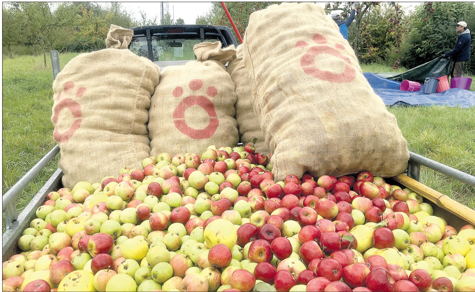
Rund 3,5 Tonnen Äpfel brachte der OGV, um 1250 Liter „Jubi-Schoppen“ zu keltern. Sie stammten alle von Eschborner und Niederhöchststädter Gemarkung sowie der vereinseigenen Obstwiese.