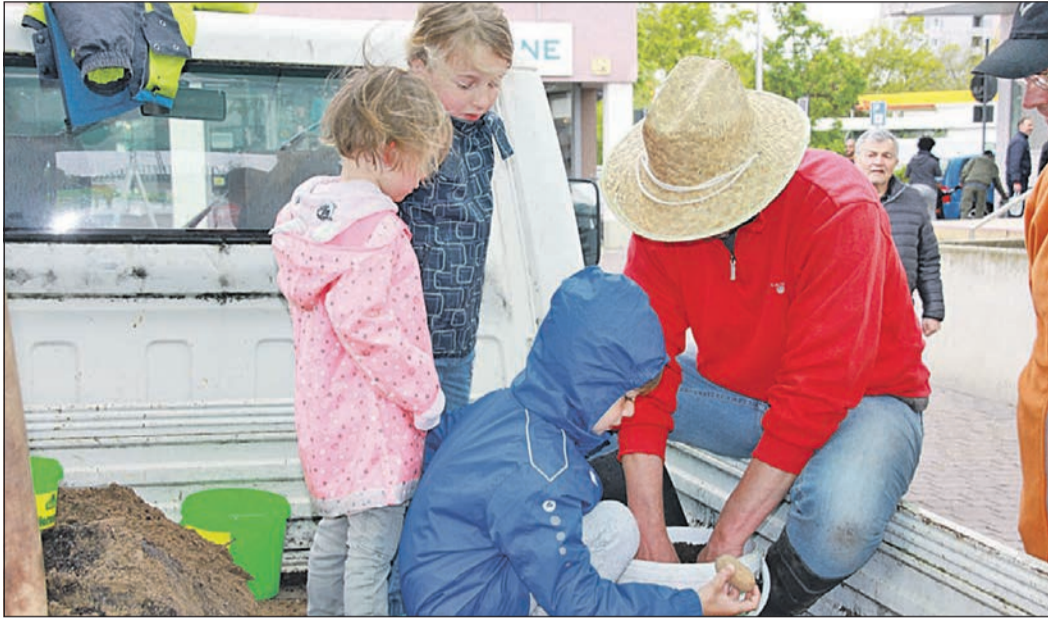
Das Foto zeigt Kinder beim Pflanzen der Eimer-Kartoffel beim Pflanztag 2019.