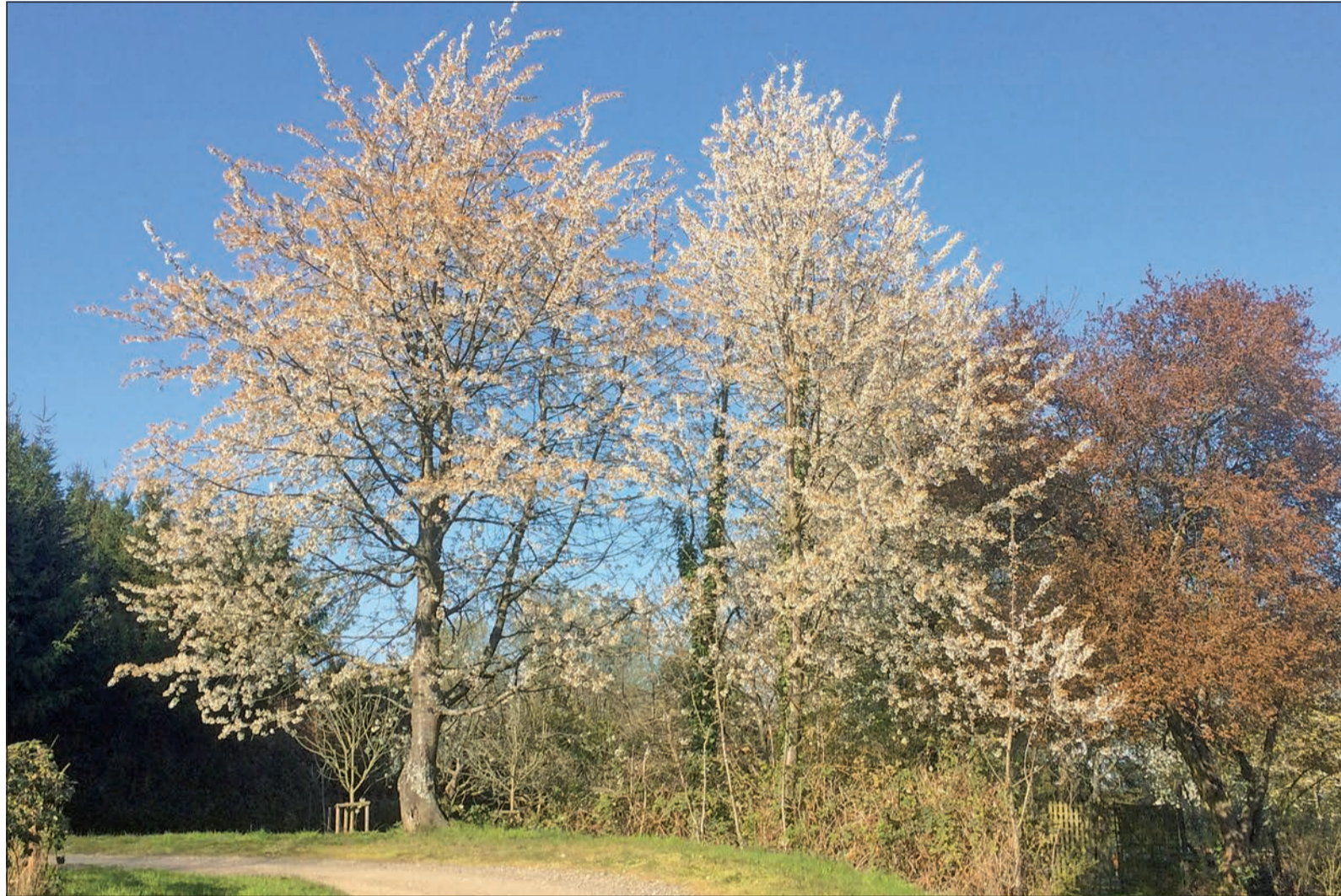
Die Kirschbäume stehen in voller Blütenpracht, da tut ein Spaziergang an den Feiertagen gut, um bei bestem Frühlingwetter und wunderschönen Eindrücken in der Natur die Seele baumeln zu lassen und positiven Gedanken nachzuhängen.