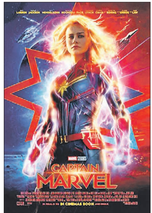
Beim Montagskino wird am 10. August Captain Marvel gezeigt. Foto: Walt Disney

Mo-Fr 9:30-18:00, Mi+Sa 9:30-13:00 Wunschtermine / Hausbesuche nach Vereinbarung