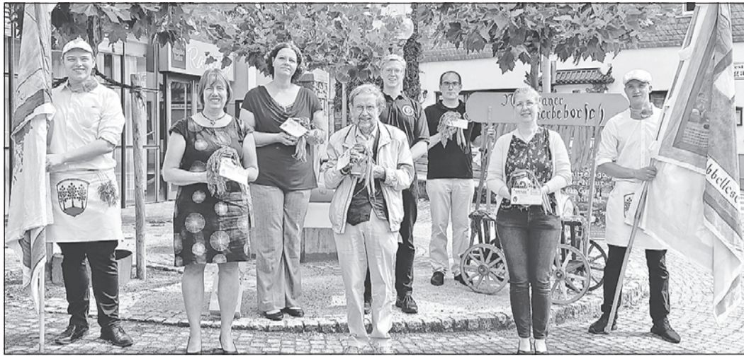
Die Neuenhainer Kerb wird an diesem ersten Sonntag im August schmerzlich vermisst. Die Mitglieder des Kerbvereins Neuenhain wollen das Miteinander deshalb auf andere Weise unterstützen und spenden insgesamt 4000 Euro an fünf Neuenhainer Institutionen.