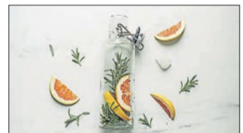
Mit Rosmarin und Grapefruit wird Leitungswasser zu einem erfrischenden Sommerdrink.

der Webseite findet man eine Auswahl von veganen, plastikfreien und nachhaltigen Trinkwasserflaschen.