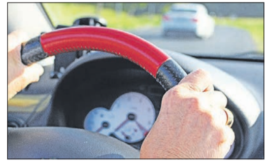
Steuer fest im Griff und den Tacho im Blick? Für unfallfreies Fahren werden jetzt wieder Ehrungen verteilt.

Die Bandbreite reicht von einer Bronze-Auszeichnung für zehn Jahre unfallfreies Fahren bis zum Goldenen Lorbeerblatt für 50 Jahre. Bedingung ist, dass die Fahrer nicht wegen einer Verletzung von Straßenverkehrsvorschriften gerichtlich bestraft worden sind. Außerdem dürfen sie keinen Eintrag im Verkehrszentralregister beim Kraftfahrtbundesamt haben. Ihnen darf auch zu keinem Zeitpunkt die Fahrerlaubnis entzogen worden sein.