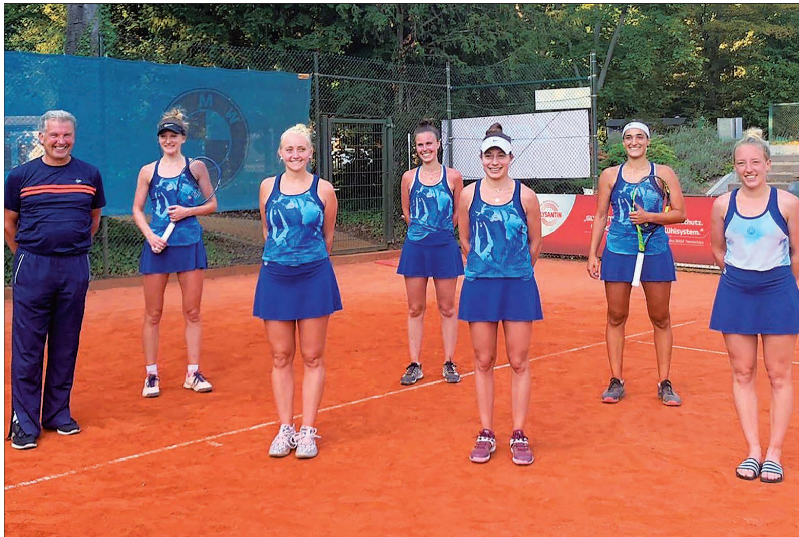
Die Damenmannschaft von „tennis 65 eschborn“ macht nach dem Gewinn der Hessenmeisterschaft jetzt auch den Aufstieg in die Regionalliga nach achtstündigem Hitzemarathon perfekt.