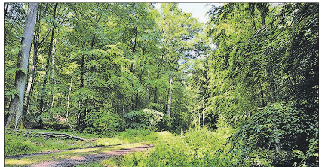
So schön ist der Wald im Main-Taunus-Kreis.

Die Region hat die Chance, Biosphärenregion zu werden. Aktuell wird in der Machbarkeitsstudie Biosphärenregion des Hessischen Ministeriums für Umwelt, Klimaschutz, Landwirtschaft und Verbraucherschutz untersucht, ob alle Voraussetzungen erfüllt werden. Gemeinsam wird ein Weg dafür gesucht und alle Bürger sind dazu aufgerufen, mitzumachen. Der Kreis bietet eine kostenlose Energieberatung. Hauseigentümer, Bauwillige, Mieter, Vereine, Unternehmer und Inhaber von gewerblich genutzten Gebäuden können Fragen rund ums Thema Energiesparen klären. Mehr Infos im Internet unter www.mtk.org .