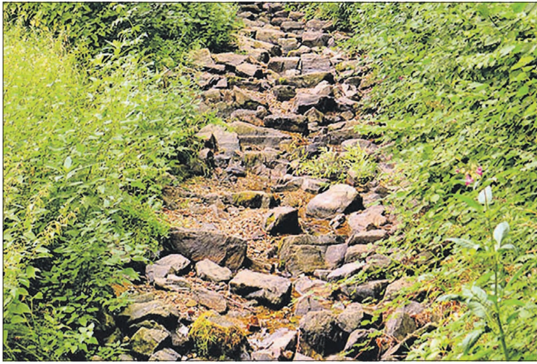
Die aktuelle Lage am Liederbach zeigt das Foto. Um die Schäden durch die Trockenheit abzuwenden, hat der Kreis eine Verfügung erlassen, die die Wasserentnahme aus den Bächen verbietet. Dies gilt auch für den hiesigen Westerbach.