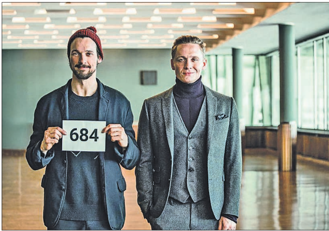
Spielfilm „100 Dinge“ mit Matthias Schweighöfer.