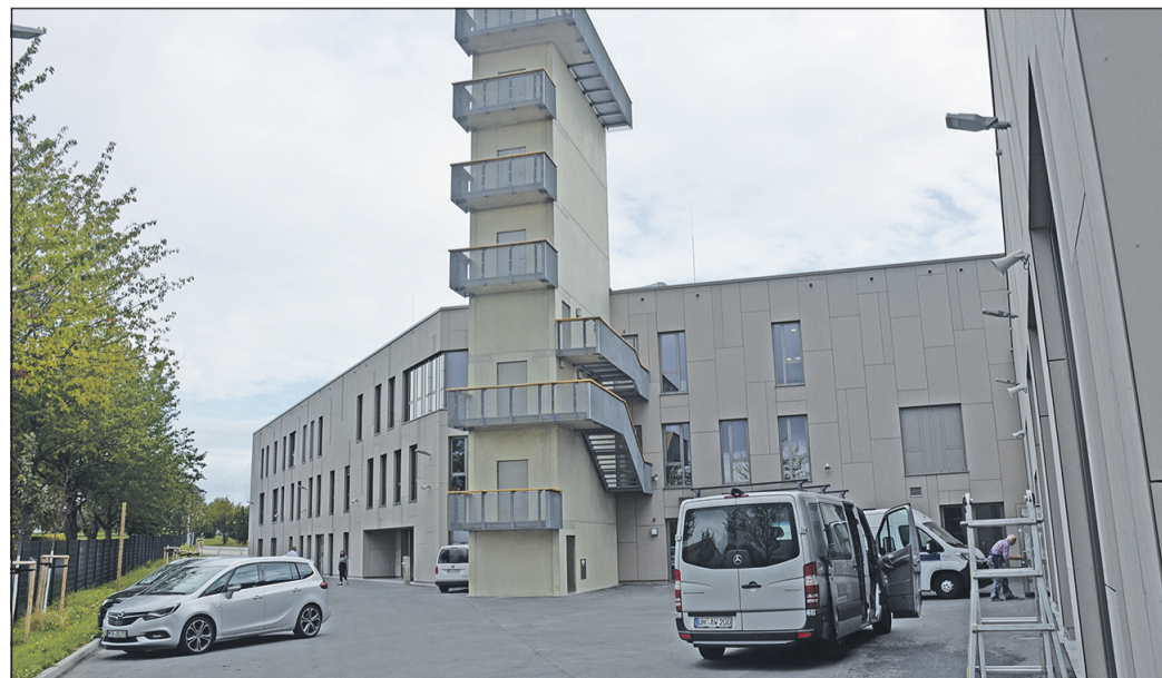
Sechs Stockwerke hoch ragt der Schlauchturm am neuen Notfallzentrum an der L3006 in die Höhe. An seiner Spitze weist die Notrufnummer 112 auf die wichtigsten „Bewohner“ des 26,5 Millionen-Bauwerks hin.

moderner und zukunftsorientierter ausgerüstet. Mehrere Schulungsräume, Platz für den Nachwuchs von den Minis bis zur Jugendfeuerwehr in Fülle, Atemschutzwerkstatt, weitere Werkstatträume, Schlauchturm, funktionale Umkleiden nach modernstem Standard, eine „Florianstube“ für die Geselligkeit und als absolutes Highlight ein top ausgestattetes Fitnessstudio. Hier sollen die Feuerwehrleute ihre Körper stählen, zu Einsätzen sind sie dann wesentlich schneller am Ort als bisher. Das Notfallzentrum steht auf einem 16 000 Quadratmeter großen Grundstück im Anschluss an den Friedhof. Neben der Feuerwehr bietet es der Rettungswache des Main-Taunus-Kreises und dem ASB eine Heimat. Zur Freiwilligen Feuerwehr Eschborn gehören derzeit 72 Einsatzkräfte, darunter drei Hauptamtliche. Weitere 45 Wehrleute sind im Ortsteil Niederhöchststadt aktiv. Auch sie sollen vom neuen Zuhause der Wehr profitieren, alle seien „mit Herzblut unterwegs“, sagt Stadtbrandinspektor Stefan Leber. Eigentlich war der Einzug ja schon für Mai geplant, Corona hat für reichlich Verzögerung gesorgt. Eine große Einweihungsfeier mit den Bürgern der Stadt ist nun für April 2021 vorgesehen.