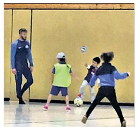
Sport und Spaß an Bewegung sind für die eigene Entwicklung und für die Gesundheit von Kindern enorm wichtig.