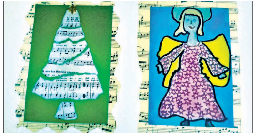
Doris Schwager hat das „Engelchen mit dem Sternenkleid“ gemalt. „Der klingende Weihnachtsbaum“ ist eine Collage von Andrea Martin.

Die Aktion bei „Wohnkunst“ in Bad Soden (Königsteiner Str./ Ecke Adlerstr. 1, Tel. 06196/533327) wurde angesetzt für heute (Donnerstag, 3. Dezember), morgen (Freitag, 4. Dezember) und ab kommenden Samstag, 5. Dezember, von 10.00 bis 18.00 Uhr