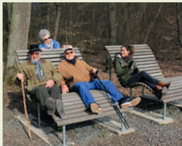
Auf den Relaxliegen kann man sich die Sonne mitten ins Gesicht scheinen lassen – wie auf unserem Foto diese entspannten Wetzlarer Spaziergänger.