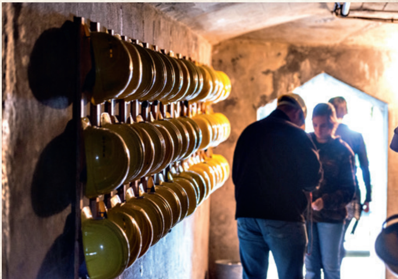
Der Stollen im Hauserberg ist im Rahmen eines geführten Rundgangs zu besichtigen.

Karten sind online im Ticketshop unter www.wetzlar-tourismus.de oder zu den Öffnungszeiten in der Tourist-Information (Montag bis Freitag von 10 bis 17 Uhr, Samstag von 10 bis 14 Uhr und Sonntag von 11 bis 15 Uhr), Domplatz 8, Wetzlar, Telefon: 06441 99-7755, E-Mail: tourist-info@wetzlar.de erhältlich.