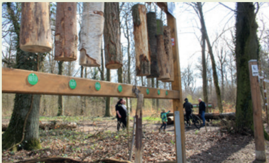
Wie klingen die Waldbaumarten speziell in Wetzlar? Hier kann man es ausprobieren.

an denen es vielerlei Wissenswertes über Mensch und Natur zu erfahren gibt. Darüber hinaus gewährt Hessen-Forst an Tafeln Einblick in die Waldwirtschaft. Jetzt geht's aber los: Der Wanderweg startet am Waldparkplatz Stoppelberg an der hinter dem Wetzlarer Krankenhaus und dem Lauftreffpark-