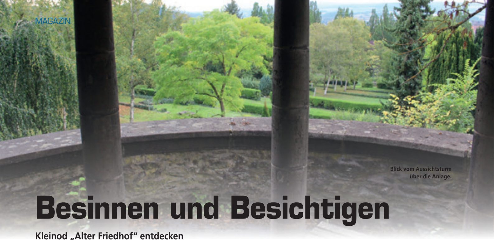
Blick vom Aussichtsturm über die Anlage.