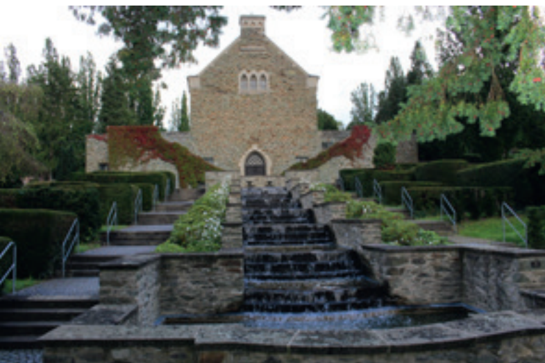
Toller Anblick: In Stufen plätschert das Wasser der Kaskaden friedlich bergab.

Die Wasserspiele sind derzeit täglich von 8 bis 18 Uhr durchgängig in Betrieb. (msk)