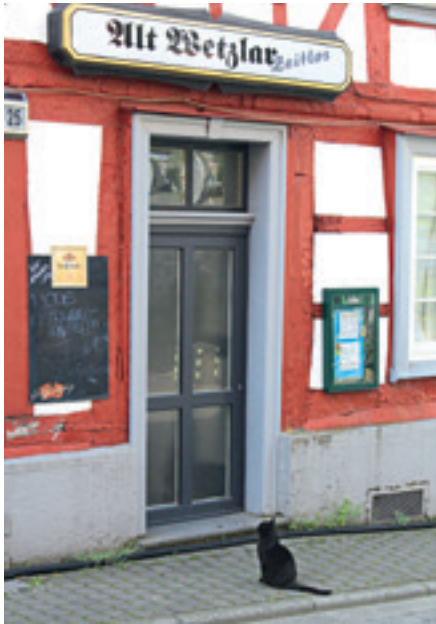
Gesehen in der Obertorstraße: Durstige Katze geht noch auf ein Feierabendbier, (um sich einen Kater anzutrinken?) und wartet geduldig auf Einlass.