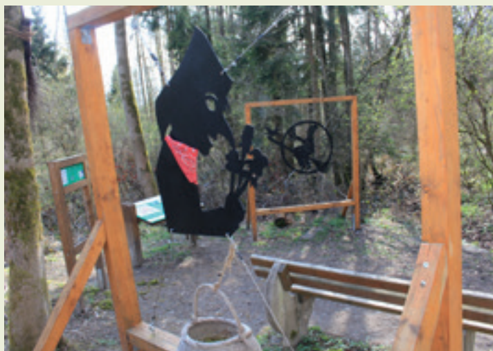
An der Station „Kochhanselbrunnen“ wandelt man auf zauberhaft-mythischen Pfaden.