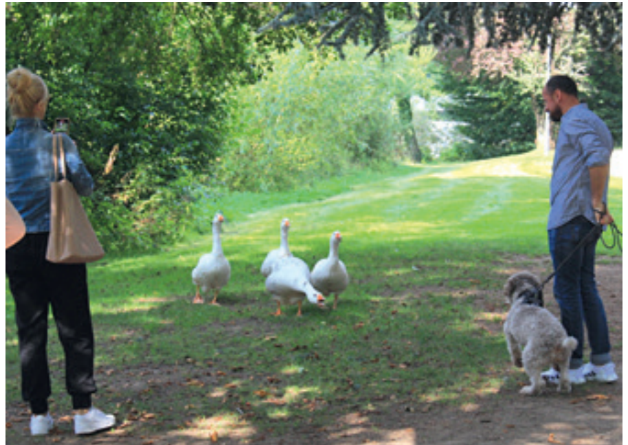
Gesehen in der Colchesteranlage: Knuffiges Hundchen will spielen, Teamchef des Gänsequartetts lehnt schnatternd/dankend ab.