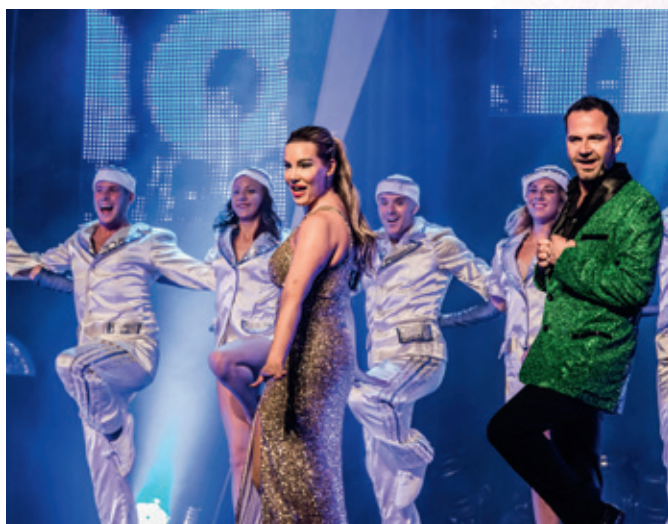
Weltbekannte Musicals warten am 6. März in der Buderus-Arena.