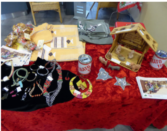
Am 4. Dezember kann man den Adventsmarkt im Haus der Kirche besuchen.

„Die Nacht der Musicals“, die erfolgreiche Musicalgala mit über 2 Millionen Besuchern, kommt am 6. März 2022 ab 19 Uhr nach Wetzlar in die Buderus-Arena. Weltbekannte Musicals wie Tanz der Vampire, Das Phantom der Oper oder Jesus Christ Superstar lassen die Herzen der Fans höherschlagen. Darsteller aus den Originalproduktionen bieten an einem einzigen Abend eine Zeitreise durch über 50 Jahre Musical-Geschichte. Tickets ab 49,90 Euro gibt es an allen bekannten Vorverkaufsstellen, im Internet unter www.dienachtdermusicals.de und unter der gebührenpflichtigen ASA-Ticket-Hotline 01806-570066.