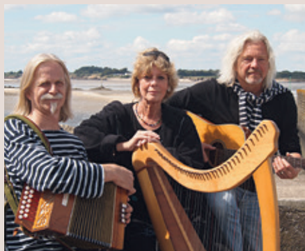
An Erming.

Lange bevor es Zeitungen und andere Medien gab, wurden Nachrichten von fahrenden Sängern und Musikanten von Ort zu Ort getragen – auch in der Bretagne. Das Programm PLOMADEG erzählt in (Tanz-) Liedern und Balladen heitere, bewegende, aber auch traurige Begebenheiten aus dem täglichen Leben der bretonischen Landbevölkerung. Zu Gehör kommen unter anderem die keltische Harfe, Bombarden, Flöten, Dudelsack, Geige und Drehleier.