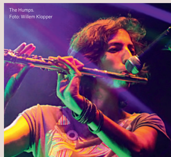
The Humps.