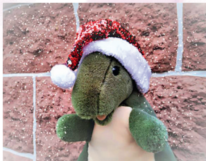
Der Weihnachtsdino wacht über die „Märchen am Dienstag“.