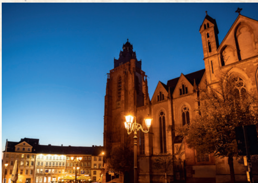
Wer Glück hat, erlebt bei einem der Rundgänge vielleicht Wetzlar zur blauen Stunde.

Karten sind vorab in der Tourist-Information, Domplatz 8, Wetzlar, Telefon: 06441-997755, E-Mail: tourist-info@wetzlar.de sowie in vielen bekannten Vorverkaufsstellen (Ticketssystem: Reservix) und online im Ticketshop unter www.wetzlar-tourismus.de erhältlich.