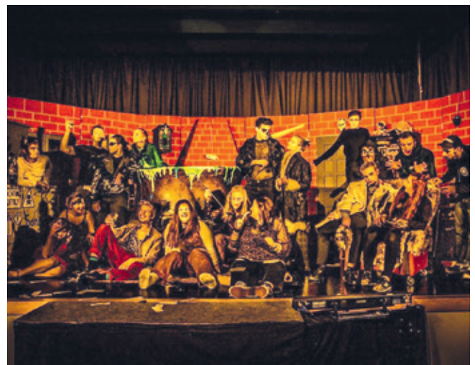
Das Jugendtheaterprojekt Wetzlar lässt Sherlock Holmes ermitteln.