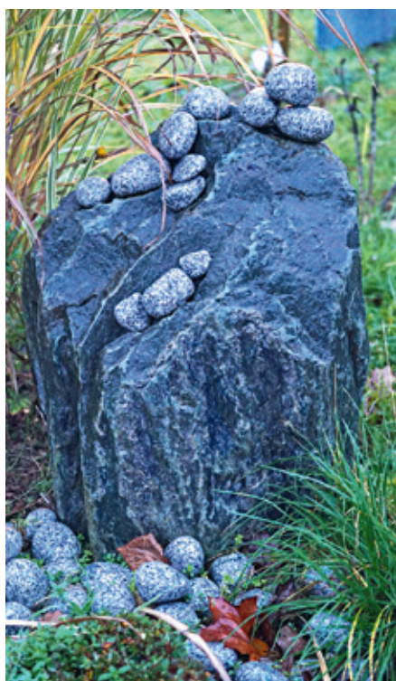
Hier können Steine abgelegt werden, um an liebe Menschen zu erinnern.

Damit das alles auch im Winter zu genießen ist, haben 20 Ehrenamtliche Patenschaften für einzelne Bereiche des Gartens übernommen, an dessen Aufbau über 40 Helfer mitgewirkt haben. Wer in der Stadt eine halbe Stunde Zeit übrig hat, sollte einmal den Garten der Sinne aufsuchen. Dort sollte Jeder etwas entdecken, dass das Auge erfreut. Übrigens: Ab dem ersten Adventssonntag bis zum 6. Januar wird ein Krippenweg im Garten zu bewundern sein. (mky)