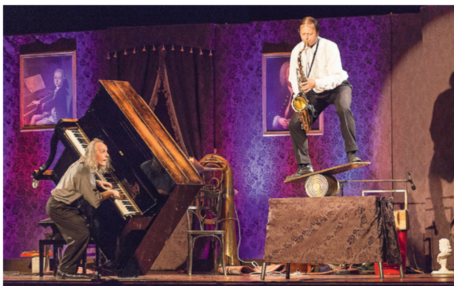
Gogol und Maex.

Karten gibt es unter anderem in der Tourist-Info am Domplatz und in Solms bei der Reiseagentur Lutz (Braunfelser Straße 20b). Karten-Hotline der Festspiele Wetzlar, Telefon 06441-22601, Eventim Telefon 01806-570086. Kartenverfügbarkeit unter www.wetzlarer-festspiele.de .