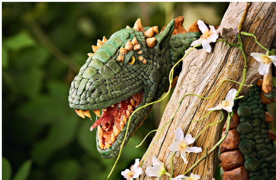
Der Lindwurm – eine der mythischen Figuren, die in der phantastischen Bibliothek am liebsten gesehen werden.