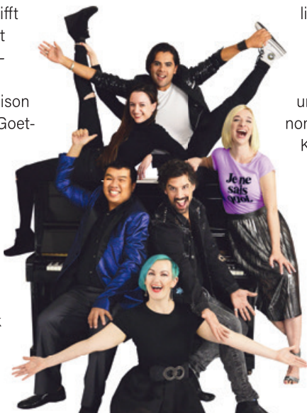
The Cast.

Mit dem Motto „Licht in mir“ der 69. Auflage des städtischen kulturellen Highlights wird das Team der Festspiele wieder lokale und nationale Größen des Showgeschäfts ins rechte Licht rücken. Vertrautes trifft auf Neues und nicht weniger als Sternstunden sind zu erwarten. Ein Höhepunkt der Saison vorweg: Passend zum Goethesommer kommt „Lotte“ als preisnominiertes Musical erneut und mit kleinen Änderungen vom 19. August (bis 4. September) an zwölf Abenden auf die Bühne zurück – natürlich am Originalschauplatz im Lottehof. Regisseur ist wieder Christoph