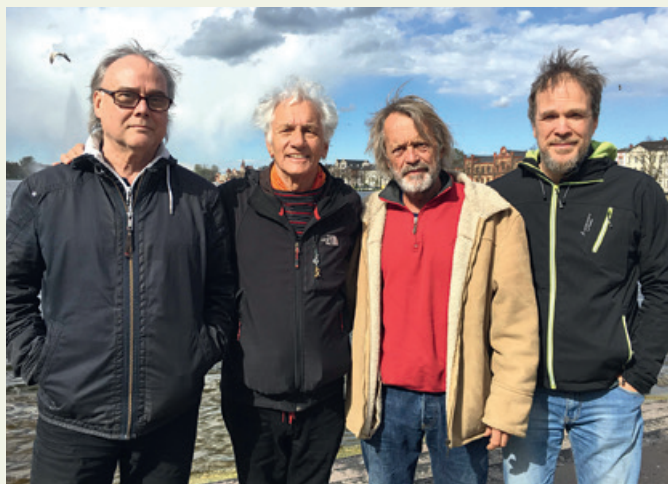
Im Franzis gibt sich am 6. Mai die legendäre Formation Guru Guru die Ehre.