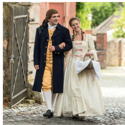
Lotte und Goethe spazieren.

Doch was ist der Hintergrund zu der Geschichte, die auch unter dem Titel „Die Leiden des jungen Goethes“ stehen könnte? Im Frühjahr 1772 fuhr Johann Wolfgang Goethe, ab 1782 von Goethe, in Wetzlar mit der Kutsche ein. Die kommenden Monate, die er dort verbrachte, prägten maßgeblich seinen Werdegang. Angereist war der gerade einmal 22-Jährige für ein Praktikum am Reichskammergericht, dem seiner Zeit höchsten deutschen Gericht. Sein Vater wollte es so. Doch der Rechtspraktikant beschäftigte sich mit der „Juristerei“ nur am Rande. Lieber widmete er sich seinem literarischen Frühwerk und erkundete die Natur des Lahntals.