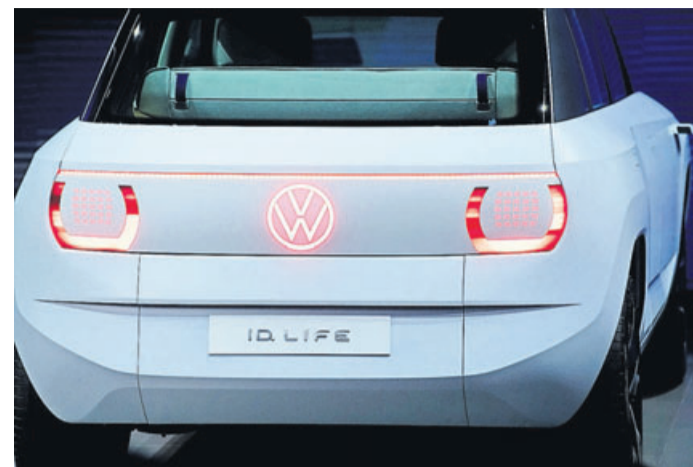
Billiger Stromer: VW zeigt auf der IAA die Studie eines elektrischen Einsteigerautos, das im Jahr 2025 auf den Markt kommen soll.

Doch dafür war die IAA diesmal auch eine Bühne für Newcomer. Das gilt nicht allein für die vielen Fahrradhersteller, die den Autobauern zahlenmäßig überlegen sind. Es mischen sich in München auch neue Automarken ins Messeprogramm, etwa chinesische Anbieter wie Wey mit dem elektrischen Oberklassen-SUV Coffee 01 oder Ora mit dem Retro-Kleinwagen Cat. Nischenmarken wie Microlino oder ACM stoßen mit winzigen Fahrzeugen in die Lücke zwischen Auto und Motorrad.