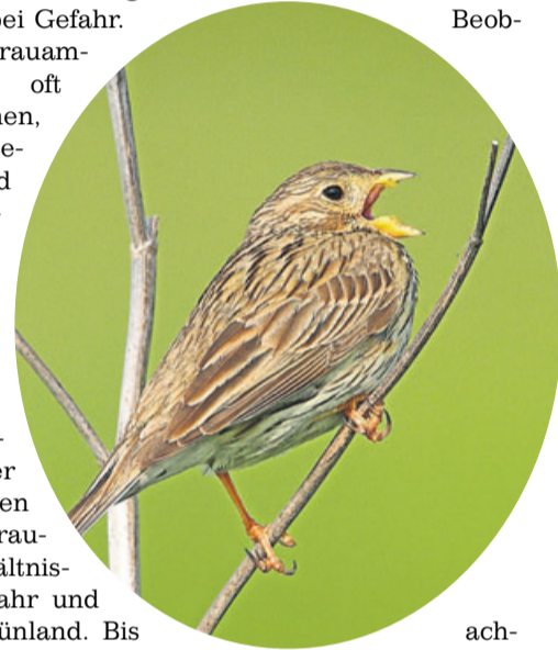
achten der Hessischen Gesellschaft für Ornithologie und Naturschutz (HGON) die Brutplätze der Art im Auftrag der Vogelschutzwarte, so dass die Neststandorte bei der Mahd ausgespart werden können. „Ohne den Einsatz der Landwirte wäre eine Zunahme der Grauammer-Bestände nicht möglich“, freut sich Stefan Stübing, Artberater des Landes Hessens, und erläutert, dass er aufgrund der Schutzmaßnahmen in diesem Jahr

he Mahdtermine die im Grünland gelegenen Nester; andererseits müssen die Landwirte qualitativ hochwertiges Futter für ihre Tiere bergen. Daher erfasst Stübing zusammen mit Beob-