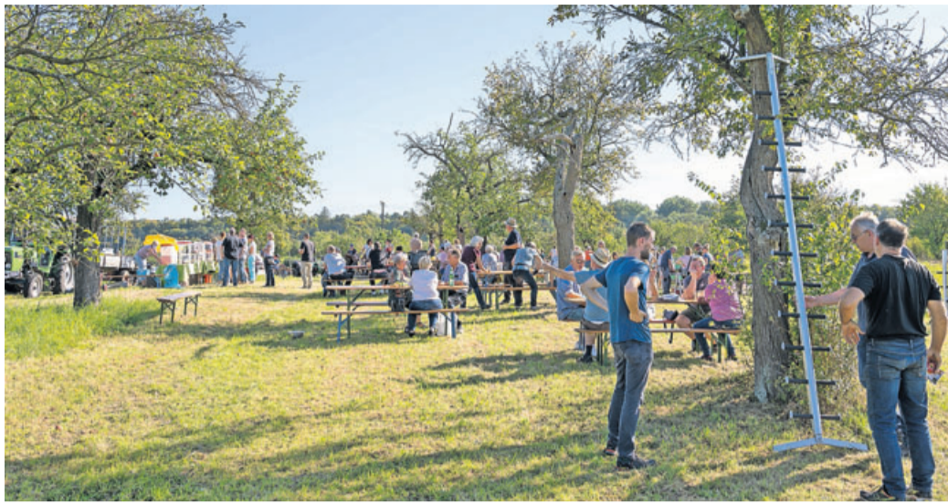
Auf der Streuobstwiese standen viele Geräte zum Testen bereit, wie hier die Einholleiter.