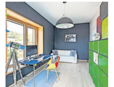
Vorausschauend planen: Ein zusätzlicher Raum schafft Flexibilität und die nötige Freiheit, die für eine gute Work-Life-Balance nötig sind.

Ein zusätzlicher Raum schafft Flexibilität und Freiheit, die für eine gute Work-Life-Balance nötig sind. Möglich ist beispielsweise auch eine Kombination aus Gäste- und Arbeitszimmer. So spart man im neuen Haus Platz. Der Arbeitsbereich sollte ruhig liegen und möglichst viel Tageslicht haben.