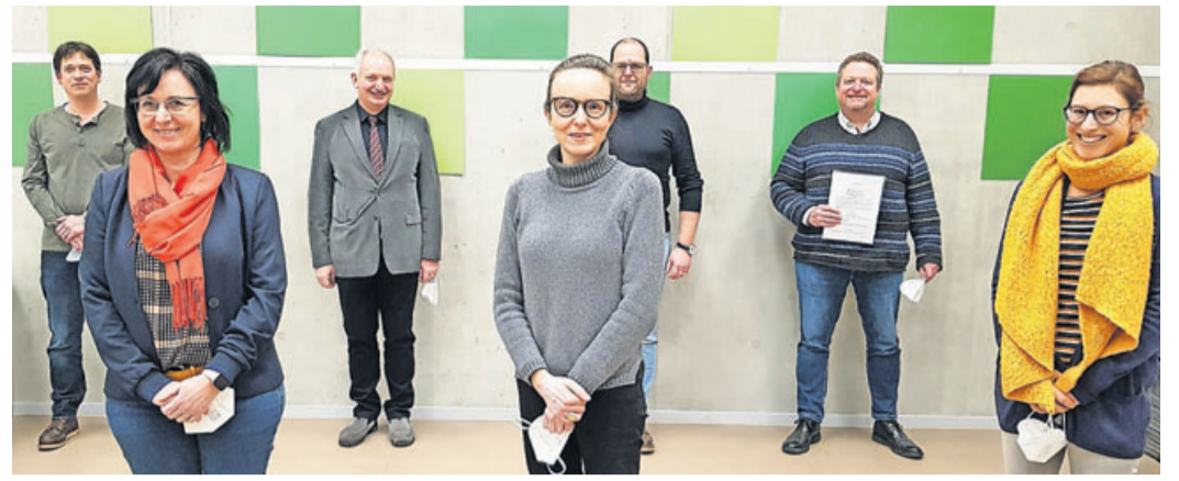
Die Gründungsmitglieder nach der Unterzeichnung der Satzung des Fördervereins.

Bad Nauheim. An der Sankt Lioba Schule hat sich der Förderverein Bildung plus gegründet, um auch in Zukunft die hohe Qualität der Schule zu sichern und weiter auszubauen. Der „Förderverein Bildung plus der Sankt Lioba Schule“ wurde aus der Initiative Bildung plus, bestehend aus Schulleitung, Schullehrerbeirat, Lehrkräften, Eltern und Ehemaligen gegründet, um das Bad Nauheimer Gymnasium pädagogisch, konzeptionell, infrastrukturbezogen und medientechnisch auf dem neuesten Stand zu halten. So soll sichergestellt werden, dass die Schule nachhaltig ein modernes und zukunftsfähiges Schulprofil anbieten kann. Bereits seit 2017 gab es an der Sankt Lioba Schule Bestrebungen, das Fundraising für neue Großprojekte zu systematisieren. Auslöser war das Vorhaben des Bistums Mainz als Schulträger der katholischen Schule, eine grundlegende Sanierung aller fünf Gebäudeteile durchzuführen. Zum ursprünglich geplanten Gesamtvolumen von rund 28 Millionen Euro sollte über Fundraising ein Millionenbetrag beigesteuert werden. Nach der Entscheidung des Bistums, dieses Vorhaben mit Blick auf sinkende Kirchensteuereinnahmen drastisch zu reduzieren, hat die damals gegründete Initiative ihre Tätigkeit unter geänderten Vorzeichen fortgesetzt. Jetzt galt die