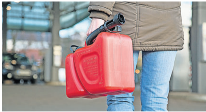
Stille Reserve: Kleine Mengen Benzin oder Diesel im Auto reichen in der Regel aus.

Aktuell klettern die Spritpreise nach oben. Wer eine günstige Tankgelegenheit gefunden hat, füllt den Tank bis an den Rand, gern auch den Ersatzkanister. Doch unbegrenzt dürfen Privatleute Sprit gar nicht mitnehmen, informiert der ADAC. Denn flüssige Kraftstoffe sind Gefahrgut, so der Tüv Süd. Privatpersonen dürfen für den persönlichen oder häuslichen Gebrauch oder für Freizeit und Sport zwar maximal 240 Liter transportieren. Doch ein eigentlicher Reservekanister sollte lediglich die Weiterfahrt bis zur nächsten Tankstelle sicherstellen. „In der Regel reichen damit fünf Liter“, so Vincenzo Lucà vom Tüv Süd. Aus Sicherheitsgründen rät auch der ADAC, nicht mehr als