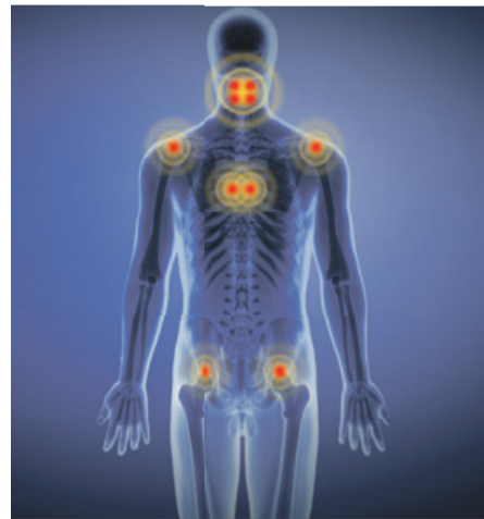
Muskelkaterartige Schmerzen bei allen körperlichen Tätigkeiten? Nacken, Rücken, Arme, Beine oder Brust sind stark druckempfindlich? Dann kann eine sogenannte Fibromyalgie vorliegen. Oft wechseln sich Schmerzattacken und schmerzfreie Perioden ab.

Mysteriöse Nervenschmerzen – was steckt dahinter? Mehr als 23 Millionen Deutsche klagen heutzutage über chronische Schmerzen. Was viele nicht wissen: Die Ursache sind häufig geschädigte oder gereizte Nerven! Mediziner sprechen von sogenannten Neuralgien (Nervenschmerzen). Diese können durch Stoffwechselstörungen wie Diabetes entstehen, aber auch Folge eines Bandscheibenvorfalles sein. Sogar hinter muskelkaterartigen Schmerzen können geschädigte Nerven stecken.