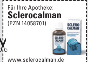
Abbildung Betroffenen nachempfunden SCLEROCALMAN. Wirkstoffe: Arnica montana Dil. D3, Barium iodatum Dil. D4, Conium maculatum Dil. D4, Secale cornutum Dil. D3. SCLEROCALMAN wird angewendet entsprechend dem homöopathischen Arzneimittelbild. Dazu gehört: Verkalkung der Hirngefäße. www.sclerocalman.de • Zu Risiken und Nebenwirkungen lesen Sie die Packungsbeilage und fragen Sie Ihren Arzt oder Apotheker. • PharmaSGP GmbH, 82166 Gräfelfing

Unser Tipp: Mit Sclerocalman (Apotheke, rezeptfrei) können Sie Ihrem Gedächtnis wieder auf die Sprünge helfen!