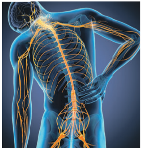
Ausstrahlende Rückenschmerzen können z.B. durch einen Bandscheibenvorfall, Unfall oder das Ischias-Syndrom bedingt sein. Die Folge: eine Verletzung, Quetschung oder Reizung der Nerven. Die Schmerzen strahlen oftmals bis in die Beine aus.

Ausstrahlende Rückenschmerzen? Brennende Schmerzen in Beinen oder Füßen? Begleitet von Taubheitsgefühlen oder Kribbeln? Vielen unbekannt: Dahinter stecken häufig geschädigte oder gereizte Nerven. Klassische Schmerzmittel helfen bei diesen sogenannten Nervenschmerzen nicht. Das bestätigt auch die Deutsche Gesellschaft für Neurologie in ihrer Leitlinie. 1 Das spezielle Arzneimittel Restaxil bekämpft hingegen speziell Nervenschmerzen und begeistert bereits zahlreiche Betroffene.