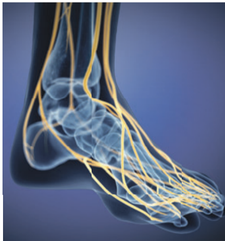
Brennende Schmerzen in den Füßen , die häufig auch in den Beinen auftreten: Vor allem Diabetes-Patienten kennen das. In vielen Fällen kommen Taubheitsgefühle oder Kribbeln begleitend hinzu – als würde man in einem Ameisenhaufen stehen.