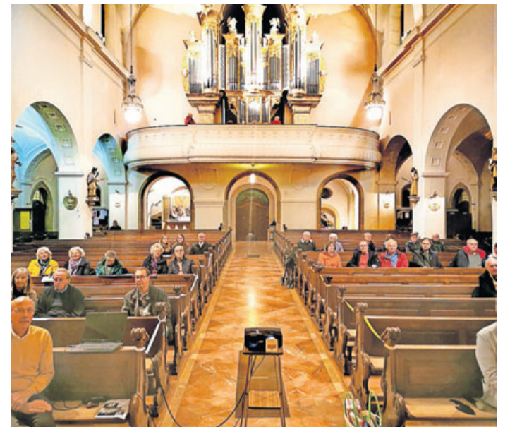
Die St. Jakobus Kirche in Ockstadt.