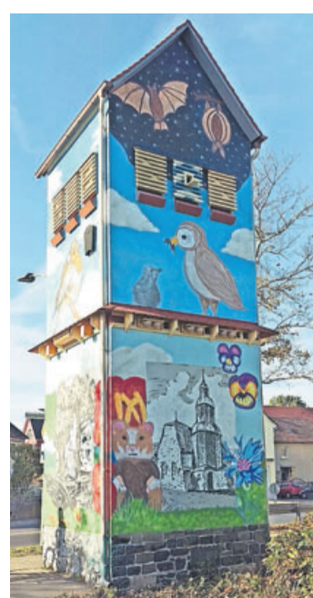
Ansichten des zum Tierhotel umgestalteten ehemaligen Trafoturms in Dorheim.

Eine weitere positive Überraschung war dann die Auszeichnung als Gewinnerprojekt bei der Umweltlotterie GENAU. Im Oktober strahlte der Hessische Rundfunk einen Bericht über den Trafoturm aus, wodurch das Engagement der Friedberger Nabu-Gruppe hessenweit bekannt gemacht wurde. Seitdem das Gerüst abgebaut wurde, ist das Tierhotel in vollem Umfang, direkt am Orts-