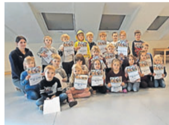
Alle Kinder erhielten am Ende eine Urkunde.