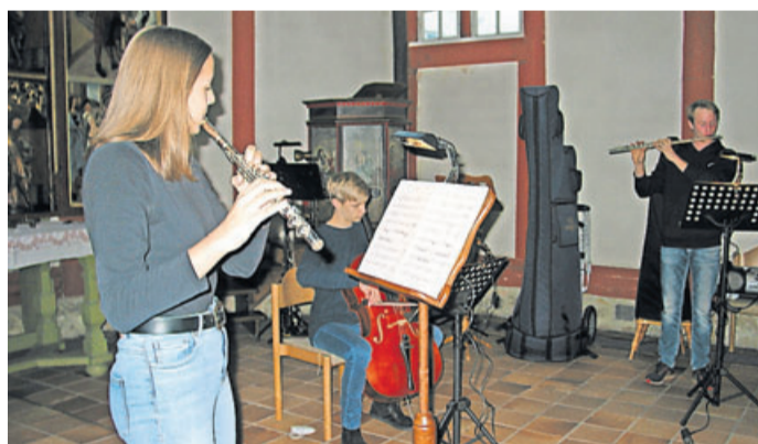
Das diesjährige Bläserkonzert wurde auf zwei Termine gelegt.

Sopran- und die Knickhalsbassblockflöte vertreten. Letztere stellte Gerd Schulz kurz vor und begründete den Knick im Hals mit der besseren Spielbarkeit. Das Spiel des Trios war mal lebendig, mal von ruhigem Klang, eben wie die jeweilige Komposition es erforderte.