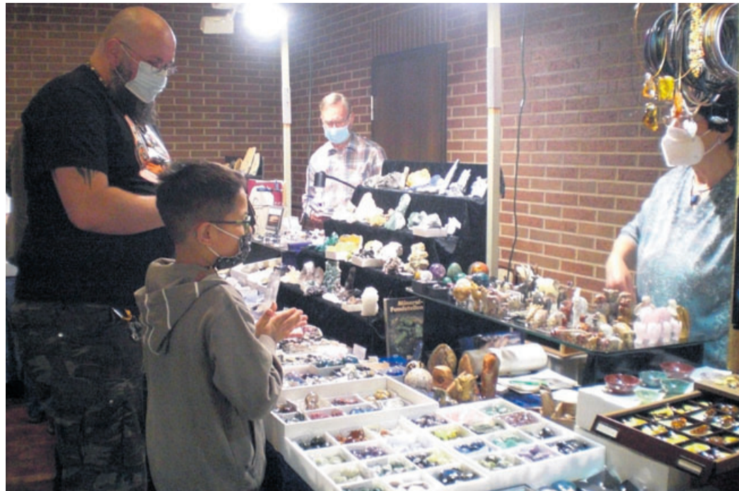
Die vielen älteren aber auch jungen Besucher und Besucherinnen interessierten sich besonders für Fossilien und Mineralien und wurden immer gut beraten.

Der Lions-Club achtet bei der Auswahl darauf, dass die Aussteller seriös sind, dass keine Fälschungen angeboten werden, auf ein ausgewogenes Verhältnis von