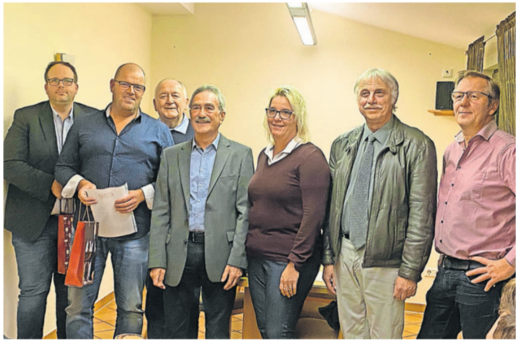
Die geehrten Mitglieder der CDU Münzenberg.

CDU Münzenberg hält gut besuchte Mitgliederversammlung ab