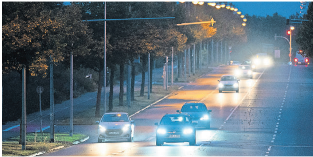
Morgens wird es später hell, abends früher dunkel: Autofahren im Herbst und Winter birgt besondere Herausforderungen – gerade auch für ältere Verkehrsteilnehmer.

Wer älter ist und schon länger Auto fährt, bringt zwar viel Erfahrung am Steuer mit. Doch auch die Risiken sind andere als in jüngeren Jahren. So kann zum Beispiel das Sehen bei Dämmerlicht eingeschränkt sein, warnt der Verein Alzheimer Forschung Initiative (AFI). Gerade jetzt in der kalten Jahreszeit sollten ältere Menschen daher prüfen, ob sie noch sicher am Steuer sind. Die Initiative bietet in ihrem kostenlosen Ratgeber „Sicher Auto fahren im Alter“ dazu eine Checkliste an. Einige Fragen helfen bei der Selbsteinschätzung, etwa: Haben Sie Schwierigkeiten, andere Verkehrsteilnehmer, Ampeln oder Verkehrszeichen zu erkennen und rechtzeitig darauf zu reagieren? Wer mindestens eine Frage mit Ja beantwortet, sollte das mit seinem Arzt oder seiner