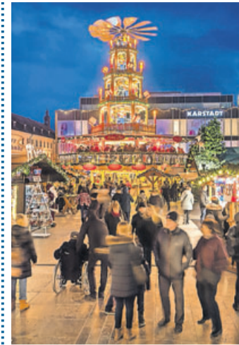
Der Weihnachtsmarkt Fulda soll wieder alle begeistern.

Fulda (re). Nach der Enttäuschung im vergangenen Jahr, freut sich die Stadt Fulda umso mehr auf den Weihnachtsmarkt 2021. Bei aller gebotenen Vorsicht will die Stadt den Bürgerinnen und Bürgern und allen Gästen wieder das ganz besondere weihnachtliche Flair in der wunderschönen Innenstadt bieten. Der Weihnachtsmarkt startet am 26. November und geht bis zum 23. Dezember, mit täglichen Öffnungszeiten von 11 bis 20 Uhr. Das zentrale Stichwort lautet „Entzerrung“. So wird die Gesamtfläche des Weihnachtsmarktes vergrößert, damit es zwischen den Ständen ausreichend Platz zum Flanieren und Genießen gibt sowie Möglichkeiten zum Abstandhalten. Erstmals wird es Stände an der Friedrichstraße geben. Unter dem Thema „Hüttenzauber“ entsteht hier ein at-