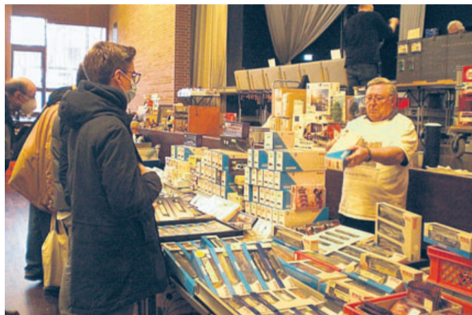
Alle Stände fanden das rege Interesse der großen und kleinen Besucher.

Modelleisenbahn- und Spielzeugbörse in Butzbach