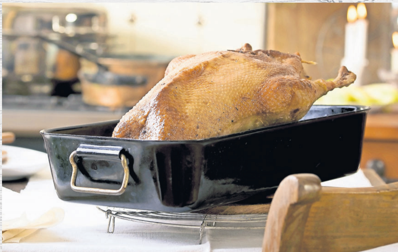
In der Gänse-Saison gibt es unterschiedliche Angebote.