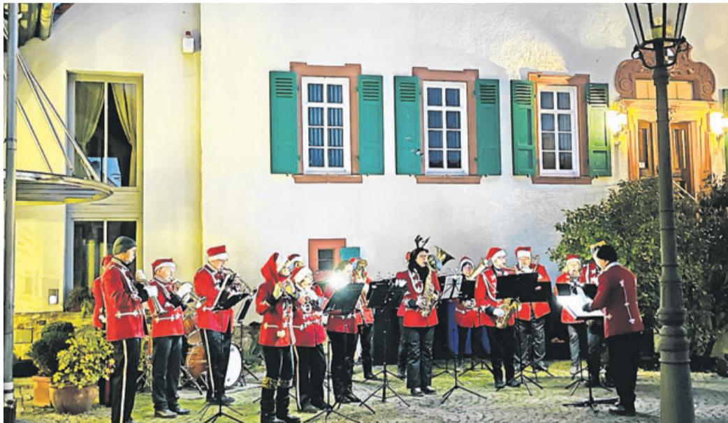
Die „Roten Husaren“ bringen die Lesung gelungen zum Abschluss.