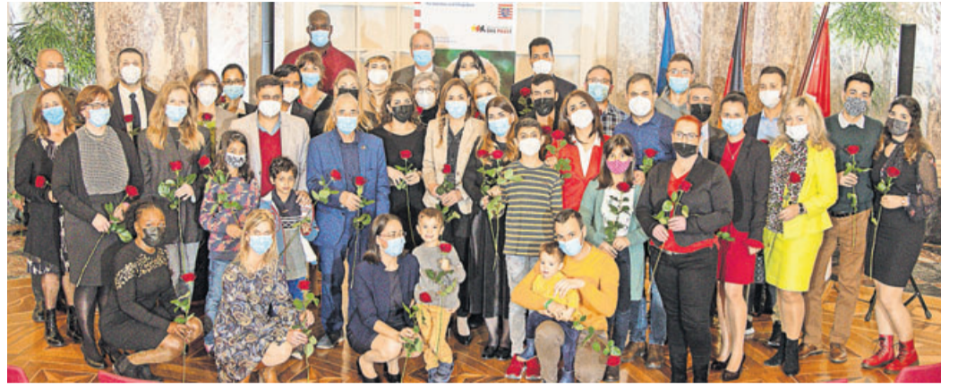
Höhepunkt waren die Live-Einbürgerungen.

Rosbach. Am 4. November fand die alljährliche Einbürgerungsfeier unter der Schirmherrschaft des Hessischen Ministerpräsidenten Volker Bouffier im Biebricher Schloss in Wiesbaden statt. In festlichem Ambiente wurden den neuen Deutschen gebührend für ihr Bekenntnis und ihre Entscheidung zu Deutschland gedankt.