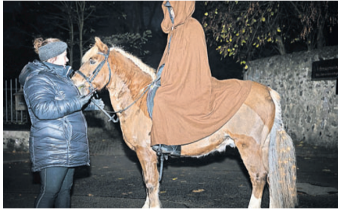
St. Martin ritt auf einem schön geschmücktem Pferd daher.

Echzell. „Laterne, Laterne...“ und andere Lieder sangen viele Familien des Geflügelzuchtvereins Bingenheim (GZV) in Kooperation mit dem Kindergottesdienst der Kirchengemeinden der Region West.