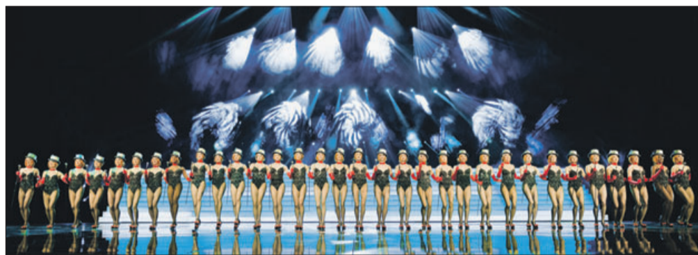
Ein großartiges Bild bietet die Kickline des Tanzensembles auf der Bühne des Friedrichstadt-Palasts.

„Die Känguru-Chroniken“ von Autor Marc-Uwe Kling kommen nun als Free-TV-Premiere auf die Bildschirme. Co-Produzent ZDF zeigt den Kinofilm am Samstag, 25. Dezember, 17.30 Uhr (in der ZDFmediathek ab 18. Dezember). Mächtigen Trübel veranstaltet das Känguru in der Kreuzberger Wohnung von Kleinkünstler Marc-Uwe (Dimitrij Schaad), mit dem es gemeinsam gegen einen Immobilienhai kämpft. Erzähler: Marc-Uwe Kling, Regie: Dani Levy.