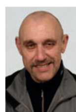
Raimund Knapp Versand