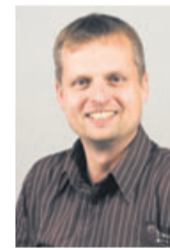
Michael Heil Redaktion