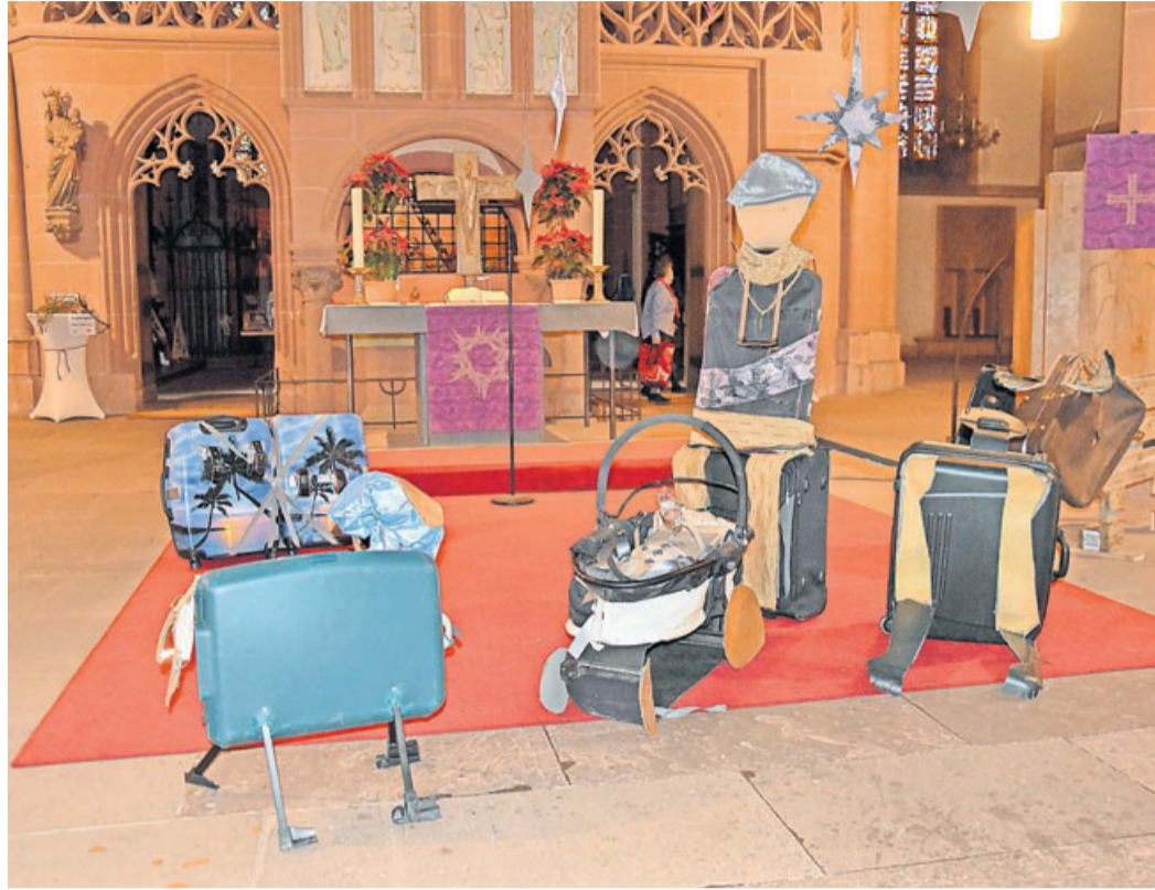
Alte Koffer gehörten zur Kunstaktion.

Kunstaktion rund um die Friedberger Stadtkirche klärt auf