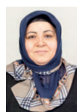
Yildiz Kozak Weiterverarbeitung