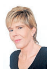
Petra Lückel Redaktion