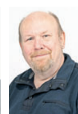
Peter Mayer Redaktion