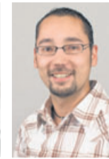
Matthias Boll Redaktion