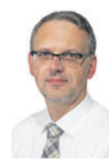
Stefan Herd Redaktion