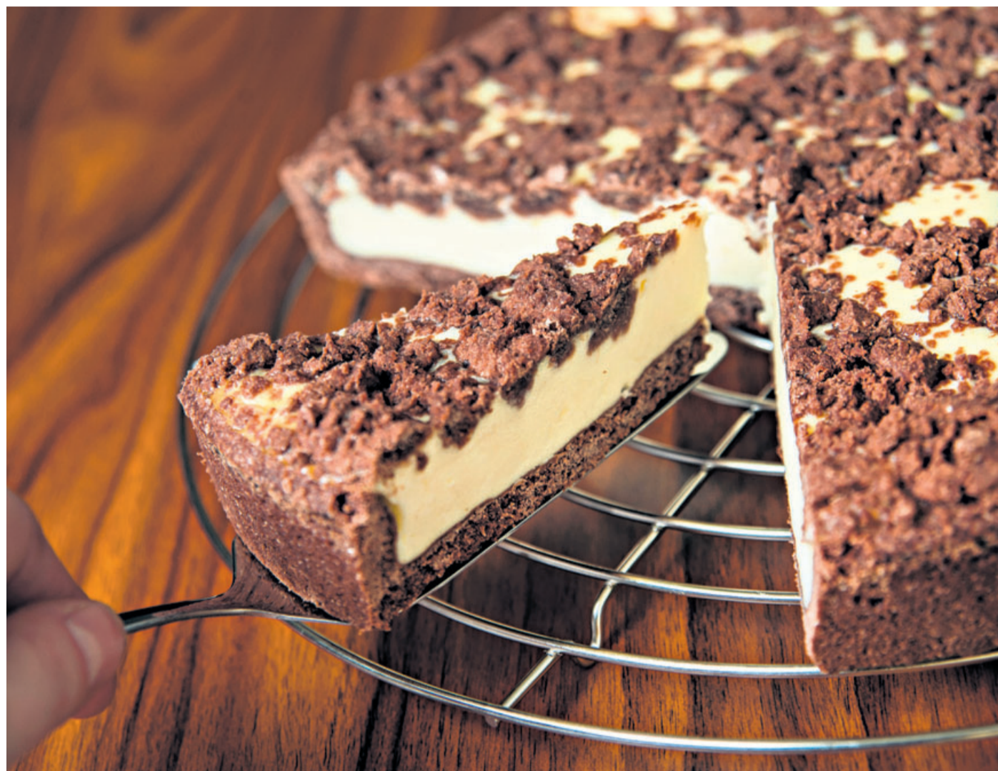
Für den Schoko-Mürbeteig eines runden Zupfkuchens (26 Zentimeter Durchmesser) sollten nicht mehr als 300 Gramm Mehl verwendet werden. Sonst wird der Teig schnell zu trocken.

Der Name wurde wohl erdacht, weil die Schokozupfen auf dem Kuchen ungebakken etwa so aussahen wie die Turmspitzen russischer Kirchen. «Da musste man aber schon viel Fantasie mitbringen», sagt Susann Jaensch. Wer den Kuchen backen möchte, muss es nicht bei Schoko-Mürbteig und Quark belassen. «Die Torte lässt sich auch