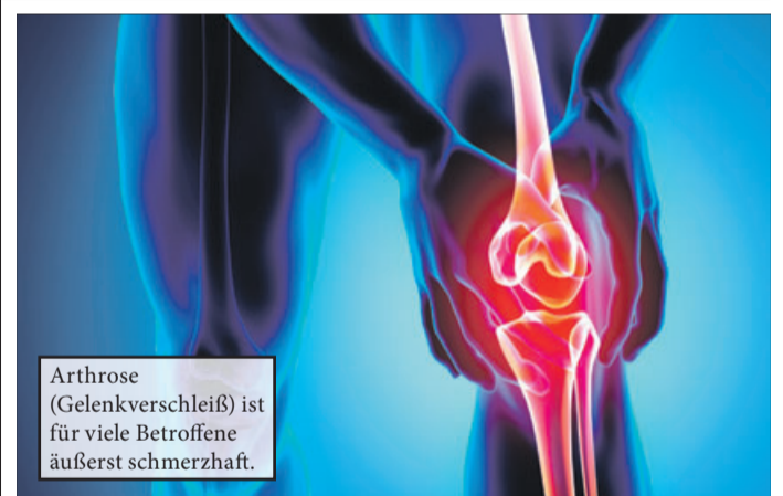
Arthrose (Gelenkverschleiß) ist für viele Betroffene äußerst schmerzhaft.