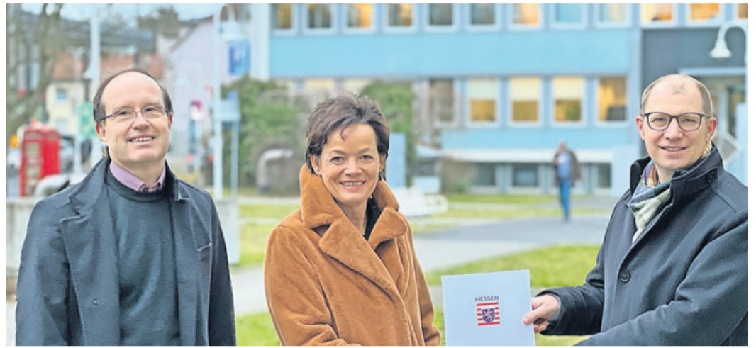
Bei der Bescheidübergabe an den Wetteraukreis: Tobis Utter, Mdl, Europaministerin Lucia Puttrich und Landrat Weckler (von links).

Insgesamt erhält der Wetteraukreis rund 19,6 Millionen Euro aus dem DigitalPakt Schule, die im Rahmen der Laufzeit für eine standardmäßige Ertüchtigung der IT-Infrastruktur sowie flächendeckendes WLAN und interaktive Schultafeln in allen Klassenräumen eingesetzt werden. Bis Ende Dezember 2021 hatte der Wetteraukreis fristgerecht alle Förderanträge gestellt. Die Europaministerin betonte bei der Übergabe die Bedeutung der Digitalisierung in den Schulen. „Bildung muss zeitgemäß sein. Ich bin froh, dass mit dem DigitalPakt Schule nun moderne einheitliche