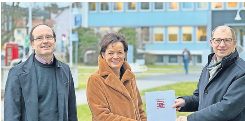
Bei der Bescheidübergabe an den Wetteraukreis: Tobis Utter, Mdl, Europaministerin Lucia Puttrich und Landrat Weckler (von links).

Insgesamt erhält der Wetteraukreis rund 19,6 Millionen Euro aus dem DigitalPakt Schule, die im Rahmen der Laufzeit für eine standardmäßige Ertüchtigung der IT-Infrastruktur sowie flächendeckendes WLAN und interaktive Schultafeln in allen Klassenzimmern eingesetzt werden. Bis Ende Dezember 2021 hatte der Wetteraukreis fristgerecht alle Förderanträge gestellt. Die Europaministerin betonte bei der Übergabe die Bedeutung der Digitalisierung in den Schulen. „Bildung muss zeitgemäß sein. Ich bin froh, dass mit dem DigitalPakt Schule nun moderne einheitliche Standards geschaffen