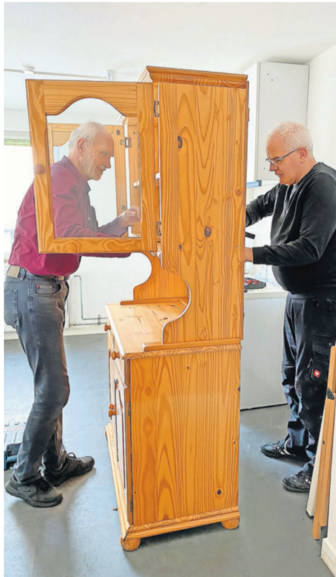
Im Kulturcafé „Nebenan“ wurde fleißig gearbeitet.

Die Planungen für weitere Veranstaltungen im neuen Jahr sind längst entwickelt, da heißt es wieder Geduld aufbringen und entscheiden – wegen des Pandemiegeschehens – Literatur-, Spiele- und Eltern-Kind- und Senioren-Café auf eine Zeit nach Ostern zu legen. Ebenso warten muss die Eröffnungs- und Geburtstagsfeier und der Beginn von Kreativworkshops. Die Zeit kann gut genutzt werden, um mit anderen Vereinen und mit interessierten Menschen Kontakt aufzunehmen, die in ihren Ideen und Projekten auch eine Möglichkeit sehen, mit dem jungen Verein zusammenzuarbeiten. Aus den Bereichen Nachbarschaftshilfe, Naturschutz und Kinder- und Jugendarbeit sind gemeinsame Gespräche vorgesehen und repräsentieren damit weiterhin einen Beitrag zur Gemeindeentwicklung für Jung und Alt. Im Hintergrund werden noch