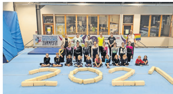
Die Turnerinnen der Sport-Union Nieder-Florstadt.

Nach den Sommerferien hat die Leistungsabteilung Turnen mit ihrem neuen Trainerteam ein neues Trainingskonzept angesetzt. Die Turnerinnen im Alter von 5 bis 21 Jahren haben die Neuerungen unter Pandemie-Bestimmungen super angenommen und auch umgesetzt. Jeder ist glücklich über ein wenig Abwechslung bei den ganzen Verboten. Dazu hat sich das