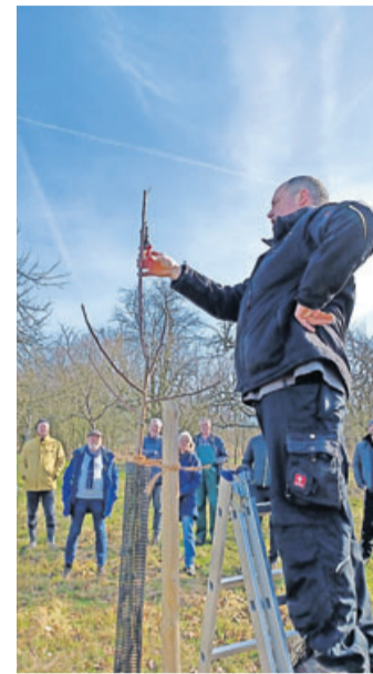
Jungbaum vor dem letzten Schnitt.