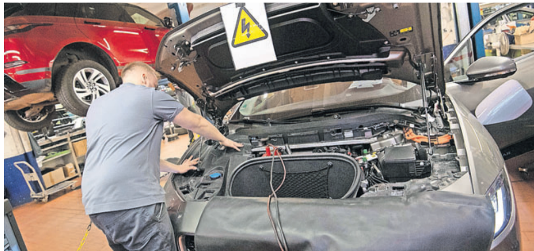
Ein fehlender Verbrennungsmotor ist kein Grund, bei der Wartung zu sparen: Auch Elektroautos müssen zur Hauptuntersuchung.

Der Stromer ist bald drei Jahre alt, Zeit für die erste Hauptuntersuchung. Aber was blüht mir da? Der Tüv-Verband hat sich vier beliebte Modelle mal angesehen und herausgefunden: Auch Elektroautos schwächeln beim Tüv – abhängig vom Modell kann der Prüfbericht durchwachsen ausfallen. Für die Auswertung wurden der BMW i3, Renault Zoe, Smart Fortwo Electric Drive und Tesla Model S angeschaut. Der elektrische Smart Fortwo schnitt am besten ab: Nur 3,5 Prozent der Fahrzeuge hatten erhebliche Mängel und fielen damit bei der Hauptuntersuchung durch. Es folgen der BMW i3 (4,7 Prozent), der Renault Zoe (5,7 Prozent) und der Tesla Model S (10,7 Prozent). Zum Vergleich: Bei den zwei bis drei Jahre alten Fahrzeugen mit