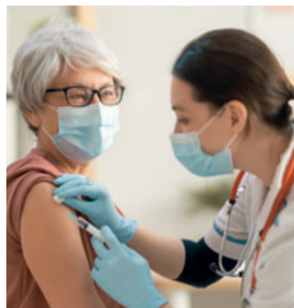
Jetzt Impfschutz verbessern mit Orthoexpert® immun v.

Selen die Antikörperbildung bei Impfungen durch eine bessere Immunreaktion verstärken und somit den Impferfolg verbessern. Diese einzigartige Kombination ist nun enthalten im neuen Orthoexpert® immun v (erhältlich in Apotheken; PZN 17580651).