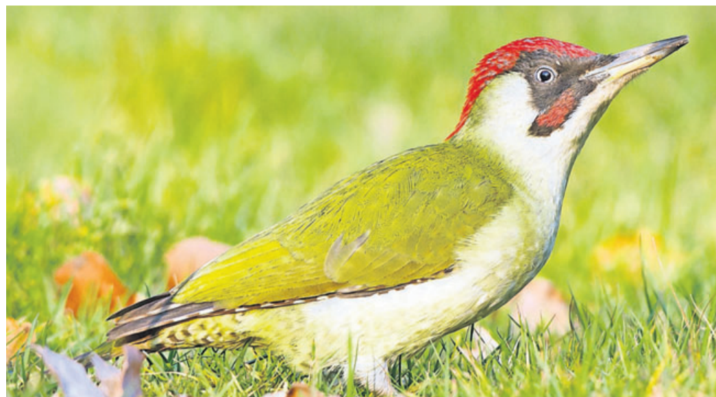
Ein Grünspecht sucht nach Nahrung.

Nabu Bad Nauheim lädt zur naturkundlichen Exkursion ein