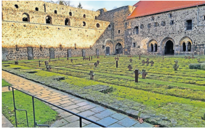
Die Kriegsgräberstätte im Kloster Arnburg.