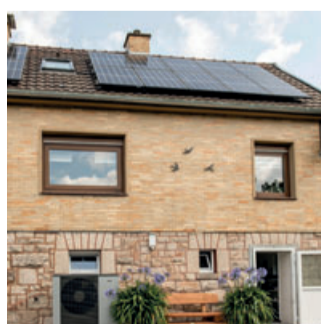
Mit einer Photovoltaik-Anlage selbst erzeugter Strom schafft Unabhängigkeit von steigenden Energiepreisen – NIBE PV-Smart macht die Nutzung in Verbindung mit einer NIBE Wärmepumpe besonders intelligent.

Voraussetzung: Die Wärmepumpen-Regelung sollte den von der Sonne erzeugten PV-Strom zu späteren Nutzung auf verschiedene Arten thermisch speichern oder in heißen Monaten zur Kühlung einsetzen können.