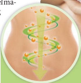
Kijimea Regularis gibt der Darmmuskulatur den Impuls, sich wieder zu bewegen – die Verdauung kommt in Schwung.

Die Verdauung aktivieren – sanft und zuverlässig