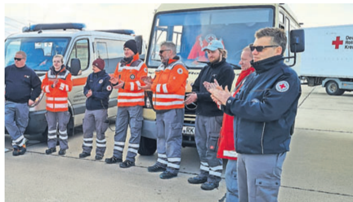
Einsatz Berlin Tegel der Technikgruppe aus Ober-Mörlen.

Für sieben ehrenamtliche Helfer der DRK Ortsvereinigung Ober-Mörlen bedeutete der über eine Woche dauernde Einsatz in Berlin eine neue Erfahrung. Als Teil der sogenannten Landesverstärkung des DRK Landesverbandes Hessen wurden Sie mit materieller und personeller Verstärkung von 35 weiteren hessischen Rotkreuzhelfern aus dem DRK-Lager Fritzlar nach Berlin entsandt, um auf dem ehemaligen Flughafen Tegel