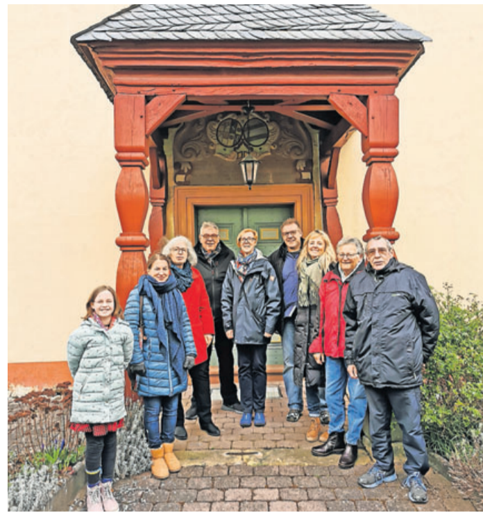
Die Theatergruppe vor dem Eingang der evangelischen Kirche Ober-Hörgern.

Die Rundwanderung wird an verschiedenen Stellen unter-